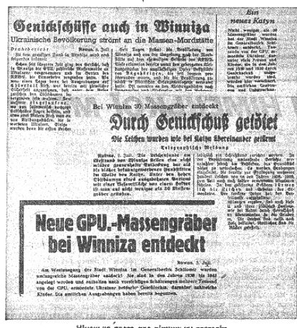
Німеччина преса про вінницьку трагедію

Доволі часто задля того, аби підкреслити, що увесь цивілізований світ прикутий увагою до Вінницької трагедії, на сторінках окупаційної преси з'являлись тексти з підкресленими заголовками від іноземної преси. Наприклад, на сторінках вісника добровольчих загонів «Набат» від 7 серпня 1943 року з'явилась публікація під заголовком «Французская газета о винницких могилах» 16 зі стислим викладом вражень французького кореспондента газети «Матен», який відвідав вінницькі поховання. На сторінках «Одеської газети» від 11 червня 1943 року вміщено огляд «Німецька преса про вінницьку трагедію», в якій наводяться короткі цитати з німецького видання «Дойче Альгемейне Цайтунг» та «Берлінер Берзен Цайтунг» 17 задля того, аби підтвердити правдивість своїх слів. Іноді подавались навіть фото статей німецької періодики (додаток 3), як то на сторінках «Нової доби» 18 . На шпальтах «Олевських вістей» 19 передрукували враження головного редактора часопису «Неа Європі», який виходив Салоніках, передову статтю шведського часопису «Дагс Постен» «Большевизм