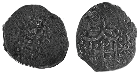
Рис. 1 24 .