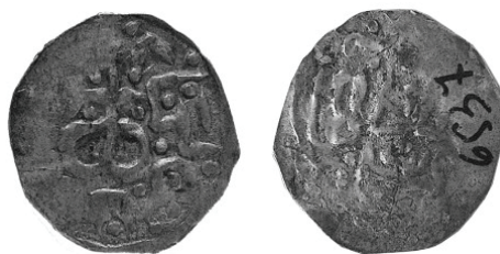
Рис. 2 25 .