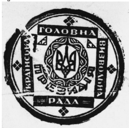
Печатка Президії УГВР.

відно до того треба відкинути до тогочасні, “пережиті вже” засади українського націоналізму, викоренити їх у власних рядах, змінити свою ідеологію й програму» 46 . Критикуючи оунівських «демократів», С. Бандера називав їх «кон’юнктуристами», які від 1945 р. намагалися втягнути українську самостійницьку політику в таку ж саму гру в демократію, яка відбувається на міжнародному форумі, й у якій СССР грає одну з перших скрипок. Демократичні зміни в