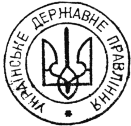
Печатка Українського державного правління.

Роль передпарламенту мала виконувати Українська Національна Рада на чолі з К. Левицьким (почесним головою також був митрополит УГКЦ А. Шептицький).