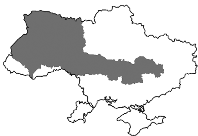
Територія, на якій органи місцевої влади заявили про підкорядкування УДР.

парламентом); представництва всіх працюючих верств у державних законодавчих органах; організації та селекції національно-державного керівництва усіх верств; однієї світоглядно-політичної організації; незалежності судочинства від адміністративної і виконавчої влади, лише формального його підпорядкування главі держави (причому суди повинні виносити вирок в ім'я нації й глави держави).