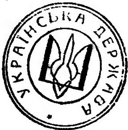
Печатка Української держави, 1941 р.

Саме з цих причин та умов, що кардинально змінилися з часу початку світової війни, у серпні 1943 р. ОУН С. Бандери зібрала свій Третій великий (надзвичайний) збір, який «розглянув минулу боротьбу і розробив плани на майбутнє» 38 . ОУН(б) бачила майбутню державу Україна без офіційного насадження світоглядних доктрин і догм. У ній мала б бути гарантована свобода друку, слова, думки, переконань, віри і світогляду, а також вільне віросповідання і відправлення релігійних обрядів (вільне визнання і виконання