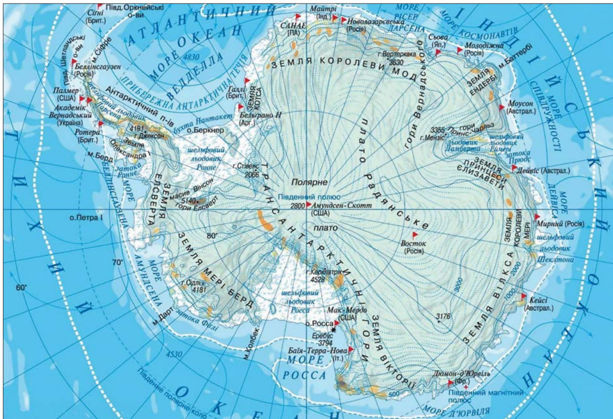
Розташування дослідницьких станцій в Антарктиді

900 км. «Ушуая» в перекладі з мови індіанців корінного племені ямана означає «затока».