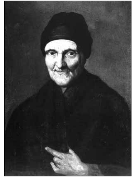
Рис. 5, 6. І. Сошенко. Портрет бабусі Чалого

Леонід став тією людиною, якій М. Чалий перед своєю смертю доручив унікальні документи, якими дуже дорожив (шевченковий архів), передати до українського музею та вручити його особисто М.Т. Біляшівському, одному з організаторів музею у Києві в 1904 р.