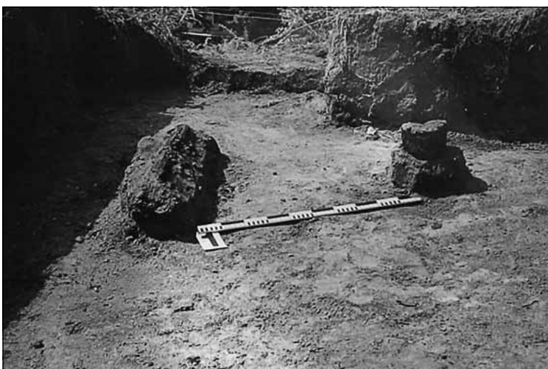
Рис. 6. Залишки оборонних споруд у розкопі 5. 1965 р.

них дворян або дітей боярських, які за віком або станом здоров'я не могли нести полкову чи дозорну службу [1, с. 77–79]. Прикордонний статус Путивля вимагав постійного перебування гарнізону у дозорі на баштах. Для цього створювався запас продовольства у нижній частині та обігрів для ратних людей у середній. На третьому ярусі знаходився бойовий або спостережний майданчик (чердак).