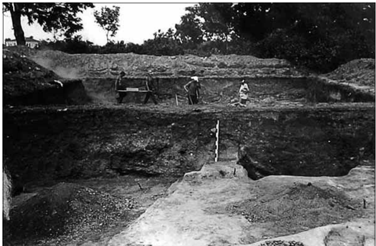
Рис. 3. Загальний вигляд розкопів 6 та 7. Фото Б.О. Рибаківа 1965 р.

У цьому випадку зафіксовано рештки башти, що була зведена на місці давньоруських укріплень. Перший план Путивльської фортеці, зображений на «Чертеже Обоянской провинции» початку XVIII ст., зафіксував місце розташування її башт [8]. Співставлення плану розко-