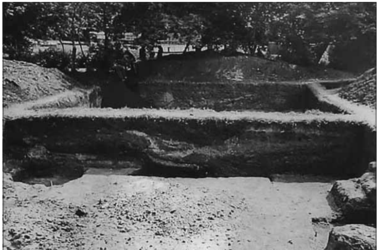
Рис. 4. Загальний вигляд розкопів 1 та 2. Фото Б.О. Рибаківа 1965 р.

пів Б.О. Рибаківа та креслення XVIII ст. дає змогу локалізувати її з високою долею вірогідності. В.В. Вечерським опубліковані дані про укріплення міста Путивль, зокрема, назви башт [5, с. 312]. Підсумовуючи інформацію археологічного звіту, даних креслення та опису міста, припускаємо, що об'єкт, досліджений у 1965 р., є рештками Малої нової башти, яка знаходилася у північно-західній частині городища. Вона мала три яруси. Нижній ярус використовувався як комора або льох. На це вказує потужний шар згорілого зерна та обуглених кісток. Над ним знаходився житловий ярус, який мав обігрів. Виявлені шари з включенням цегли відносяться до черніна, у котрому використано давньоруську плінфу, та самої печі, конструкція якої складалася з цегли і дерев'яного каркаса, обмазаного глиною. У цьому приміщенні перебували караульні, що несли службу по-городовому. До городової (осадної) служби залучали певну категорію служилого населення – дрібнопоміс-