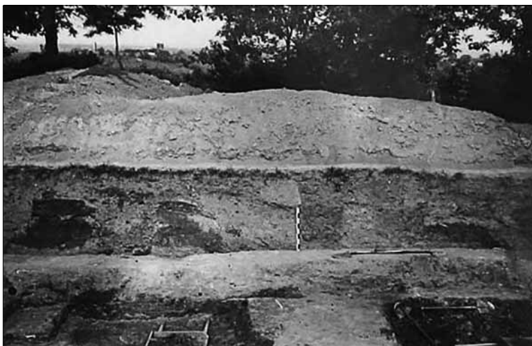
Рис. 5. Західний профіль розкопу 1. 1965 р.