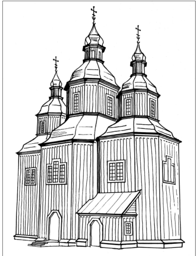
Рис. 1. Бароко українське. Миколаївська церква у с. Городищі Чернігівської області. Наукова реконструкція первісного вигляду і рисунок В.В. Вечерського

Авторові цієї статті довелося протягом 2020 р. розбиратися в сутності складного стилістичного явища і відповідних термінологічних дефініціях, працюючи над статтями про архітектуру до Великої української енциклопедії (далі – ВУЕ) [2]. Це наукове і практичне завдання виявилось не тільки важливим, а й непростим, оскільки універсальна енциклопедія має подати об'єктивну інформацію про явища, а не особисту авторську позицію того чи іншого дослідника. Оскільки у ВУЕ присутні гасла (тобто терміни й відповідні їм статті): відродження, ренесанс, бароко, українське бароко, козацьке бароко, мазепинське бароко, то слід було їх чітко розмежувати, дати кожному визначення і описати як феномени історії архітектури. При цьому не можна забувати про те, що усі ці явища й дефініції між собою пов'язані, тож їх належить ще й узгодити.