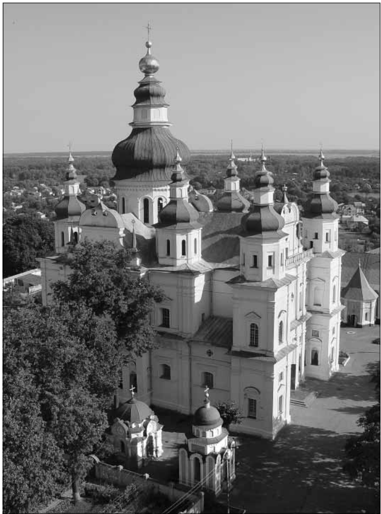
Рис. 3. Бароко мазепинське. Троїцький собор Троїцько-Іллінського монастиря у Чернігові.

У межах українського бароко останнім часом виділяють так зване козацьке бароко. Цей термін часто вживають як синонімічний, але у вужчому значенні: тільки стосовно архітектурних фундацій козацтва й представників його старшини. Таке означення архітектурної стилістики вказує на її соціальну обумовленість, бо козацтво внаслідок переможної революції (Хмельниччини) у серед. XVII ст. перетворилося на наймогутнішу суспільну силу, яка ви-