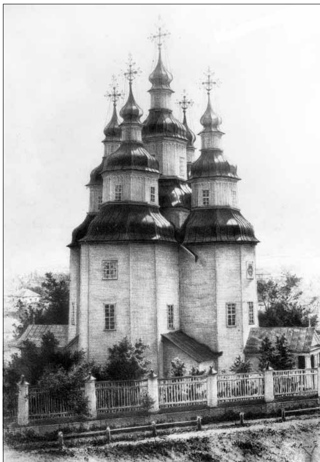
Рис. 2. Бароко козацьке. Покровська церква у Ромнах. Літографія з рисунку О. Сластіона 1910-х рр.

їхньої національної архітектури XVII–XVIII ст. Дискусія, розпочата тоді, не завершена дотепер. Одні (М. Макаренко [4], В. Модзалевський, П. Савицький [5, с. 119, 123]) вважали цей стиль в архітектурі українським відродженням; інші (Г. Павлуцький [3], І. Грабар [6], Д. Антонович [7, с. 248], В. Січинський [8, с. 115], Г. Логвин [9, с. 51]) – українським бароко; треті (Я. Тарас [10, с. 210–212]) – бароко козацьким; інші (М. Шумицький [11], М. Цапенко [12]) – українським національним стилем; зрештою (В. Вечерський) – ренесансно-бароковим синтезом в умовах хронологічної ретардації [13, с. 111–112]. Ф. Ернст у 1919 р. виділив хронологічний етап, який він назвав мазепинським бароко [14]. Тепер найпоширенішим є визначення «українське бароко».