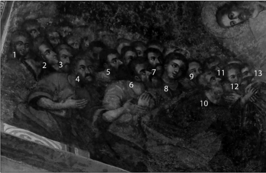
Іл. 4. Свояки І. Мазепи у композиції «Зішестя в пекло» Софії Київської.

– припущення, які потребують додаткових доказів. Крайнім у верхньому ряду світських осіб (№ 1) художник міг би поставити К. Мокієвського, але саме після походу 1701 р. київський полковник потрапив в опалу (старшина написала на нього скаргу, що знущався над І. Обидовським), був усунутий з посади. Тому навряд чи старшину-родича через ці обставини могли поставити у почесний ряд.