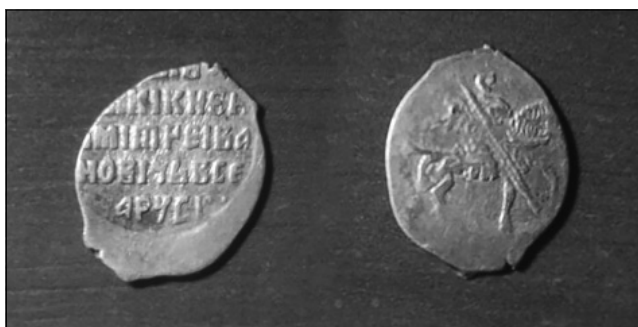
Рис. 1. Московське царство, Лжедмитрій I (1605–1606), срібна копійка, с. Будищі Глухівського р-ну, 2016 р.

Речі Посполитою і до драйпелькера Прибалтійських володінь Швеції чи Пруссії [1].