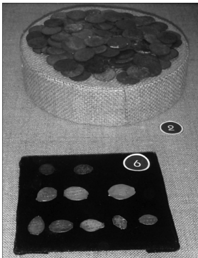
Рис. 2. Фрагмент експозиції музею археології Національного заповідника «Глухів». № 2. Скарб мідних солідів Речі Посполитої 1659–1666 рр. № 6. Срібні копійки Московського царства XVI–XVII ст.

В ході проведення грошової реформи Петром I у 1698–1718 рр. на території Глухівщини, яка межувала з Московським, а з 1709 року Російським царством, в грошовому обігу набувають поширення срібний рубль (вагою 28 г), полтина (14 г), полуполтина (7 г), гривенка (10 копійок), мідні полушки (1/4 копійки), денга (1/2 копійки), 1, 2, 5, 10 копійок російських імператорів Петра I, Анни Іоанівни, Єлизавети Петрівни, золотий імперіал (10 срібних ру-