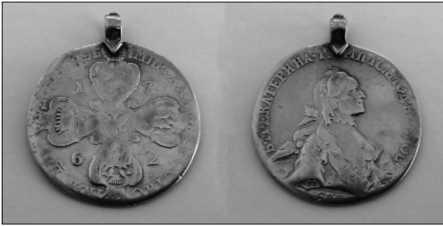
Рис. 7. Російська імперія, Катерина II (1762–1796), 10 золотих рублів (імперіал) 1762 р. (дукач), м. Глухів, 2012 р. XVIII ст.: Михайла Федоровича Романова (1613–1645), Олексія Михайловича та Петра Олексійовича. Серед кількох десятків дротяних копійок-«чешуйок» було виявлено чотири срібні петровські копійки круглої форми, машинного карбування 1713 р., 1714 р., 1718 р. На аверсі останніх зображено Георгія Переможця на коні, який списом вбиває змія, на реверсі – напис «ко-пейка» у два рядки та дата цифрами.

Окремі скарби були досить значними і різноманітними. Ще один змішаний скарб Глухівського Петропавлівського монастиря, виявлений у 2009 р., складається з 70 «чешуйок» Михайла Федоровича Романова, Олексія Михайловича (1645–1676) XVII ст. та 15 срібних і 50 мідних монет Петра Олексійовича початку XVIII ст. (переважно рублі, полтини, копійки, денги та полушки). Стан збереження монет скарбу задовільний.