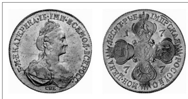
Рис. 6. Російська імперія, золотий імперіал (10 рублів), Катерина II (1762–1796), 1777 р., с. Пустогород Глухівського району, 1978 р.

Перший скарб російських монет XVIII ст. на території Глухівського Петропавлівського монастиря був виявлений у серпні 1993 р. Він містив п'ять мідних копійок Єлизавети Петрівни 1760 р., десять мідних копійок 1762 р. Пе-