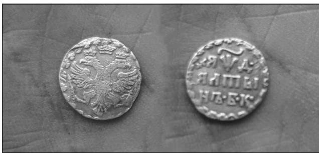
Рис. 3. Московське царство, Петро I (1682–1725), срібний алтин (три копійки) 1704 р. с. Будищі Глухівського р-ну, 2017 р.