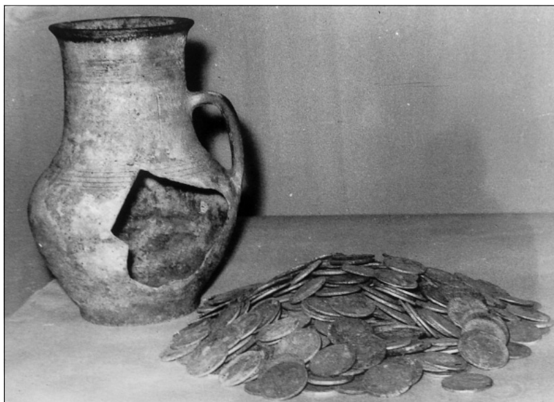
Рис. 9. Російська імперія, скарб срібних рублів і золотих імперіалів Катерини II (1762–1796), с. Пустогород Глухівського р-ну, 1978 р.

покладений у керамічний глечик і захований у землю. Усі монети перебували в відмінному стані: вага рублів становила від 28, 44 г до 24 г, проба срібла – від 720 до 800; вага полтин – від 14,22 до 12 г, проба срібла – від 720 до 800. У комплексі наявні монети Петра I, Катерини I, Петра II, Анни Іоанівни, Іоанна Антоновича, Єлизавети Петрівни, Катерини II. Вдалося дослідити наступні монети скарбу: рублі Петра I 1724 р. (ММД), 1727 р. Петра II, 1733 р., 1738 р. Анни Іоанівни (СПБ), 1744 р. (СПБ.), 1747 р. (ММД), 1751 р. (ММД) Єлизавети Петрівни, 1762 р. (СПБ) Петра III, 1768 р. (ММД) Катерини II; полтини: 1734 р., 1735 р. Анни Іоанівни; 1745 р., 1754 р., 1755 р., 1756 р., 1758 р. (СПБ) Єлизавети Петрівни; 1764 р. (СПБ), 1768 р. (ММД) Катерини II. Найстаріша монета скарбу – рубль 1724 р. Петра I, наймолодша – срібний рубль 1768 р. Катерини II. Період накопичення скарбу становив 44 роки, тобто два покоління [4, с. 114].