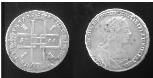
Рис. 4. Російська імперія, Петро I (1682–1725), рубль 1724 р., с. Будищі Глухівського р-ну, 2017 р.

Монастирська казна, як правило, складалася із золотих дукатів, срібних талерів, півталерів, ортів (1/4 талера), шо-