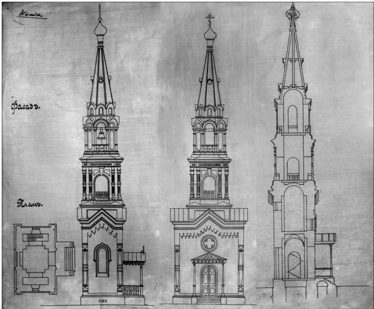
Рис. 3. Проект кам'яної дзвіниці: план фундаменту, боковий фасад, головний фасад, розріз

окрему споруду (Рис. 5), але проект так і не був утілений у життя. Дзвіницю звели, але конструктивно вона відрізнялася від запропонованої і була влаштована у західній частині церкви перед бабинцем.