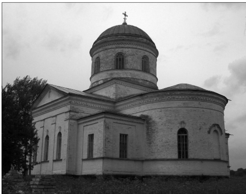
Рис. 2. Кам'яна Покровська церква у с. Некрасове (1904 р.) Фото 2015 р.

прохання не задовольнила. Натомість у листі, надісланому до консисторії, вимагалось дослідити Покровську церкву і докласти всіх зусиль для її ремонту та збереження, а якщо це неможливо, то розібрати її і перенести на інше місце зі збереженням первісного вигляду. Також вимагалось надіслати знімки іконостаса старої церкви, архітектурних планів та розрізів, зробити докладний опис храму за наданим стандартним бланком метрики. Оскільки до листа парафіян додавалась фотографія Покровської церкви для ознайомлення Археологічної комісії з її станом, за наявним зображенням було зроблено зауваження з вимогою провести ремонт та вставити вікна, які, як видно на фото, були вибиті. Іншого листа парафією було направлено у вересні 1911 р. В ньому повідомлялось про неможливість вишукати кошти на утримання старої дерев'яної церкви. По-перше, на той час пройшло тільки п'ять років після закінчення будівництва нової кам'яної Покровської церкви та розпочато будівництво дзвіниці; по-друге, потрібні були кошти на будівництво квартири для священника та огорожі навколо парафіяльного кладовища. Парафія не мала фінансів на утримання у належному стані старої Покровської церкви. У наступному листі зазначалось, що її плани та розрізи не збереглися, а іконостас, перенесений до нової мурованої церкви, зазнав суттєвих змін і втратив свій попередній вигляд внаслідок пристосування під інтер'єри нового храму [7, арк. 1–6].