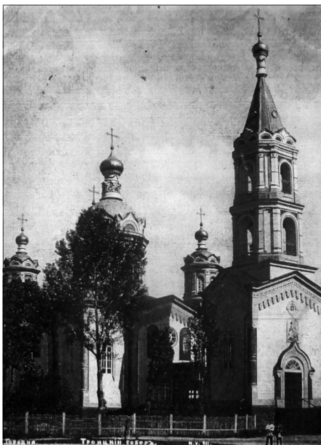
Рис. 4. Дзвіниця храму Святої Трійці у м. Городні Чернігівської губ. Фото кін. XIX – поч. XX ст.

притворів. Всі вони оббиті листовим залізом і пофарбовані блакитною фарбою. Дах також вкритий оцинкованим залізом і пофарбований. Церква зведена у стилі класицизму – досить популярному у церковному будівництві на теренах колишньої Гетьманщини на початку XIX ст. І хоча на зміну класицизму вже у другій половині XIX ст. приходять інші архітектурні форми, будівництво подібних храмів ще деякий час продовжувалося аж до початку XX ст. Зокрема, на Глухівщині майже ідентичний храм знаходиться у с. Шалигині. Автентичність його, на відміну від некрасівського, була значно порушена у часи совєцької антирелігійної боротьби, але навіть зараз можна стверджувати, що ці храми були збудовані за аналогічним креслениками.