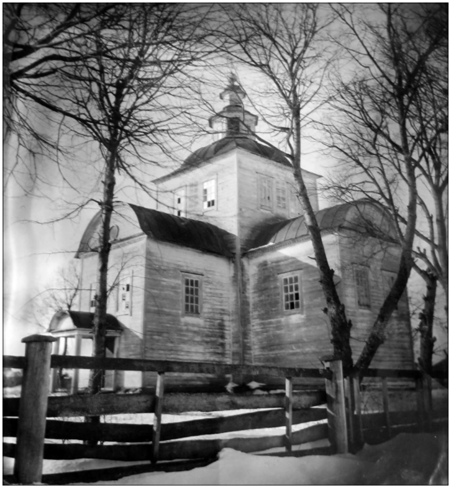
Рис. 1. Дерев'яна Покровська церква у с. Некрасове (1795 р.). Фото поч. XX ст.