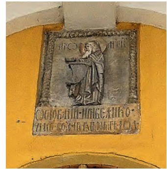
Ілюстр. 2. Фрагментований рельєф-триптих з образами Марії Оранти, Антонія та Феодосія