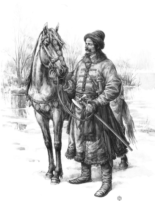
Убрання київського дружинника. Реконструкція за матеріалами дружинних поховань X ст. Малюнок О.В.Федорова

Київський літопис під 1151 р., Ізяслав зазнав поранення в битві з військом Юрія Долгорукого на Перепетовому полі поблизу річки Руті. Коли він отямився й намагався схопитися на ноги, піші київські воїни хотіли його вбити,