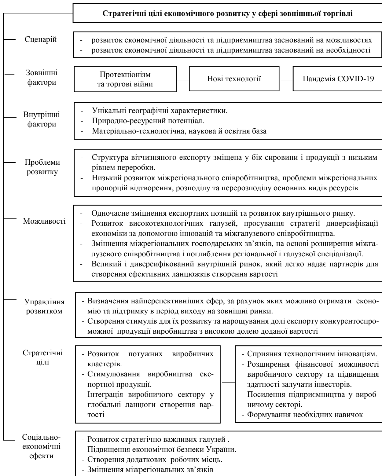
Рис. 2. Визначення стратегічних цілей економічного розвитку на основі узгодження регіональної та зовнішньоторговельної стратегії (складено М. Д. Крамчаніновою)

підприємства якої часто стають ключовими партнерами транснаціональних корпорацій при розробці нових продуктів або виході на нові ринки.