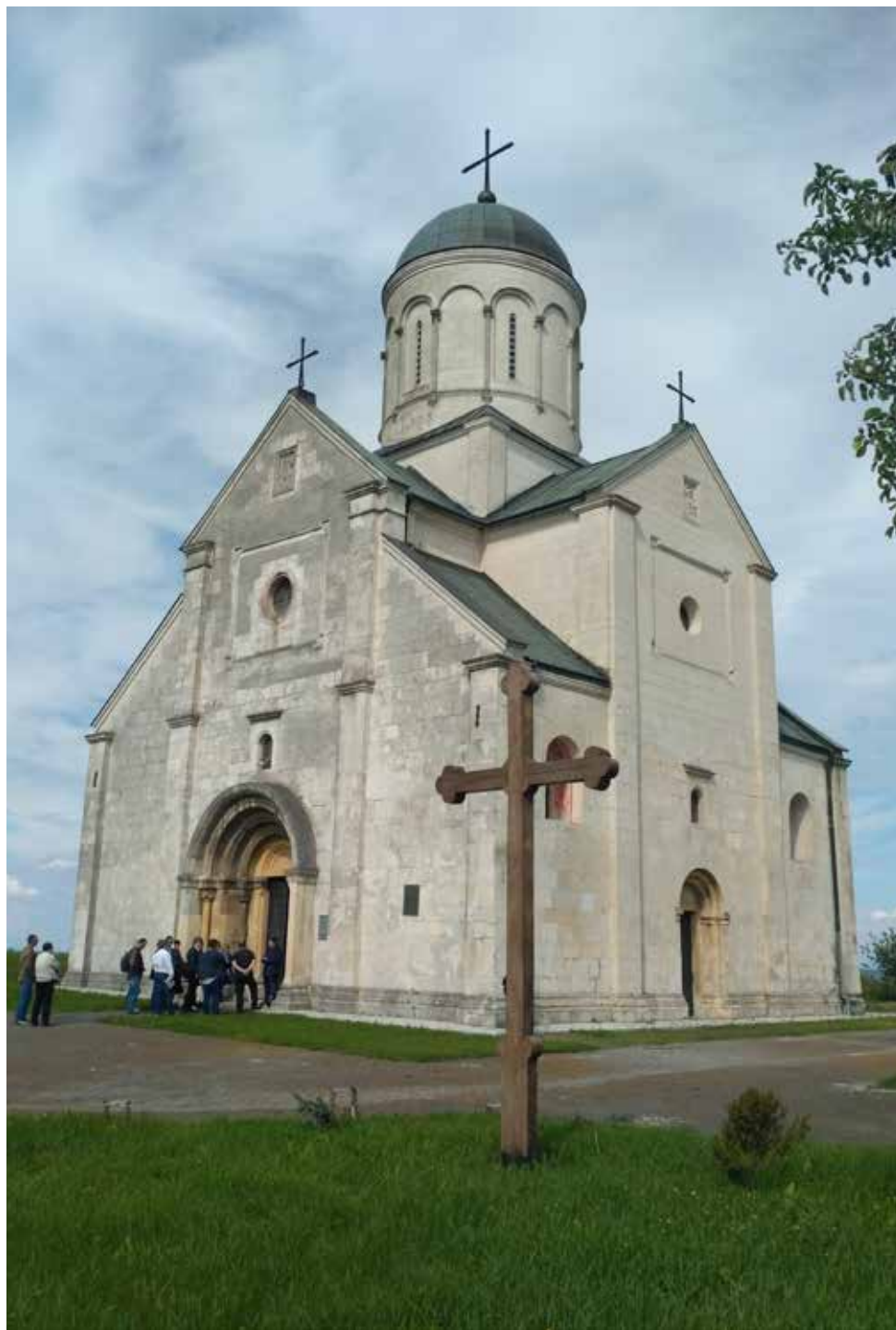
Мал. 1. Храм святого Пантелеймона в Галичі. Фото автора, листопад 2017 р.