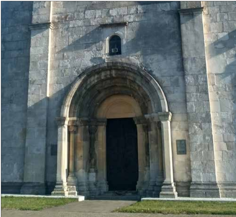
Мал. 5. Західний фасад церкви святого Пантелеймона в Галичі. Фрагмент.

від середини 90-х років XII ст. немає підстав твердити взагалі про якусь залежність Володимира Ярославовича від Всеволода Юрійовича (якщо така взагалі існувала!), оскільки тоді галицький князь уже в союзі з київським князем Рюриком Ростиславовичем, а в 1196 р. разом з його сином Ростиславом здійснив напади на волинські володіння князя Романа Мстиславовича 63 .