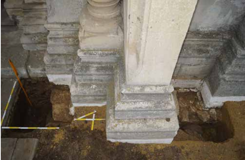
Мал. 3. Відкритий фрагмент фундаментів храму святого Пантелеймона. листопад 2019 р.

на момент укладення династичного союзу Феодора була ще дитиною 23 . На нашу думку, взимку 1187–1188 рр. вона мала не більше семи років.