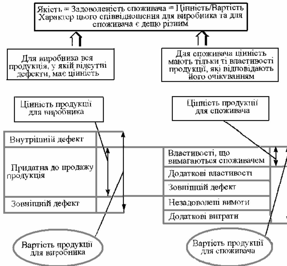
Рис. 1. Якість і задоволеність споживача

них елементів живлення рослин, що вирощуються за інтенсивними технологіями.