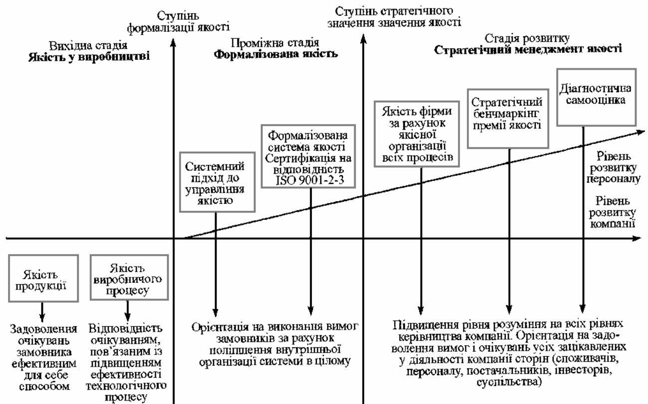
Рис. 2. Стратегічний підхід у становленні та розвитку систем управління якістю харчової продукції

ліпшення якості харчової продукції (Е) слід визначити за формулою: