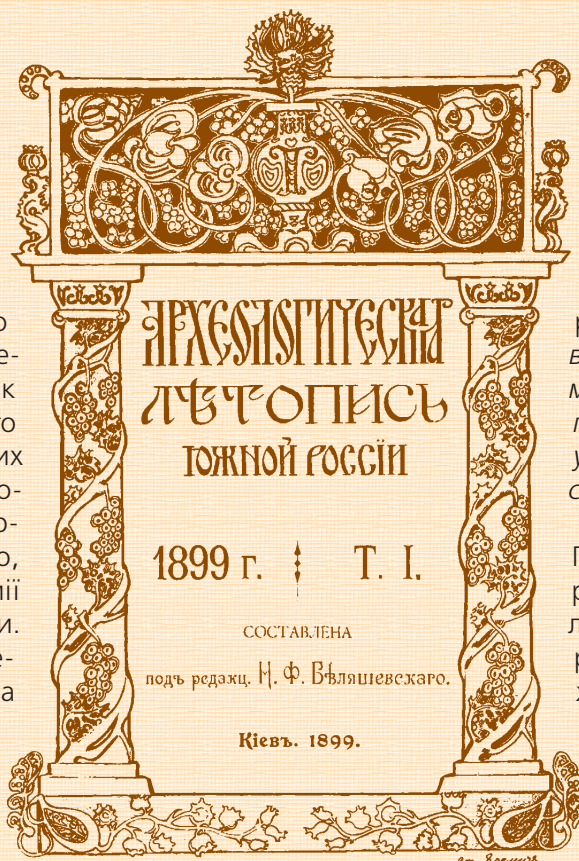
Титульний лист до часопису "Археологическая летопись Южной России". Автор С. Яремич

Як до талановитого експерта до нього постійно зверталися щодо оцінки того чи іншого твору мистецтва. Після лютневої революції 1917 р. С. П. Яремич бере участь у нараді діячів культури, яка відбувалася за ініціативою та на квартирі Максима Горького. Йому одному з перших після жовтневих подій надходить урядова телеграма із запрошенням прийти до Зимового палацу на конференцію художніх комісій колишнього Міністерства двору. Він відгукнувся і багато зробив у