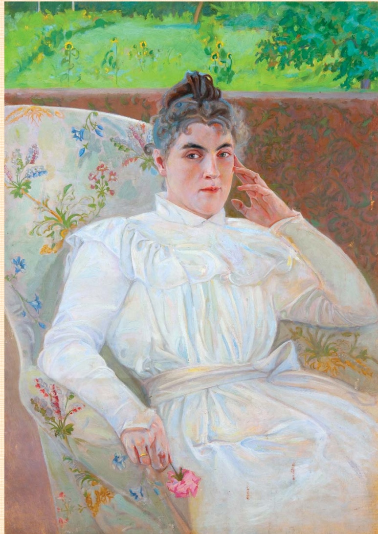
С. П. Яремич (?). Портрет молодої жінки. Поч. XX ст. П., м.

Степан Петрович Яремич тривалий час працював далеко від Києва. Але від рідного краю, де народився, його віддаляли тільки відстані. У думках завжди жив, а в серці носив його. Про це свідчать і творчість, і турбота про свою "альма-матер" – київську Лавру [11–12], і навіть те, що ніколи не розлучався з книгами, котрі нагадували йому про Київ.