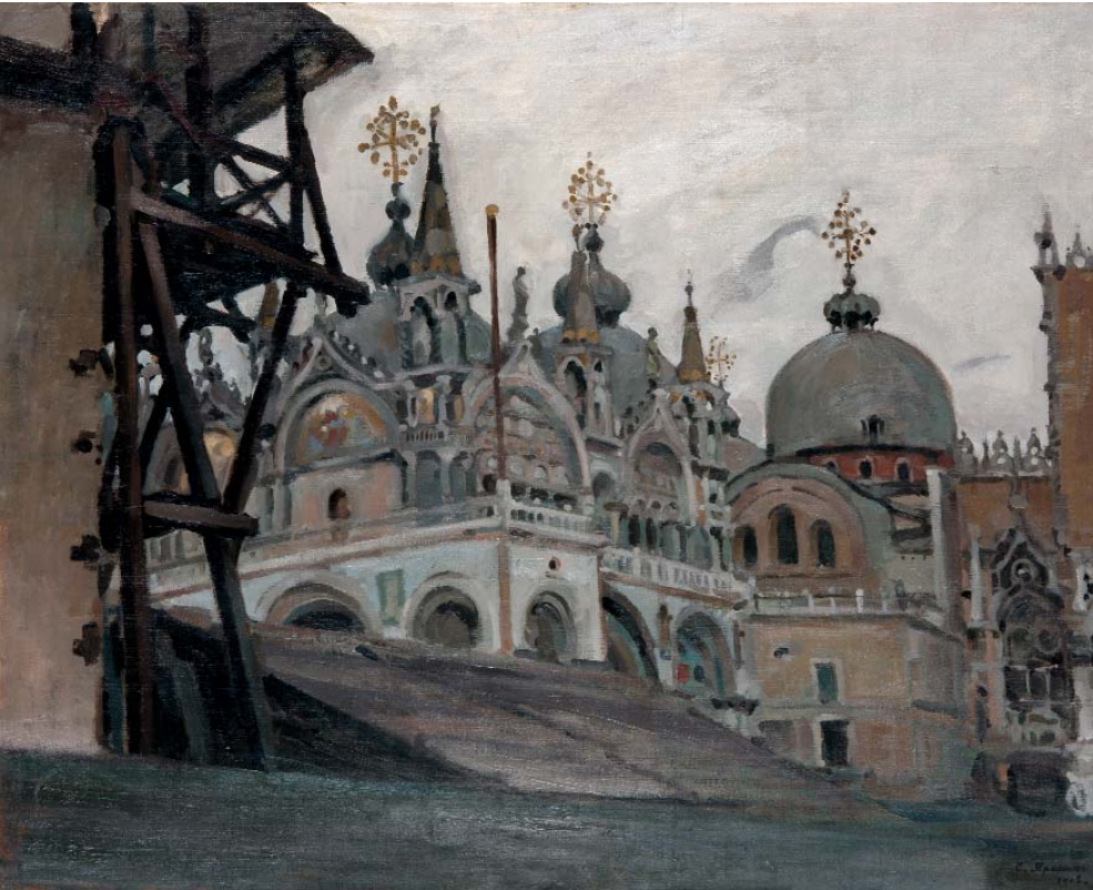
С. П. Яремич. Вид Венеції. Собор Св. Марка. 1908. П., м.