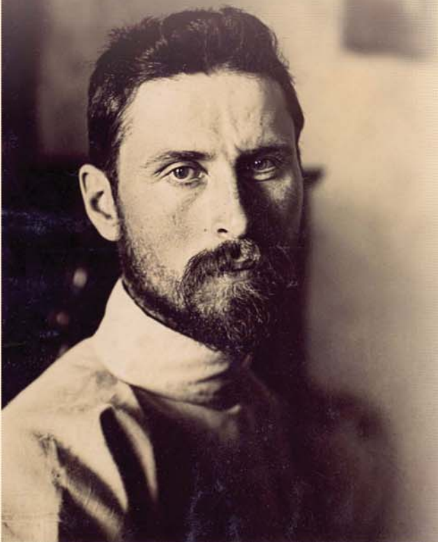
Портрет Степана Яремича. 1900. Із фондів Національного художнього музею України.

Його називали найвидатнішим, блискучим знавцем мистецтва, додаючи слова "яких нараховуються одиниці", людиною енциклопедичних знань, першокласним діячем культури. А директор Державного Ермітажу академік Борис Піотровський (1908–1990) відзначав: "С. П. Яремич — цілковито значуща, цікава і колоритна фігура у художньому світі" [1]. Степан Петрович завдяки природним здібностям, знанням, постійній цілеспрямованій праці опинився в числі перших трьох співробітників