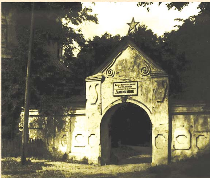
Монастирська брама, перетворена на вхід до Кирилівського заповідника.

Вид на Кирилівський заповідник. 30-і р. XX ст.