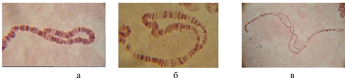
Рис. 3. Эктопическая конъюгация и асиапсис гомологов в хромосоме 3R: а – эктопическая конъюгация между районами 100F и 92 EF; б- нарушение асиапсиса при эктопической конъюгации между районами 100F и 92 EF; в – нарушение асиапсиса в отсутствие эктопической конъюгации между районами 100F и 92 EF