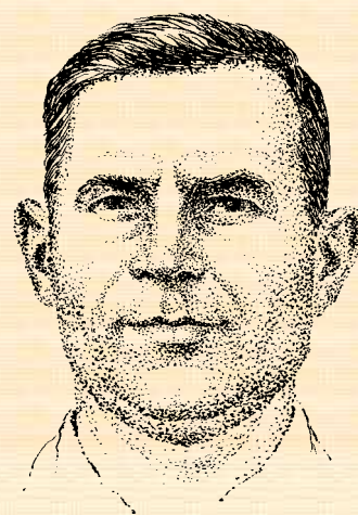
Українці Середньої Наддніпрянщини та Поділля (узагальнені антропологічні портрети)