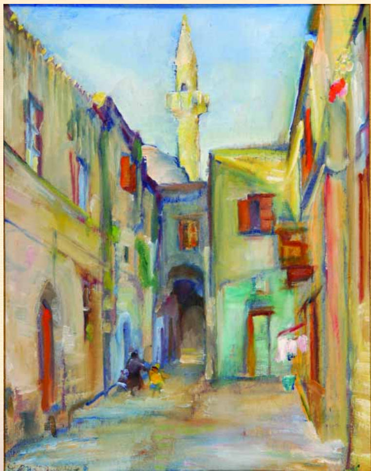
Мій готель на острові Родос. 1977 р. п., о., 27x21 см