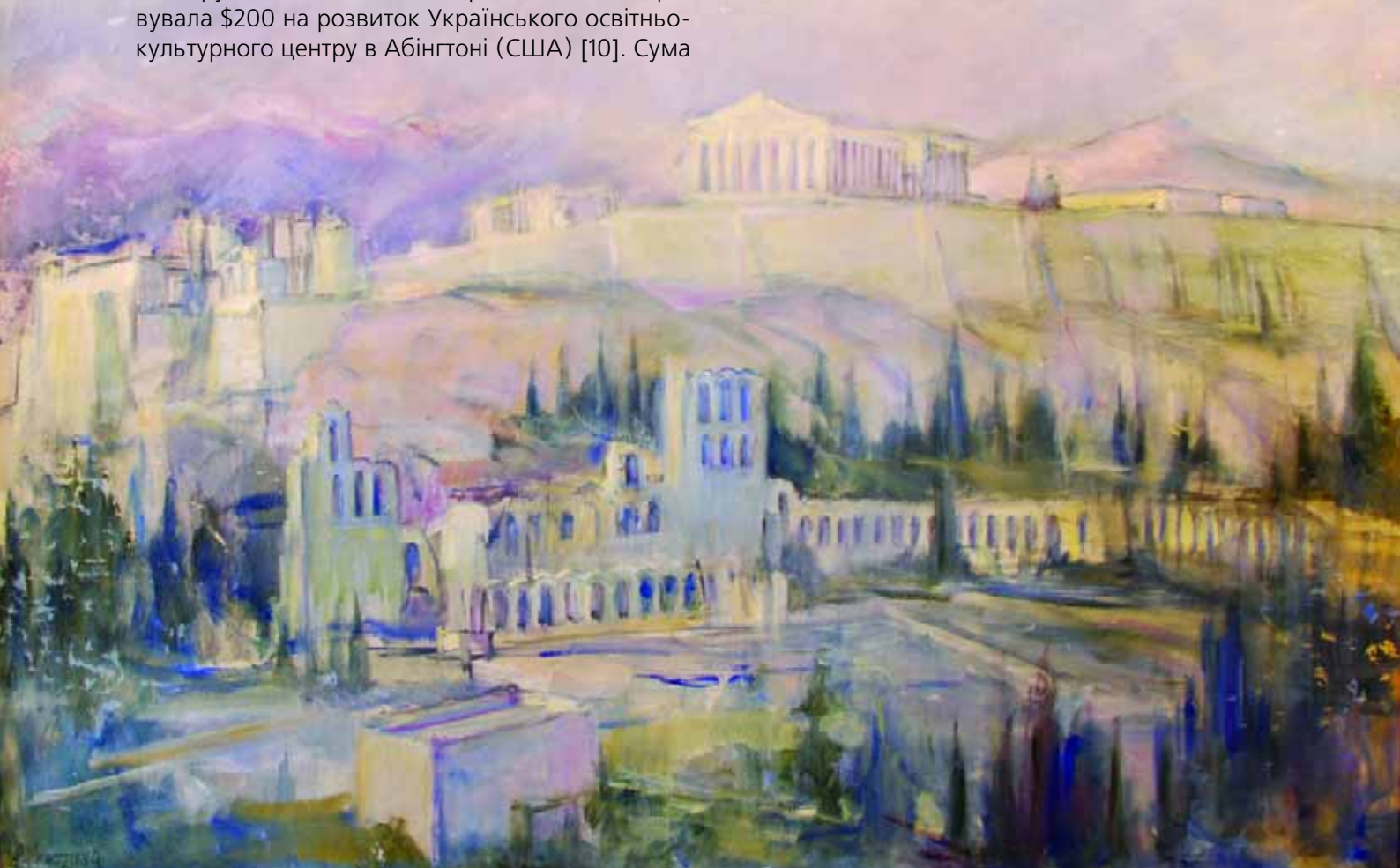
Панорама Акрополя. 1960-ті рр. п., о., 100x124 см