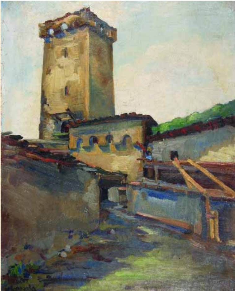
Сванетія. Местія. 1936 р. п., о., 63,5x51 см