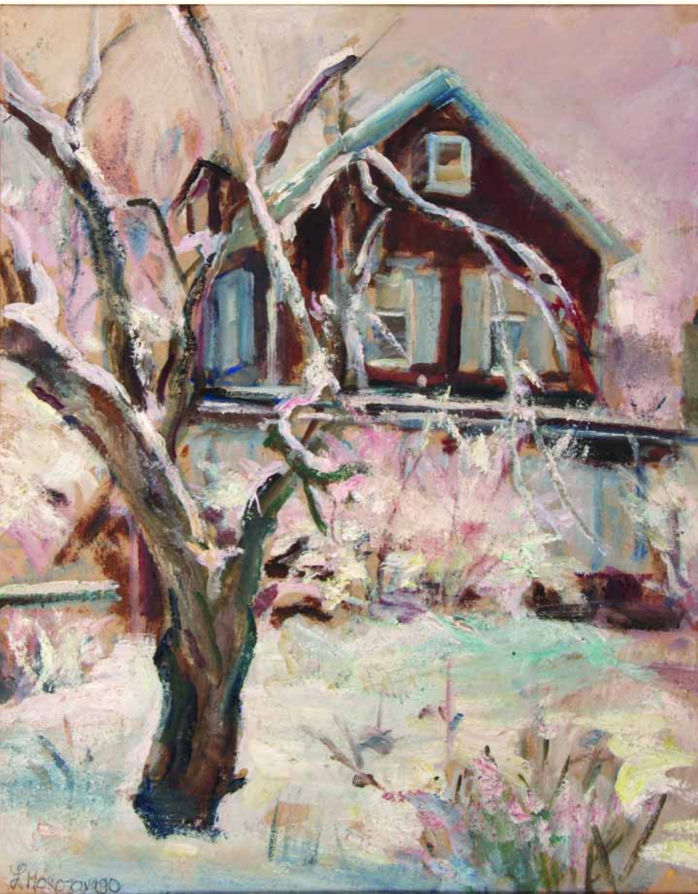
Зимовий пейзаж. 1990 р. к., о., 56,5x45,5 см