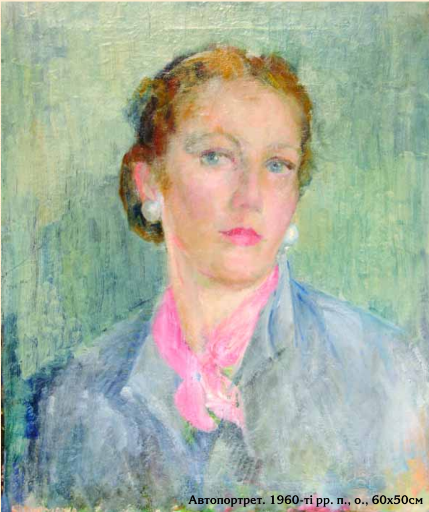
Автопортрет. 1960-ті рр. п., о., 60x50см

2 м'я української художниці-імпресіоністки Людмили Морозової (1907–1997) знане в багатьох країнах світу. Але на Батьківщині впродовж десятиліть її творчість була невідомою навіть серед фахівців. Це й не дивно, адже в буремні роки Другої світової війни опинилася вона на чужині й після довгих років поневірянь поповнила ряди української діаспори у Сполучених Штатах Америки. Л. Морозова – автор численних портретів, автопортретів, сакральних творів, натюрмортів, краєвидів України, Німеччини, США та Греції.