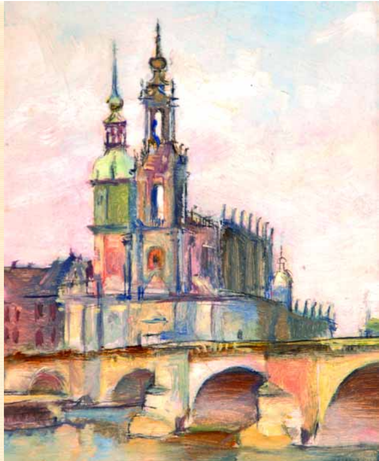
Дрезден. 1944 р. к., о., 22х16,5 см

У 1936 р. Людмила стала учасницею складної експедиції до Сванетії, яку очолив професор І. Моргілевський (1889–1942) – відомий науковець, член-кореспондент Академії архітектури СРСР. Сванетія, що ховалася глибоко в горах Мінгрелії, зберегла на той час старовинні суворі звичаї, а кожна її споруда являла собою непрístupний замок-фортецю. До цієї загадкової