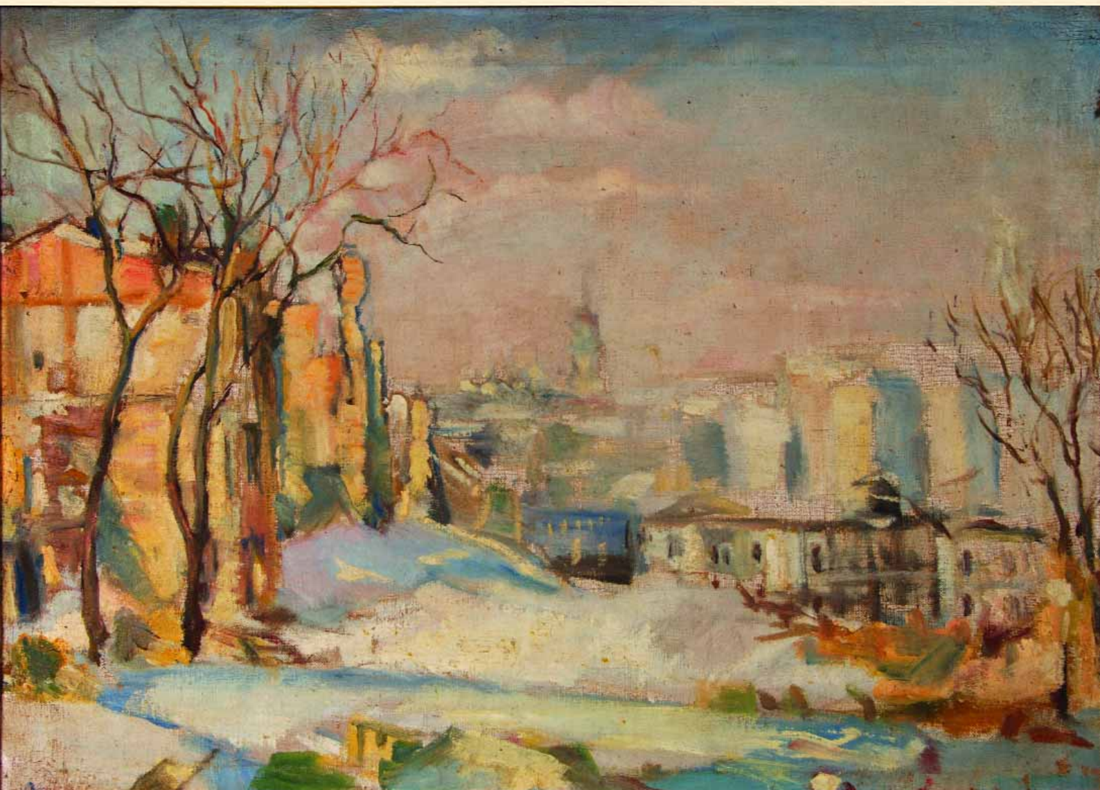
Зруйнований Київ в Інститутській вулиці. 1943 р. п., о., 63х71 см