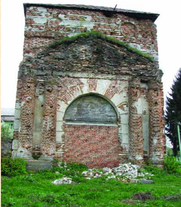
Дзвіниця Чолнського монастиря

поширеним на Україні плануванням — “хата на дві половини” — два приміщення, розділені сніями. Збереглося тільки одне склепінчасте приміщення. Спарені пілястри на фасаді дозволяють датувати пам’ятку першою половиною XVIII ст.