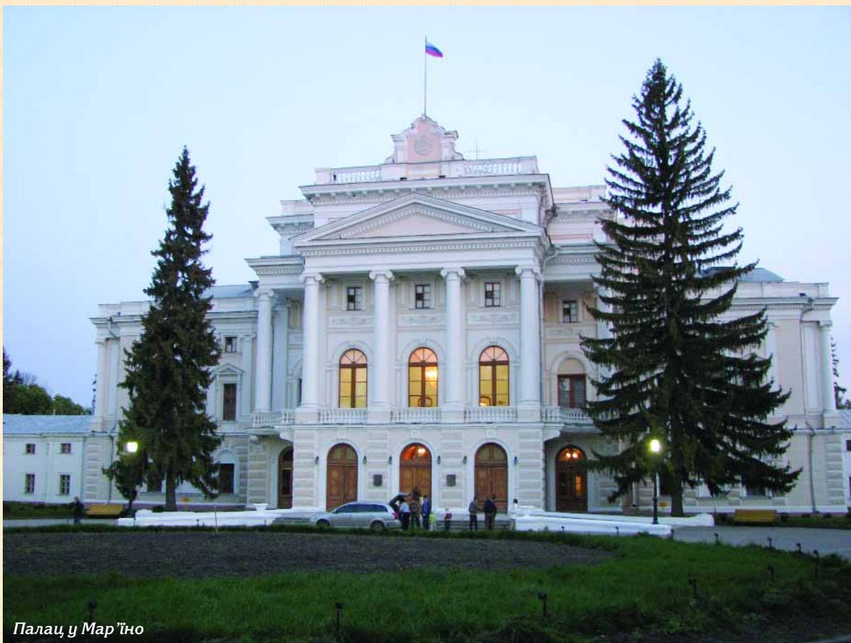
Палац у Мар'їно

таким чином зодчі намагалися розосередити навантаження і надати вежам більшої стійкості.