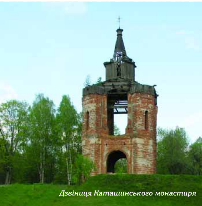
Дзвіниця Каташинського монастиря