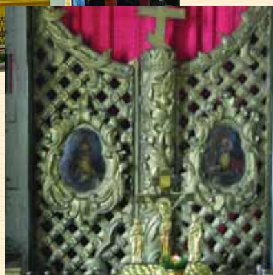
Царські врата Богоявленської церкви у Стародубі. Фрагмент

В Старому Ропську, в центрі села, стоїть дерев'яна церква Різдва Богородиці. Збудована у 1730 р. як тридільна триверха церква. Після перебудови у 1871 р. з доданням двох бічних ramen перетворилася на п'ятиверху хрещату.