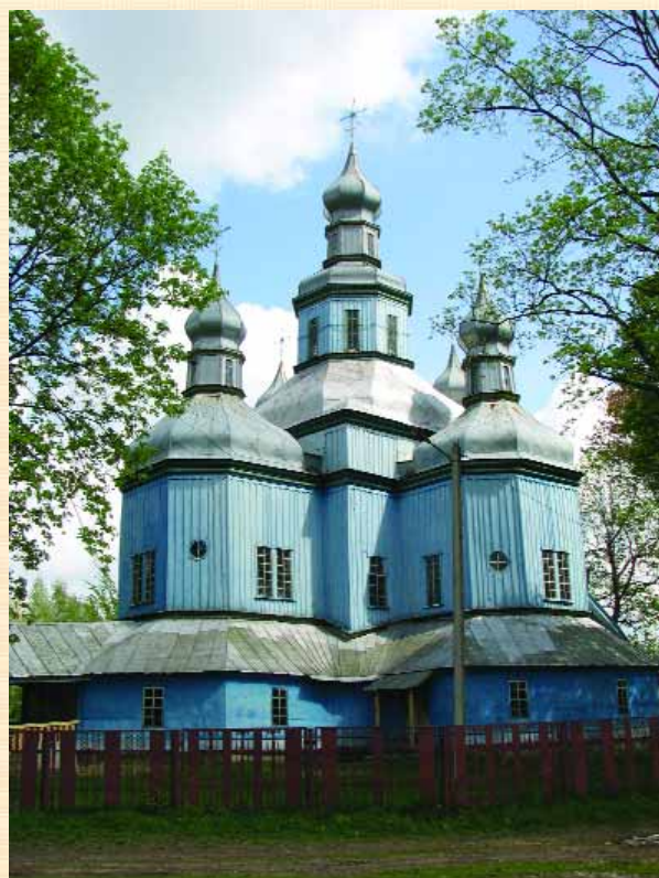
Миколаївська церква в Новому Ропську