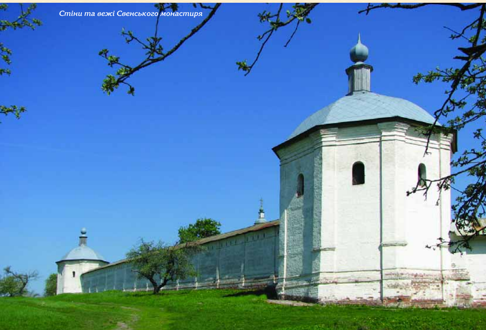
Стіни та вежі Свенського монастиря