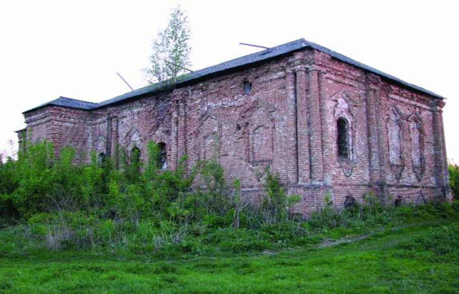
“Мазепині палати” в Іванівському

Огорожа із зубцями “у ластівчин хвіст” нагадує стіни Московського Кремля. Наріжні вежі восьмикутні, із шатровими завершеннями. Нижня частина має конусоподібну форму —