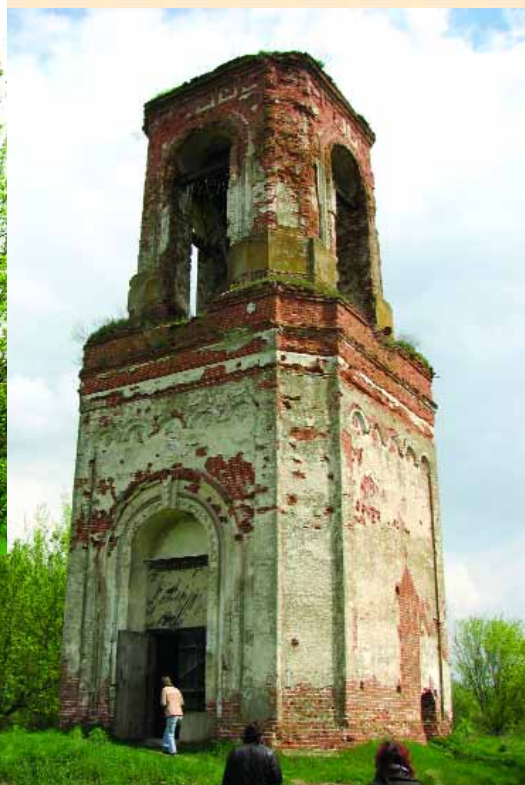
Дзвіниця Кам'янського монастиря

Дзвіниця за архітектурними формами може бути датованою другою половиною