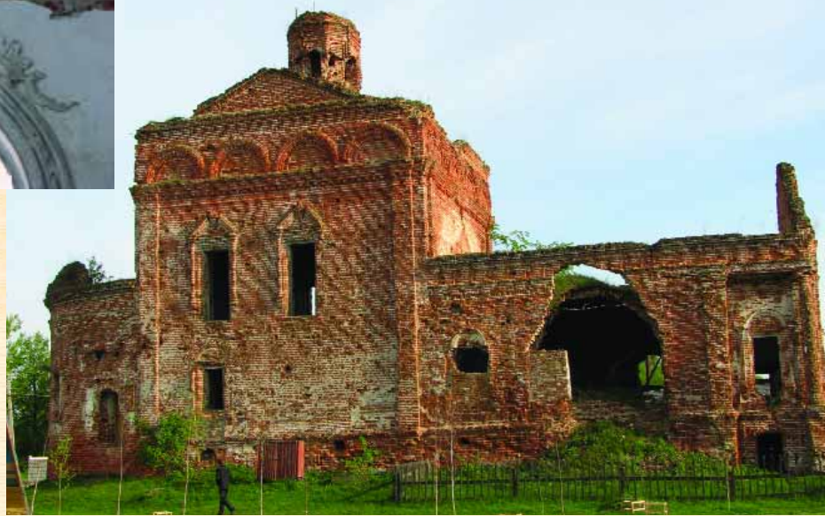
Собор Спасо-Преображенського монастиря. Північний фасад

тир. Одноійменний собор, зведений 1872 р., є тринавною двостовпною залогою без світлових барабанів. В бічних навах влаштовані монументальні галереї для хорів. У декорванні фасадів собору і розміщеної поруч дзвіниці відчувається вплив творчих методів Костянтина Тона.