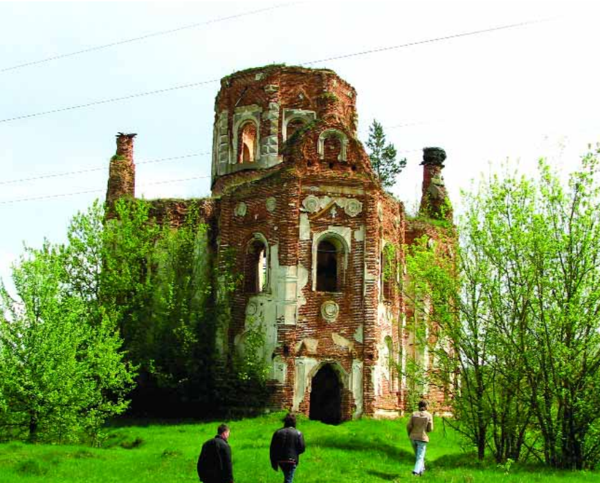
Успенський собор Кам'янського монастиря