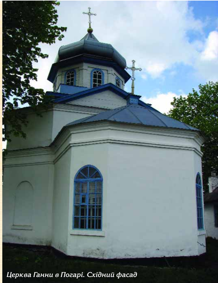
Церква Ганни в Погарі. Східний фасад

В центральній частині міста — ще одна цінна споруда — кам'яниця. Первісно вона являла собою мурований будинок з