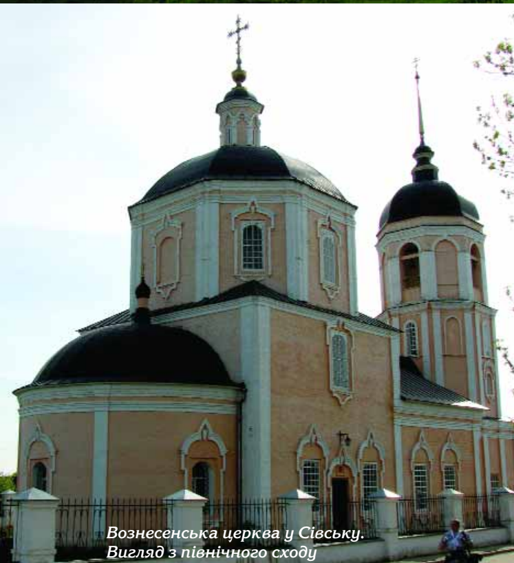
Вознесенська церква у Сівську. Вигляд з північного сходу