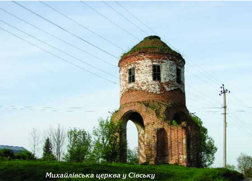
Михайлівська церква у Сівську