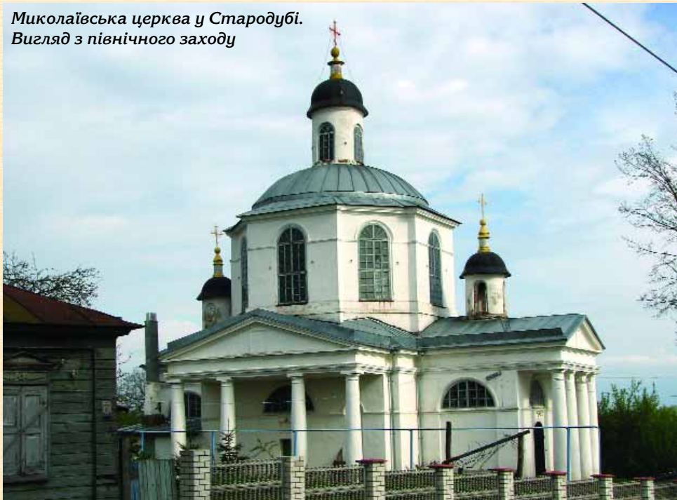
Миколаївська церква у Стародубі. Вигляд з північного заходу

На шляху до Климового варто оглянути муровану Покровську церкву в Соловій. Це хрещата в плані, однобанна споруда із