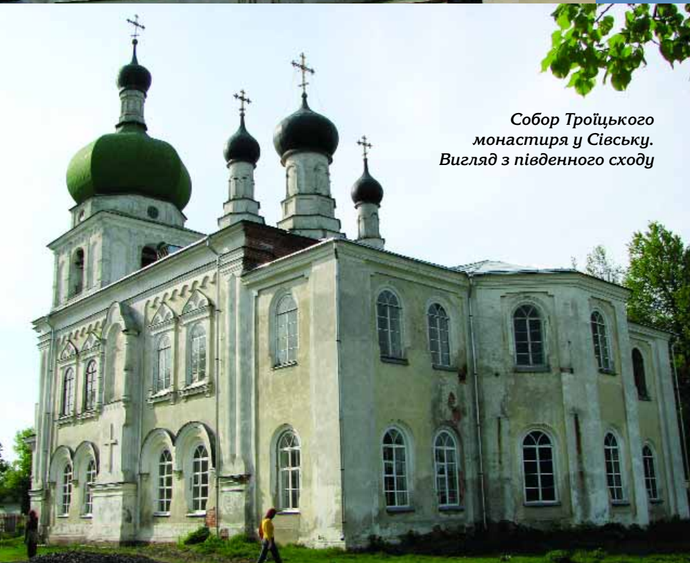
Собор Троїцького монастиря у Сівську. Вигляд з південного сходу