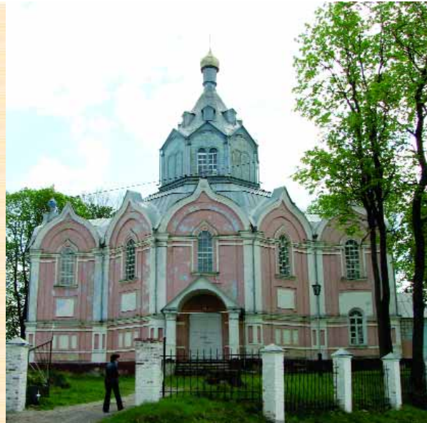
Покровська церква в Сачковичах. Північний фасад

Головний храм монастиря — хрещатий, п'ятидільний у плані, одноверхий. Нагадує собор Видубицького монастиря. Це й не дивно, адже родина Миклашевських, що будувала останній, мала, як вже згадувалося, неподалік свої маєтки. Під пізнім тиньковим декором фасадів середини XIX ст. проглядають наличники та портали другої половини XVIII ст. Цікавими є трьохчетвертні колонки, розміщені між раменами просторового хреста ззовні. Вони, можливо, увінчувалися окремими главками. Сильне враження справляє висотно розкритий інтер'єр собору.