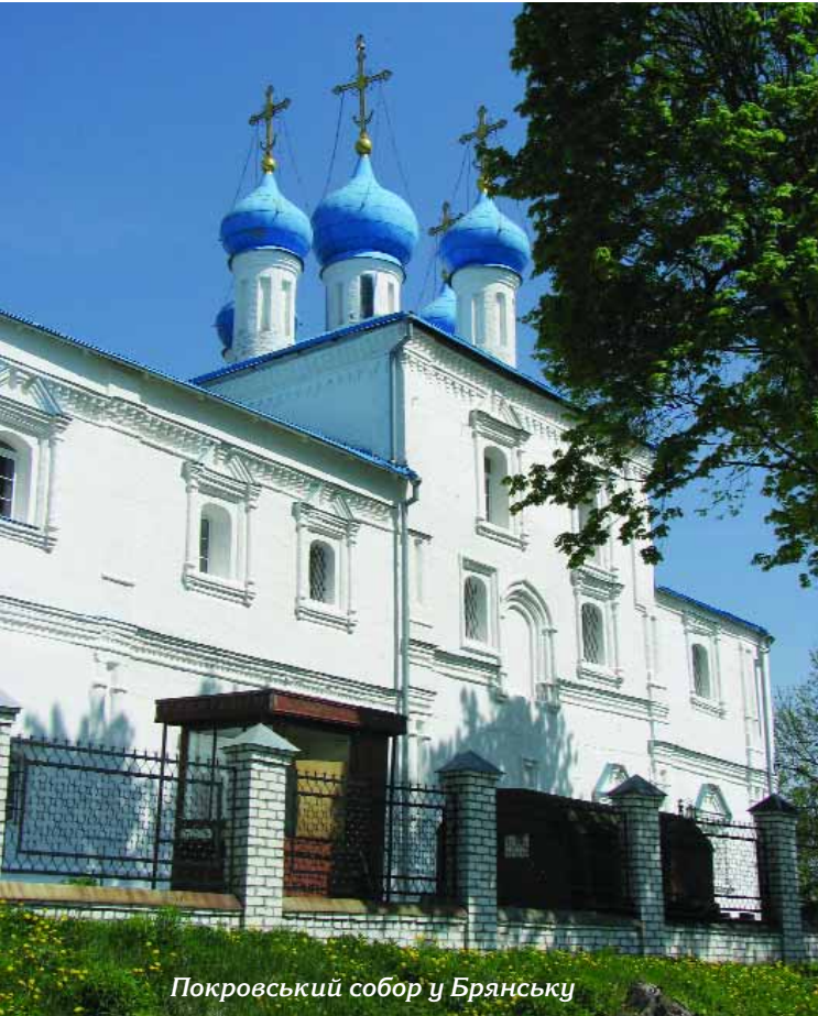
Покровський собор у Брянську

Собор — прекрасний зразок перехідного стилю від бароко до раннього класицизму з витонченими деталями та цікавою просторовою композицією на плані трилисника. Такий план, що походить з Афону, був відомий в Україні ще за часів Київської Русі і знову набув поширення у XVIII ст. у творчості таких провідних архітекторів, як І. Григорович-Барський.