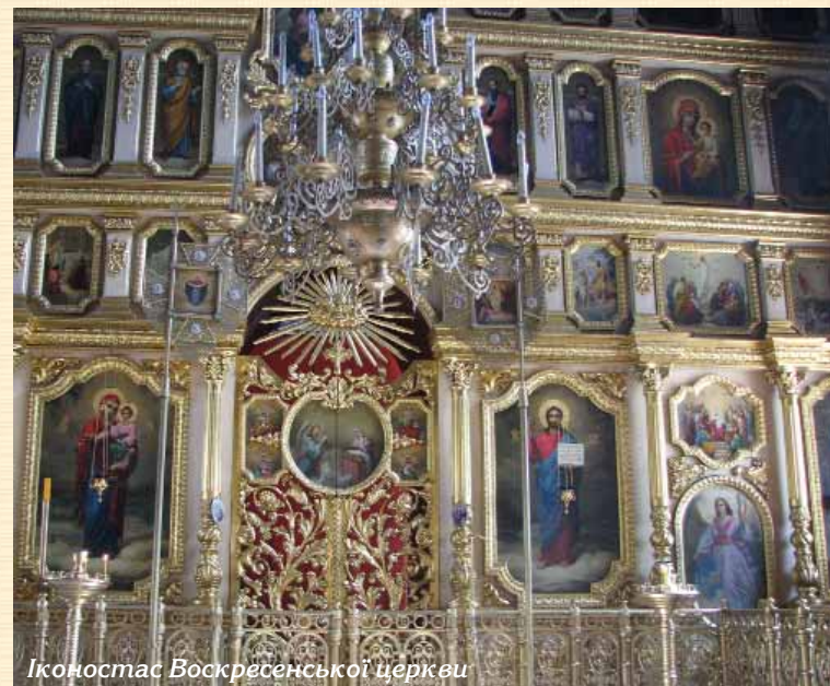
Іконостас Воскресенської церкви