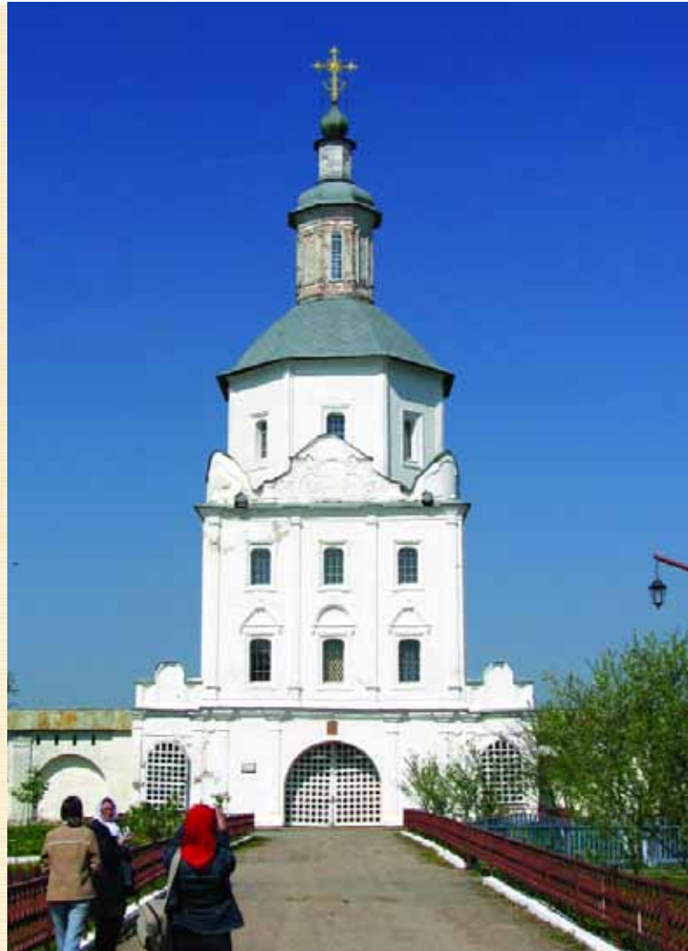
Спасо-Преображенська церква Свенського монастиря. Вигляд зі сходу