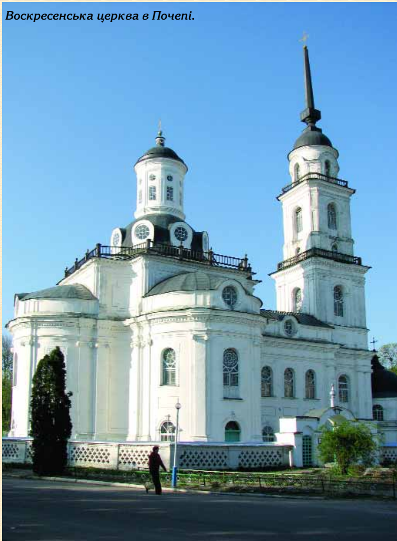
Воскресенська церква в Почепі.

Почеп відомий перш за все завдяки своєму храму Воскресіння Христового. Після того, як містечко стало власністю гетьмана Кирила Розумовського, тут розгорнулися значні будівельні роботи. Так, придворним архітектором Олексієм Яновським за проектом Валлена Деламота було збудовано палац (1765–1771 рр.), а за проектом Антоніо Рінальді — згаданий вже собор, з'єднаний з палацом переходом.