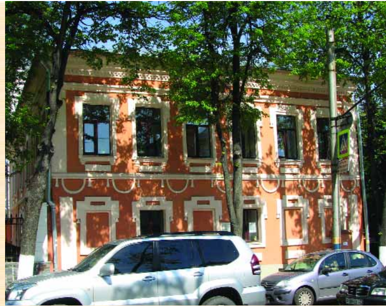
Фасад "Петровської митниці" у Брянську

Воскресенська церква будувалася в 1738–1741 рр. і є типовим зразком російської архітектури XVIII ст. Центральна частина з іконостасом (світловий восьмерик на