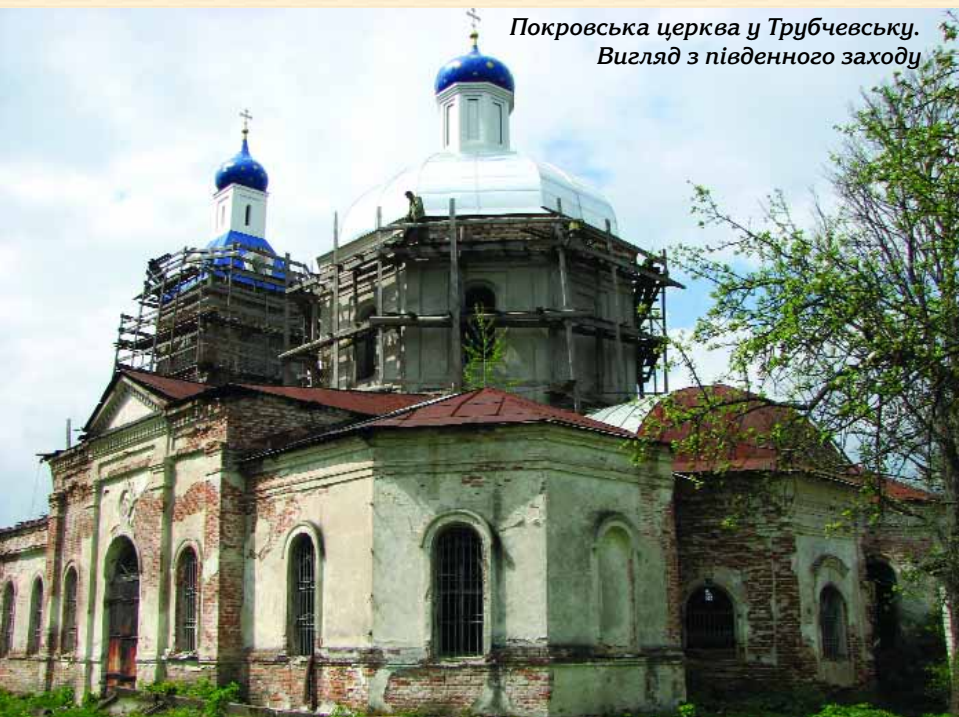
Покровська церква у Трубчевську. Вигляд з південного заходу

чверті XVII ст. “записним государевым мастером” Матвієм Єфимовим. Майстер, що так вдало поєднував у своїй творчості український тип тридільного триверхого храму з декоруванням фасадів у дусі російської архітектури кінця XVII ст., відомий також своїми роботами в Глухові та його передмістях. Оригінальною особливістю собору є вирішення східної частини основного восьмикутного об’єму — тут