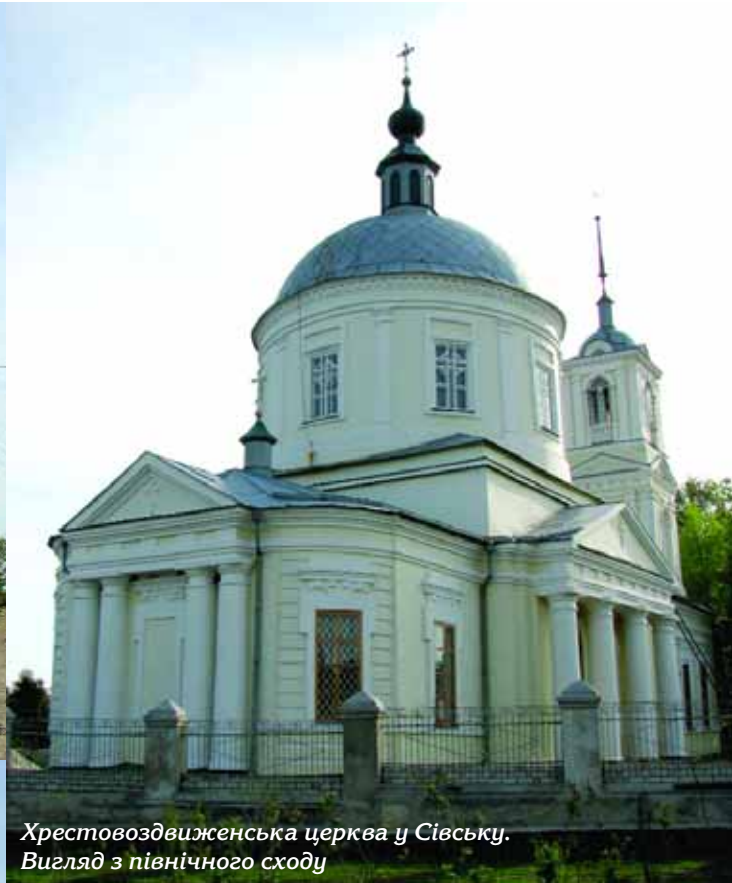
Хрестовоздвиженська церква у Сівську. Вигляд з північного сходу