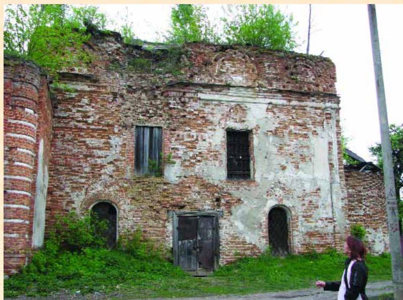
Спасо-Преображенська церква у Трубчевську. Південний фасад

Під Трубчевськом частково зберігся Чолнський монастир, відомий тим, що його монахи в середині XVII ст. не схотіли бути “під царем московським” і перейшли на територію Гетьманщини до Максаків коло Мени, де заснували однойменний монастир.