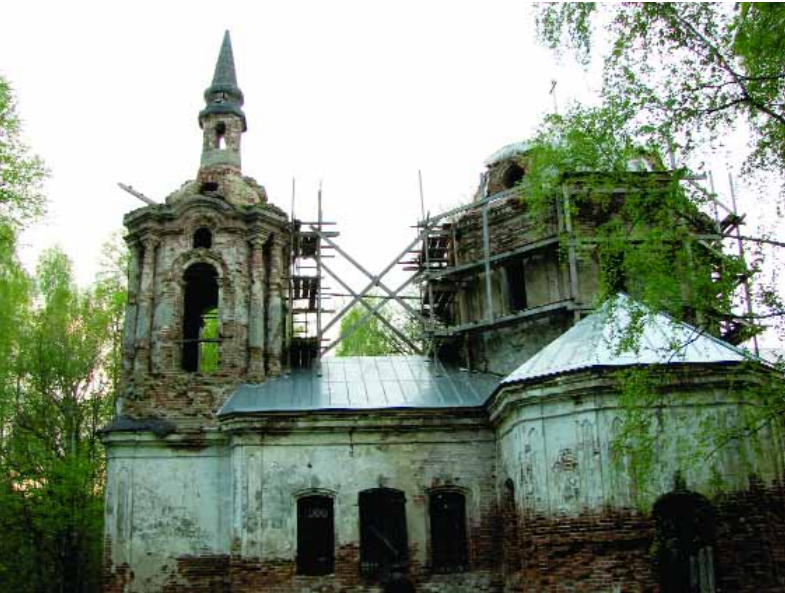
Покровська церква в Соловії. Фрагмент фасаду