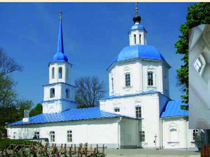
Тихвинська церква у Брянську

На під'їзді до Брянська на високому пагорбі розміщено Свенський монастир, заснований у XIII ст. монахами Києво-Печерської Лаври. У 1567 р. Іваном Грозним тут було закладено дві муровані церкви — собор та трапезну, проте невдовзі склепіння собору завалилися. 1681 р. монастир передано Києво-Печерській Лаврі, після чого він почав зватися Ново-Печерським. Обидві церкви на цей час перебували у напівзруйнованому стані. У 1690-х роках Лаврою збудовано надбрамну Стрітенську церкву. Її архітектура своєрідно поєднує українську об'ємну композицію із елементами російської архітектури — три абсиди, декоративні