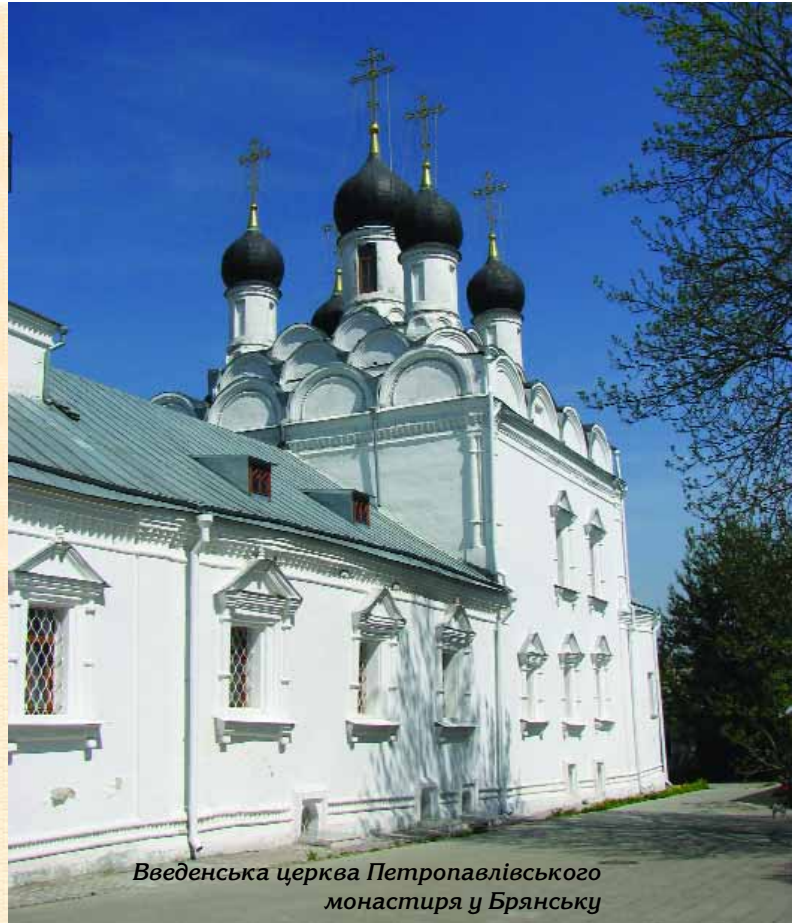
Введенська церква Петропавлівського монастиря у Брянську

По дорозі з Почепа на Брянськ знаходиться село Красний Ріг — батьківщина видатного поета Олексія Толстого, що був пов'язаний з Розумовськими родинними стосунками, адже його матір була донькою сина гетьмана — Олексія. До нашого часу збереглася дерев'яна первісно тридільна церква, збудована 1780 р. і розширена у XIX ст., біля якої поховано поета та його дружину. В селі є також меморіальна сади-