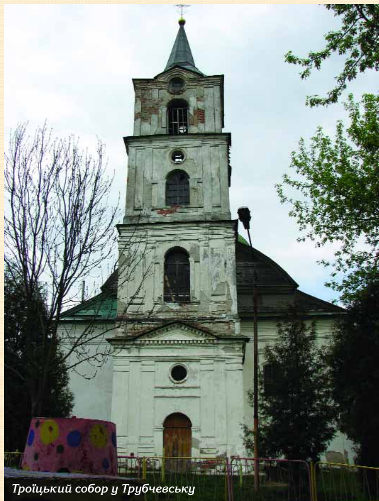
Троїцький собор у Трубчевську