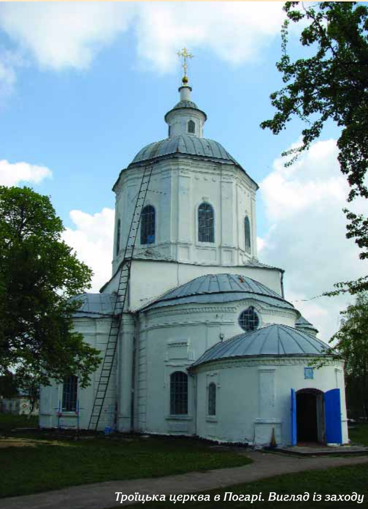
Троїцька церква в Погарі. Вигляд із заходу

В середині ХХ ст. відомий український історик архітектури Михайло Цапенко в серії “Дороги к прекрасному” видав книгу “Земля Брянская”. В цій публікації він уперше розглянув наявний в області історико-архітектурний матеріал, висунув свої пропозиції щодо датування пам’яток та їхнього значення для розвитку української архітектури. У травні 2008 р. група науковців Центру пам’яткознавства НАН України, архітекторів та істориків вирішила повторити цей маршрут. Метою поїздки було візуальне обстеження пам’яток архітектури Брянщини, збір матеріалу для наукових та дослідницьких робіт, формування теки аналогів для подальшого їх використання при реставрації об’єктів архітектурної спадщини України. Вибір саме Брянщини не є випадковим, адже впродовж кількох століть частина області, а саме Стародубщина, входила до складу Гетьманської України, сам Стародуб був центром однойменного полку, тому тут збереглося чимало пам’яток української архітектури. Багато з них, на жаль, ще й досі не введено до наукового обігу в Україні. Пропонована читачам стаття має на меті привернути ширші кола науковців та громадськості до пам’яток Брянщини, що дозволить розширити географічні межі історико-архітектурного пошуку.