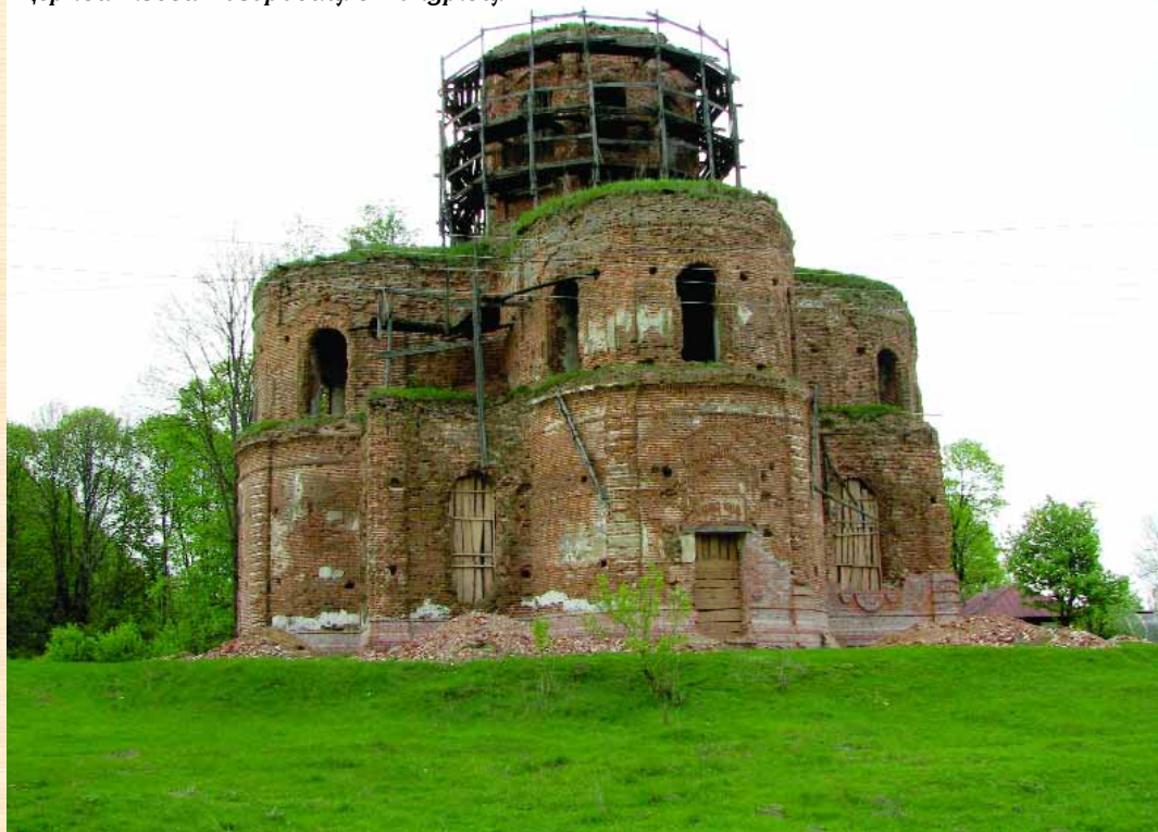
Церква Різдва Богородиці в Понуриці

Найбільший розквіт монастиря припадає на 1754–1782 рр. — час управління ігумена Іоасафа Миткевича, за якого почалось муроване будівництво. Саме тоді зведено Успенський собор (1776–1779 рр.), трапезну з церквою Іоанна Предтечі (1758 р.), муровані лікарняний корпус та огорожу. Існуюча нині дзвіниця зведена у 1860-х роках.