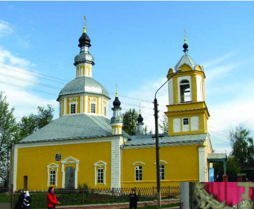
Богоявленська церква у Стародубі. Північний фасад.

дзвіницею на західному фасаді. Тут привертають увагу креповані карнизи та виразна пластика дзвіниці, франкованої наріжними колонками та увінчаної складного обрису шпилем.