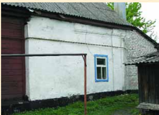
Кам'яниця у Трубчевську

поширеним на Україні плануванням — “хата на дві половини” — два приміщення, розділені сніями. Збереглося тільки одне склепінчасте приміщення. Спарені пілястри на фасаді дозволяють датувати пам’ятку першою половиною XVIII ст.