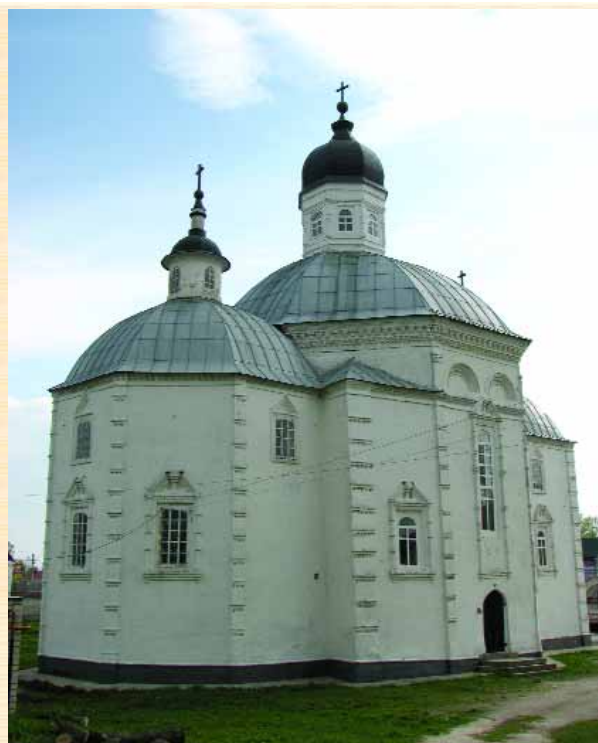
Полковий собор у Стародубі. Вигляд з північного сходу

З цивільної архітектури у Стародубі привертають увагу дерев'яні неокласицистичні особняки, що можуть бути датованими початком XX ст.