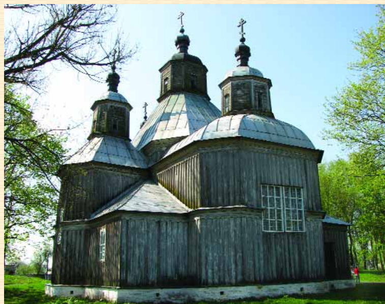
Церква Різдва Богородиці в Старому Ропську. Вигляд з південного сходу

Між Новозибковом та Клинцями, в селі Каташин, знаходився колись відомий Каташинський монастир. Зараз від нього збереглися лише дзвіниця та нижні частини стін собору.