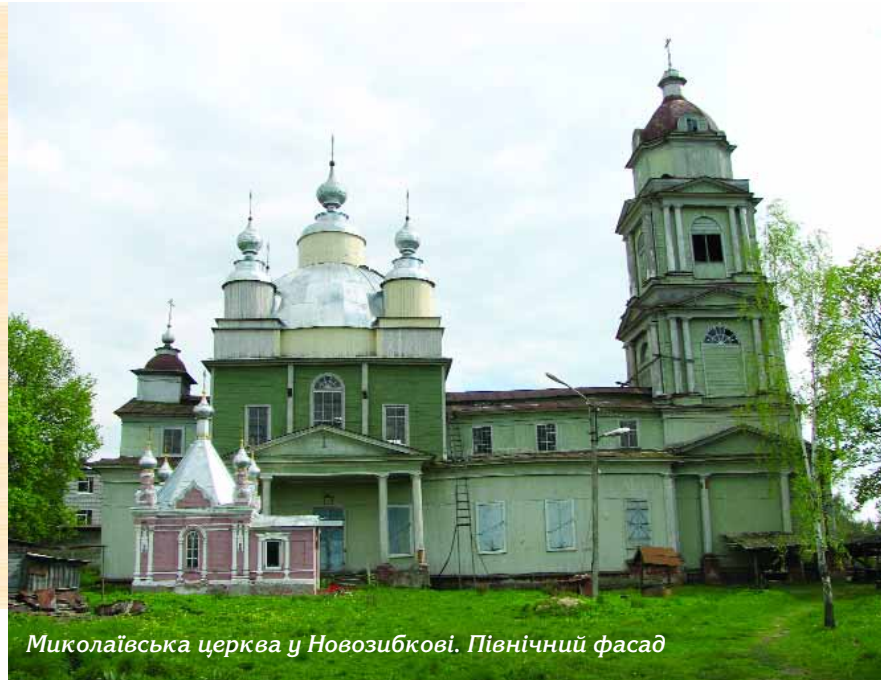
Миколаївська церква у Новозибкові. Північний фасад