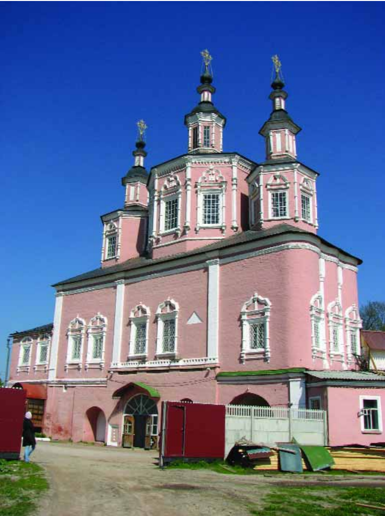
Стрітенська церква Свенського монастиря. Вигляд з південного сходу