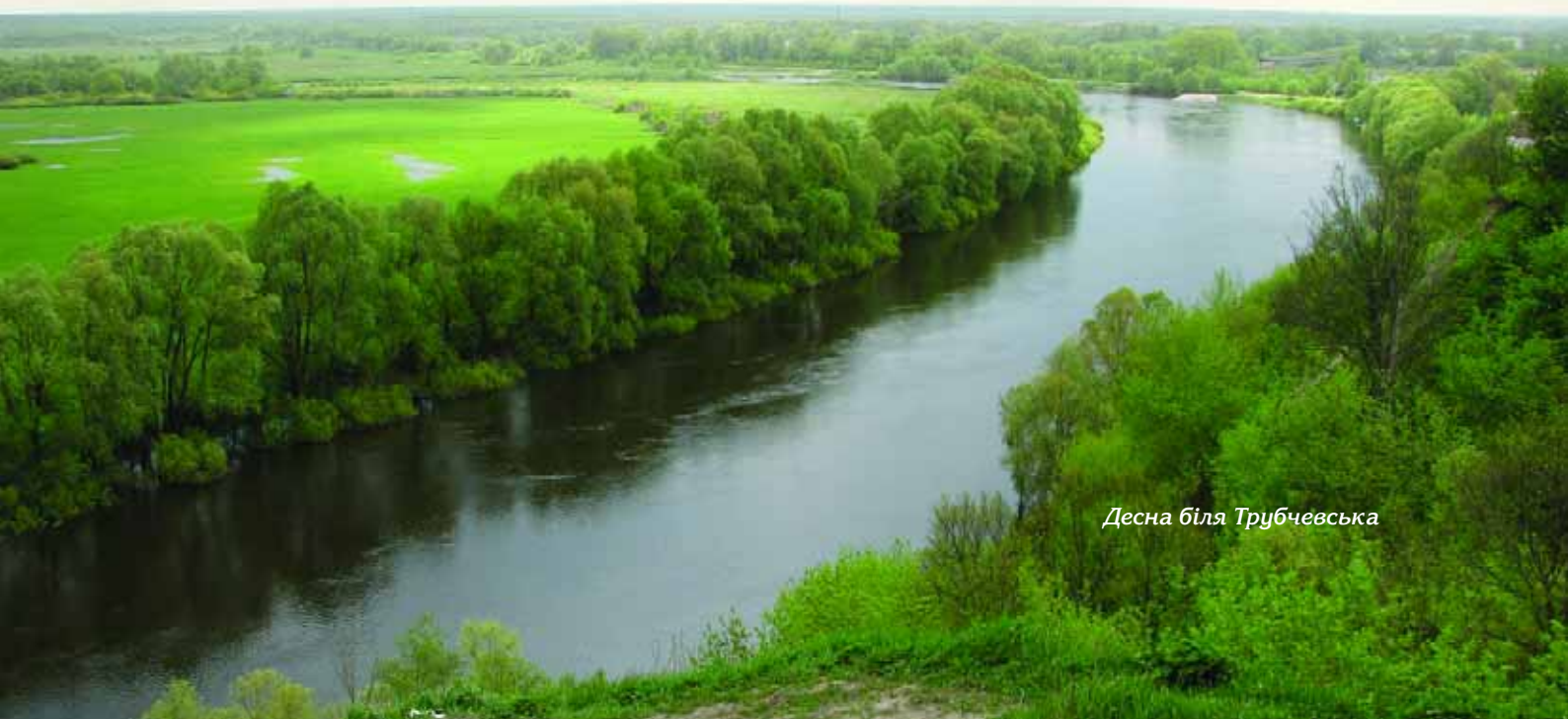
Десна біля Трубчевська