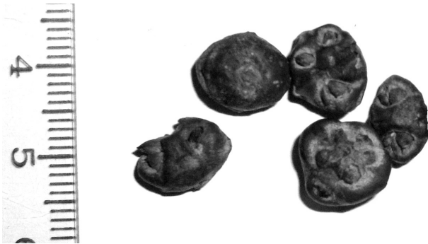
Рис. 3. Шишкоягоди J. chinensis із пошкодженим насінням