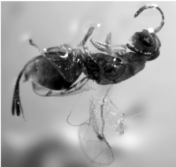
Рис. 4. Шкідник ялівців роду Megastigmus