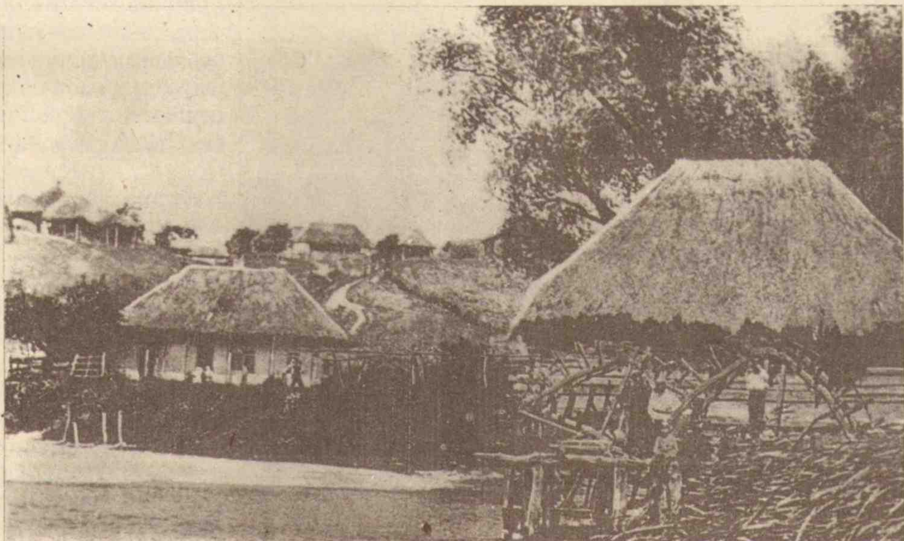
Вигляд одного із сіл Харківської губернії. Початок ХХ ст.