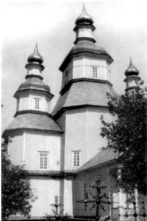
Троїцька церква у Пустовійтівці. 1773 р.

Книга Федора Ніколайчика «Місто Кременчук. Історичний нарис» (1891 р.).