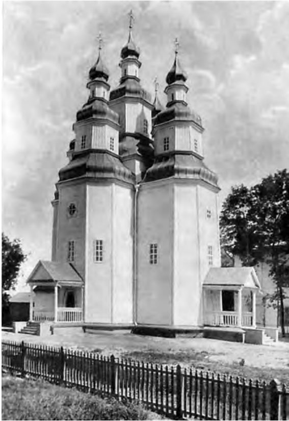
Роменська Покровська церква, збудована 1764-1770 рр. коштом П. Калнишевського.