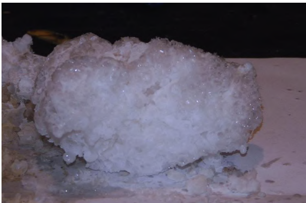
Рисунок 2 – Штучний метаногідрат, отриманий в лабораторії інноваційних технологій ДВНЗ «НГУ»

В процесі досліджень було виявлено декілька способів прискорення процесу гідратування [9, 10]. Для максимально швидкого гідратування та безпосереднього спостереження процесу і своєчасного зняття показників кристалізації, було сконструйовано додаткові модулі. Такий підхід надав можливість глибокого розуміння кінетики гідратування та можливість обробки показників, з метою встановлення закономірностей.