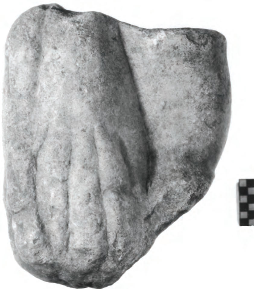
Рис. 3: Фрагмент руки и лапы от шкуры льва. Мрамор.