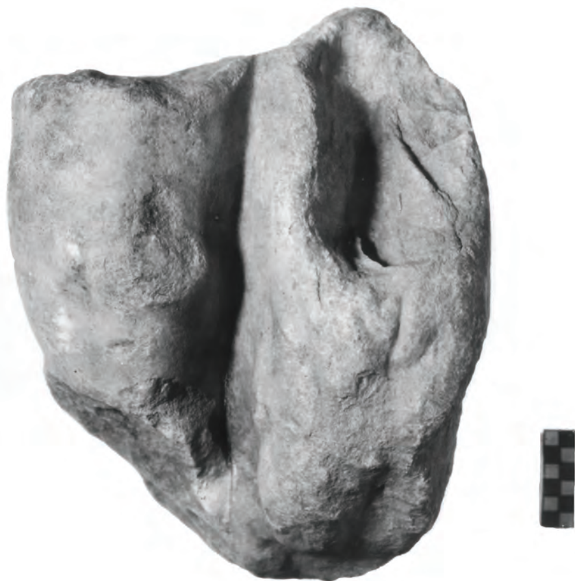
Рис. 1: Нижняя часть ноги с остатком шкуры льва. Мрамор