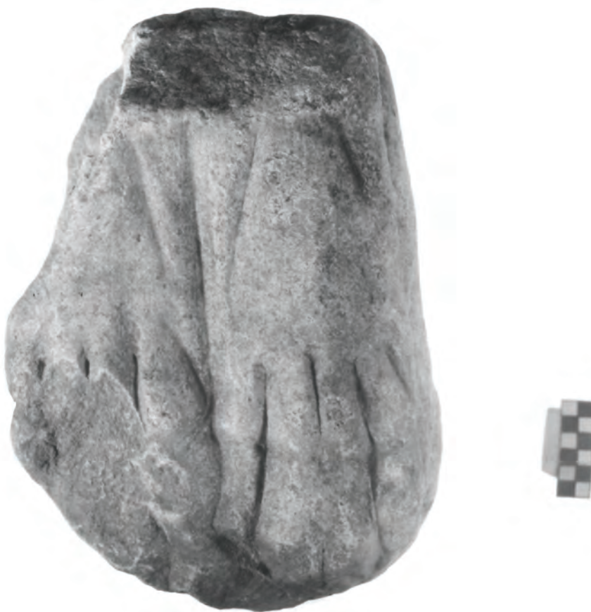
Рис. 2: Часть шкуры с двумя лапами льва Мрамор.