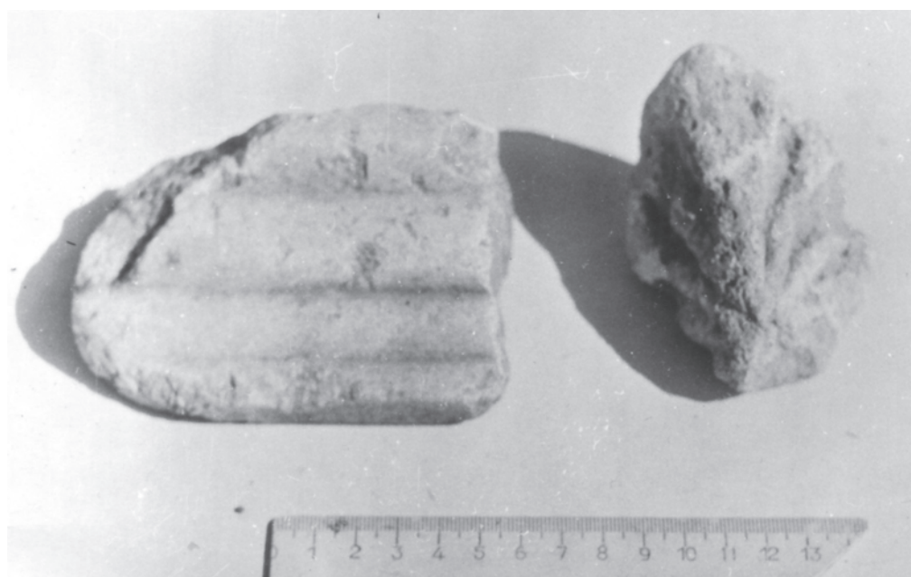
Рис. 4: Часть львиной шкуры и акротерий. Мрамор.