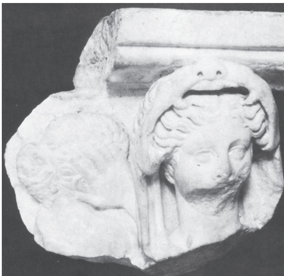
Рис 6: Голова Геракла на саркофаге. Род Айленд, США.