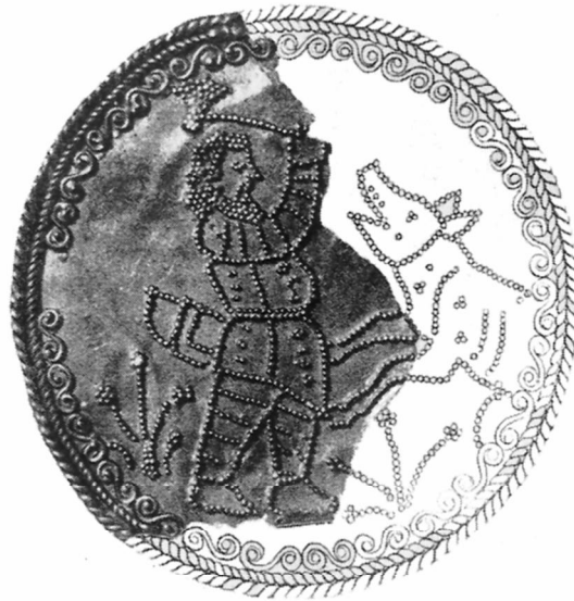
Рис. 3. Реконструкция пластинки, выполненная В.А. Ватагиным (по: Greifenhagen A. Fragmente eines skythischen Goldbleches aus Chersones in Berlin und Moskau // Archaologischer Anzeiger 1974. S. 173. Abb. 1).