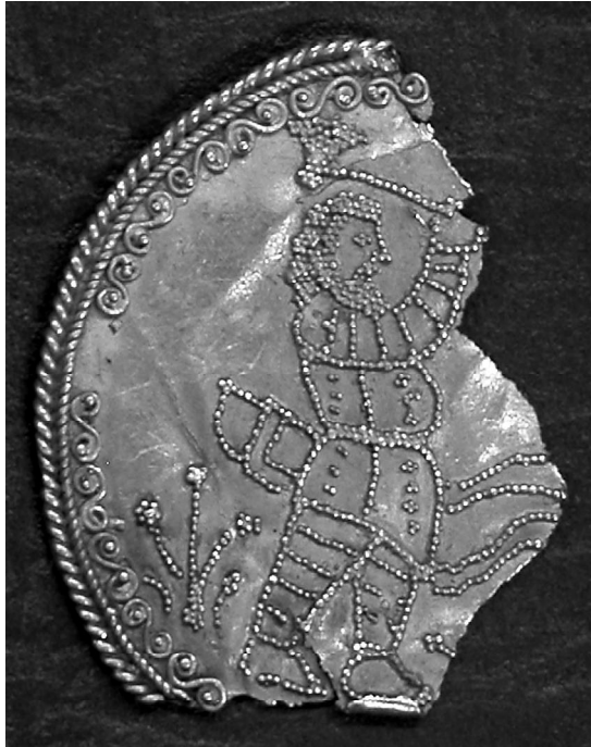
Рис. 1. Фрагмент пластинки с изображением скифа. Лицевая сторона. ГИМ.