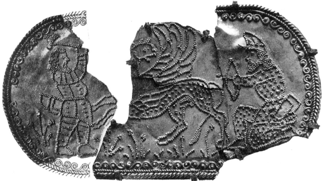
Рис. 5. Совмещенное изображение «московского» и «берлинского» фрагментов пластинки с изображением двух скифов и грифона (по: Greifenhagen A. Fragmente eines skythischen Goldbleches aus Chersones in Berlin und Moskau // Archaeologischer Anzeiger 1974. S. 173. Abb. 3).