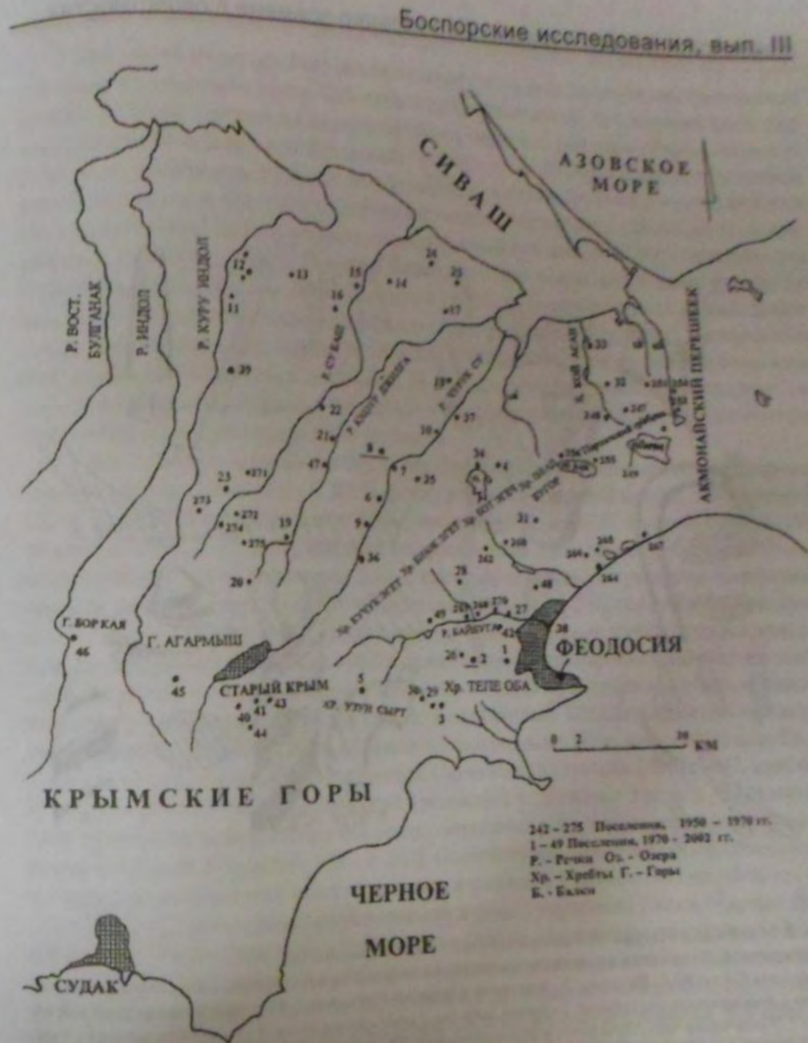
Рис. 1. Карта-схема памятников античной эпохи в Юго-Восточном Крыму. 2 - Куру Баш; 3 - Бинок Янышар; 5 - Сары Кая; 40 - Алан Тепе I; 43 - Карасан Оба; 44 - Мачук; 45 - Яман Таш; 46 - Бор Кая.

Укрепление располагается на скалистой, густо поросшей лесом вершине горы, которая с северной стороны имеет обрыв высотой ок. 7-10 м. С запада, востока и юга, где склон относительно пологий, вершина была перегорожена стенами длиной: западная - 43 м, восточная - 30 м, южная - 43 м. Стены укрепления представляют собой развалы бутовых известняковых камней высотой до 2,0 м и вместе с северным обрывом образуют замкнутое пространство. Вход в укрепление находился, очевидно, с западной стороны в месте примыкания стены южному обрыву. Здесь же в скалистых обрывах есть относительно удобный проход и спуск в глубокую поросшую лесом долину Османов Яр, устье которой выходит к современному водохранилищу и бывшему греческому селению Армутлук. Поселение примыкало к укреплению и располагалось под северными обрывами вершины на относительно пологом северном склоне горы, который местами террасирован.