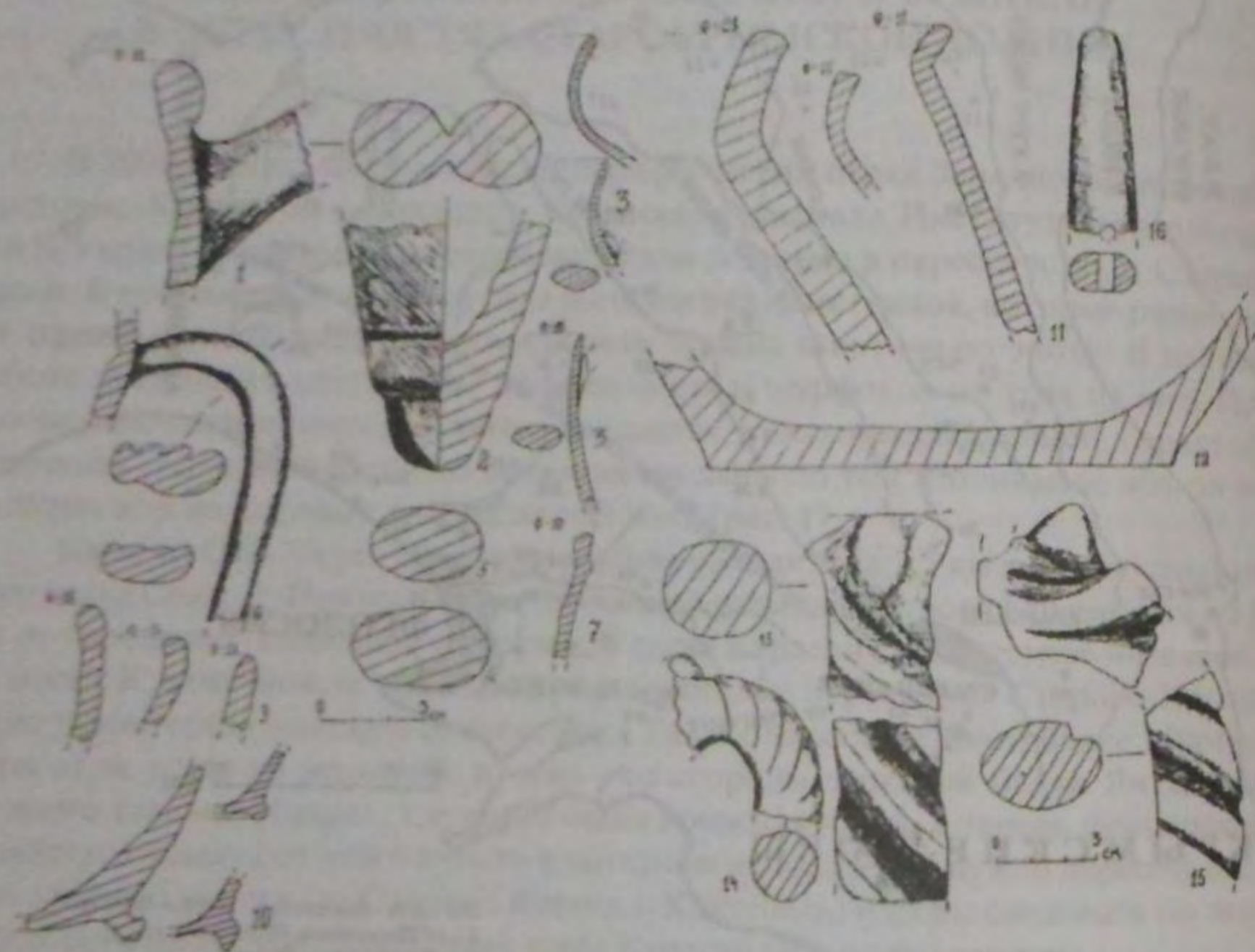
Рис. 2. Материал из шурфа № 1 на селище укрепления Карасан Оба. Фрагменты: 1, 2 - венчика и ножки светлоглиняной широкогорлой амфоры с двустольными ручками типа С I по Ю.С. Внукову; 3 - венчиков кувшинов гончарных; 4 - ручки красноглиняной амфоры с воронковидным горлом; 5 - ручки амфоры с коническим дном; 6 - ручек кувшинов гончарных; 7, 9 - венчиков чаш гончарных и краснолаковых; 10 - придонных частей кувшинов гончарных; 11 - венчиков корчаги и горшков лепных; 12 - придонной части корчаги лепной; 13-15 - ручек лепных в виде витой веревки с шишечковидными налепами в верхней части; 16 - оселка.

На одной из террас был заложен шурф размером 2x2 м, ориентированный бортами по сторонам света. Его стратиграфия показала, что верхний слой толщиной 18-21 см состоит из задернованного, черного, рыхлого гумуса, не содержащего большого количества бутовых известняковых камней средних и маленьких размеров (завал стен построек). Еще ниже залегала прослойка светло-желтой глинообмазка стен или кровли. Под ней находился слой чернозема с включением бутовых известняковых камней толщиной 10 см. Очевидно, это основная часть археологического материала. Ниже этого слоя залегала материковая глина. Таким образом, общая мощность культурного слоя от уровня современной дневной поверхности составила 78 см. Дно шурфа ровное с небольшим уклоном в северном направлении, почти в его центре находились остатки кострища в виде скопления древесных угольков.