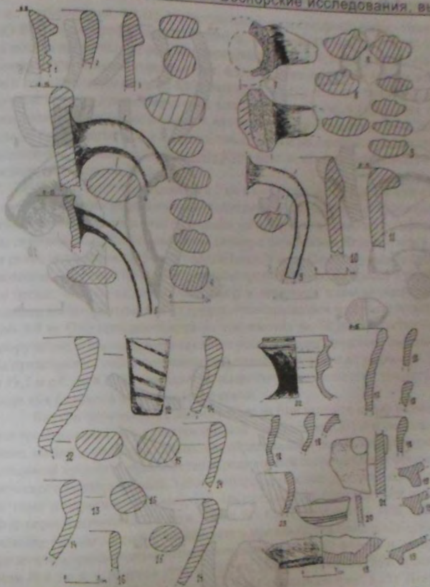
Рис. 3. Подъемный материал из поселения Алан Тепе. Разрезы: 1 - венчика желобчатого красноглиняной широкогорлой амфоры; 2 - венчика красноглиняной амфоры с воронковидным горлом; 3 - венчика т.н. мирмекийской амфоры; 4 - венчика с ручкой розовоглиняной широкогорлой амфоры; 5 - венчика с ручкой колхидской амфоры; 6 - ручек амфор. Материал из шурфа № 1. Разрезы: 7, 8 - горла и ручек светлоглиняных узкогорлых амфор типа Д по Д.Б. Шелову; 9 - ручек профилированных т.н. мирмекийских амфор; 10 - венчика красноглиняной широкогорлой амфоры; 11 - венчика клювовидного т.н. мирмекийской амфоры; 12-15 - венчиков, ручек, ножек красноглиняных амфор с воронковидным горлом; 16 - венчика светлоглиняной амфоры; 17, 18 - венчиков кувшинов; 19 - поддонов кувшинов; 20, 21 - стенок горшков; 22 - горла кувшина; 23 - венчика миски.

Находки из шурфа представлены фрагментами амфор второй четверти II - первой половины III вв. н. э.: светлоглиняных узкогорлых амфор типа С по Д.Б. Шелову (рис. 3,7,8); красноглиняных с воронковидным горлом (рис. 3,12-15); широкогорлых розовоглиняных (рис. 3,10); мирмекийского и фанагорийского типов с плоским дном и ручками, профилированными четырьмя или пятью валиками это-