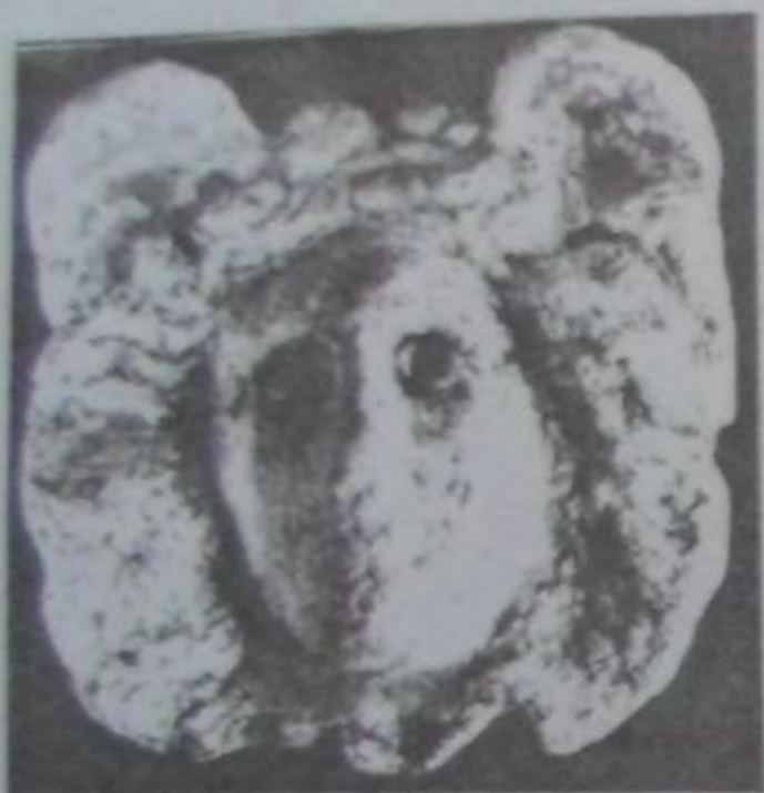
Рис. 11. Маска Медузы Горгоны.