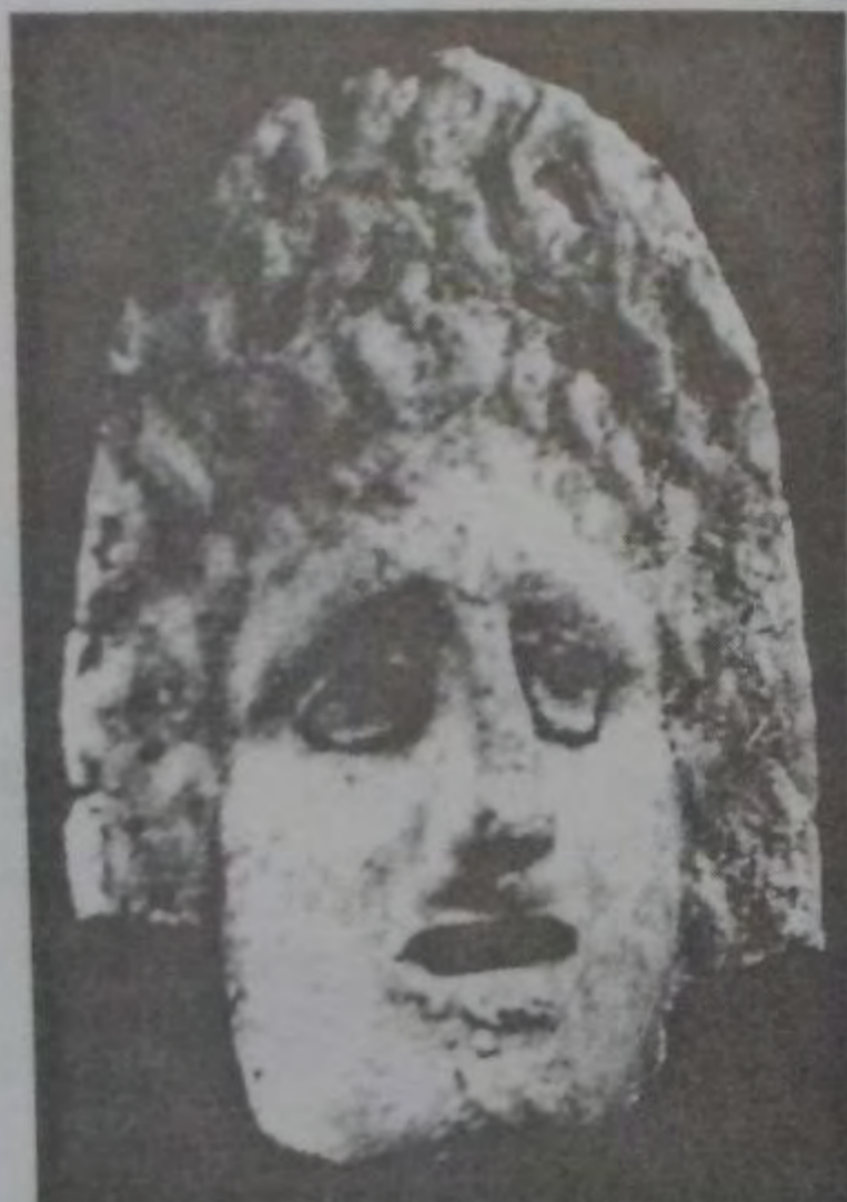
Рис. 13. Трагическая маска.