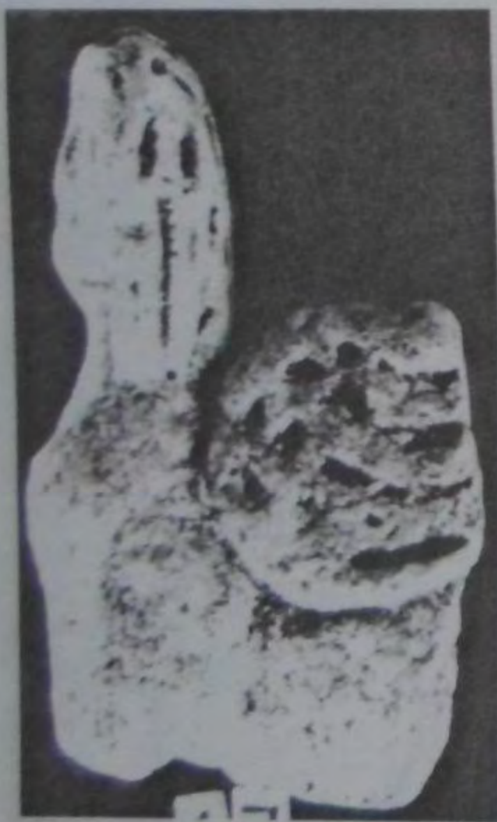
Рис. 12. Сфинкс