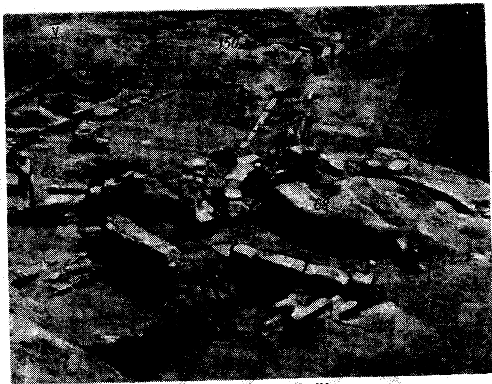
Рис. 3. Строительные остатки II—IV вв. н. э.

V — помещение вексиляции I Италийского легиона; 37 — юго-западная куртина; 68 — круглая башня; 212 — западная куртина; 88 — «последготский» дом; 111 — помещение второй половины III в. н. э.; 150 — подвал с лестницей на куртине 37.