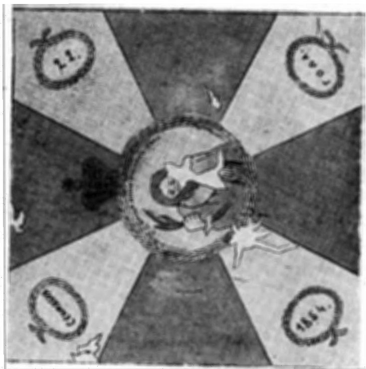
Рис. 2. Мемориальное знамя в честь обороны Очакова.

Нет сомнений, что трофейные весла с англо-французских кораблей, снятые во время обороны Очакова в 1854 г., служили позже древками к мемориальным знаменам, учрежденным в память героической обороны города. В дальнейшем они хранились в Одесском соборе, откуда поступили в Одесский археологический музей. В настоящее время два знамени (№№ 3—4) хранятся в Киевском государственном историческом музее, а остальные два знамени и оба весла — в Одесском государственном историко-краеведческом музее.