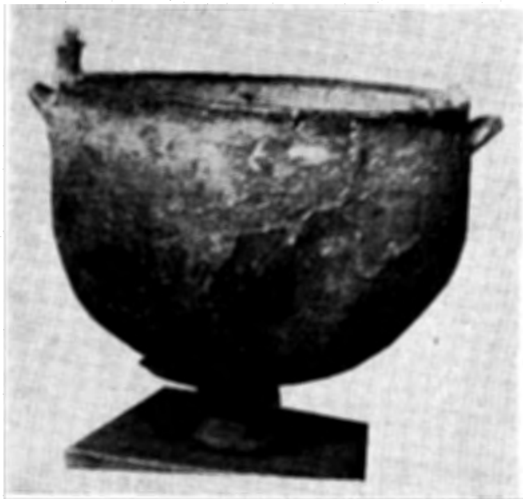
Рис. 1. Литой бронзовый котел из кургана у с. Мартоноша.

Отличие котла из Мартоношского кургана от указанных котлов из ранних скифских курганов состоит в том, что у него, кроме утраченных в настоящее время декоративных фигурных ручек, сохранились пара вертикальных и пара горизонтально рас-