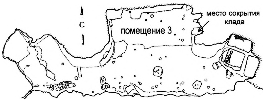
Рис. 2. План пещерного комплекса.