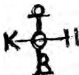
а) Монограмма V типа (по В.Лорану)