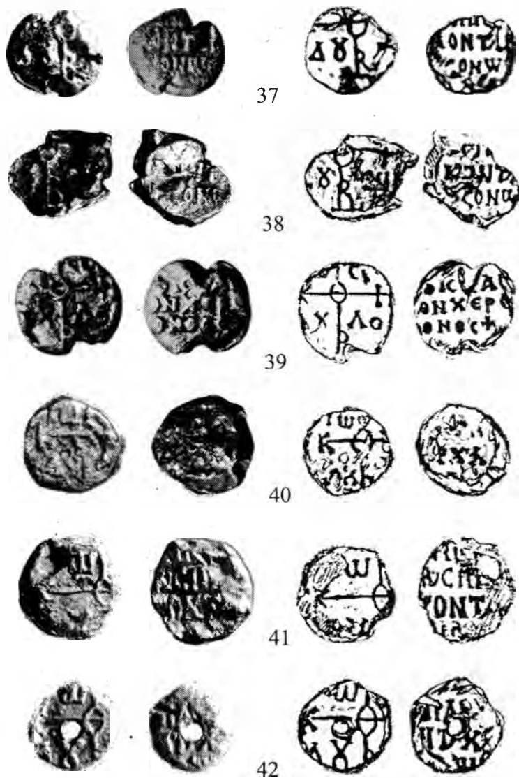
Рис. 7. Печати архонтов Херсона. 37-42 – императорского спафария ...