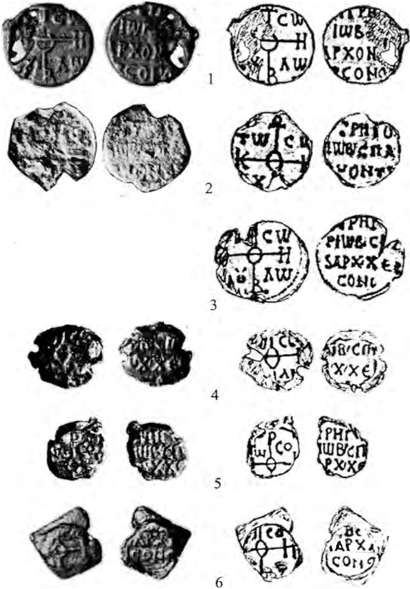
Рис. 1. Печати архонтов Херсона. 1-6 – императорского спафария Григория.