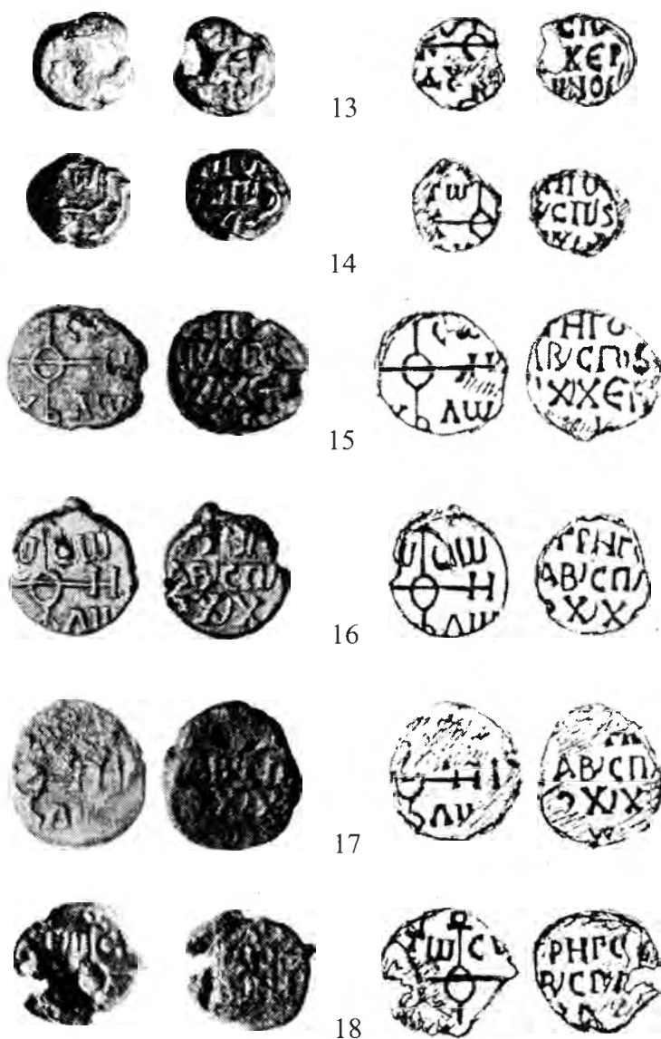
Рис. 3. Печати архонтов Херсона. 13-18 – императорского спафария Григоры.