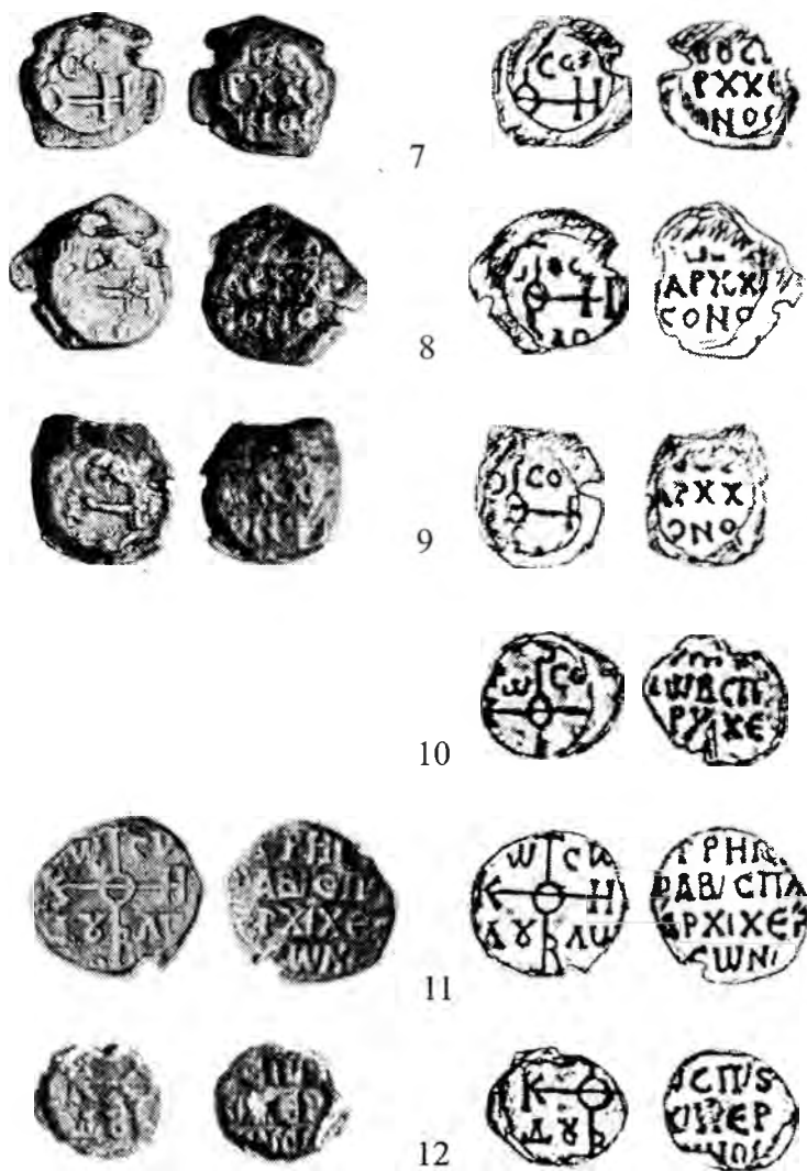
Рис. 2. Печати архонтов Херсона. 7-10 – императорского спафария Григория; 11-12 - императорского спафария Григоры.