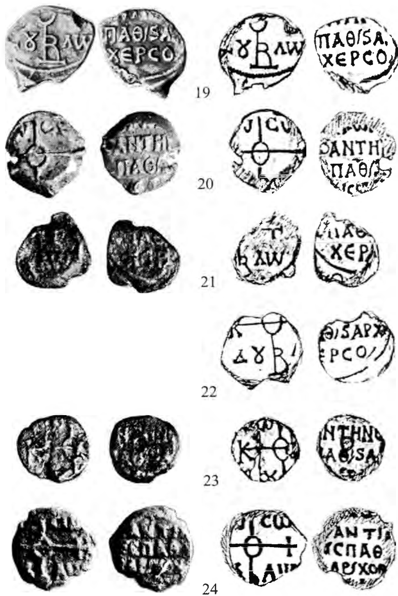
Рис.4. Печати архонтов Херсона. 19-24 – императорского спафария Константина.