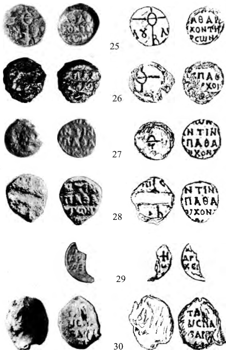
Рис. 5. Печати архонтов Херсона. 25-30 – императорского спафария Константина.