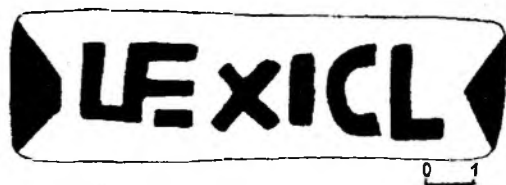
Рис. 3. Клеймо LE XI CL.

Клеймо VEMI, таким образом, снова представляет нам штамп вексилляции римских войск, однако уже в иной форме написания. Отсутствие упоминания в клейме конкретного подразделения указывает на смешанный характер гарнизона. Под термином exercitus мы должны подразумевать части двух или трех легионов и вспомогательных войск, в противоположность клейму VEX LE V. Единовременные с клеймом VEMI клейма LE XI CL могут служить подтверждением этого, так как