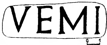
Рис. 2. Клеймо VEMI

Судя по одновременности бытования клейм VEMI и LE XI CL, они должны отражать состав римского гарнизона на протяжении единого отрезка времени. Наиболее спорной до недавнего времени была расшифровка аббревиатуры VEMI (22, с. 56). Недавно Т.Сарновским и В.М.Зубарем было предложено прочтение V(exillatio) E(xercitus) M(oesiae) I(nferioris) – вексилляций войск Нижней Мёзии (23, S. 234). Такое прочтение находит аналогии в клеймах, поставленных от имени отдельных вексилляций, выведенных какой-либо провинцией (CIL III 3748; 8749), и не противоречит правилам сокращений в надписях. Оно должно быть принято, как весьма вероятное (24, с. 62-63).