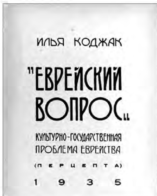
Рис. 7. Титульный лист книги И. Б. Коджака «Еврейский вопрос. Культурно-государственная проблема еврейства (перцепта)» (1935 г.).