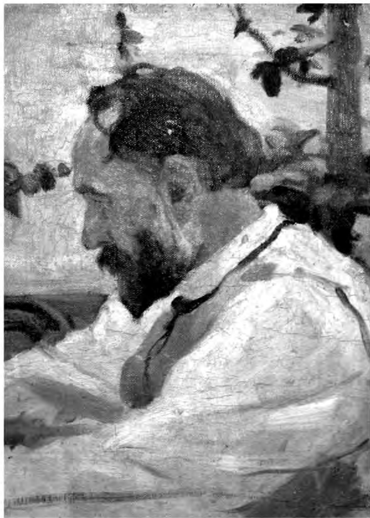
Рис. 6. М. М. Казас. Портрет отца. Холст, масло. 1909 г. Фонды Симферопольского художественного музея.