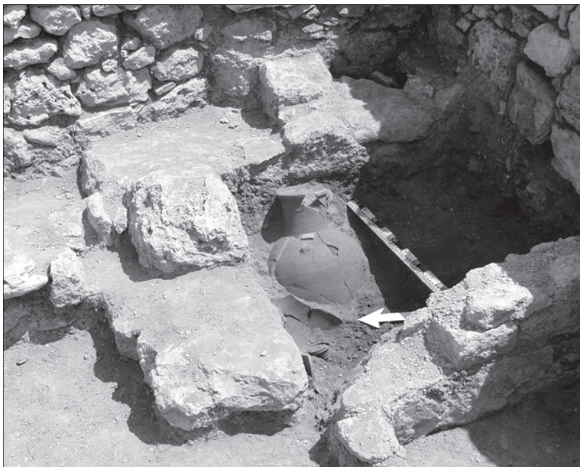
Рис. 5. Кладовая с амфорами.