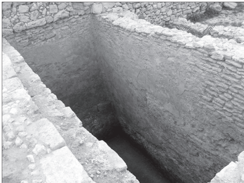
Рис. 3. Цистерна № 5.