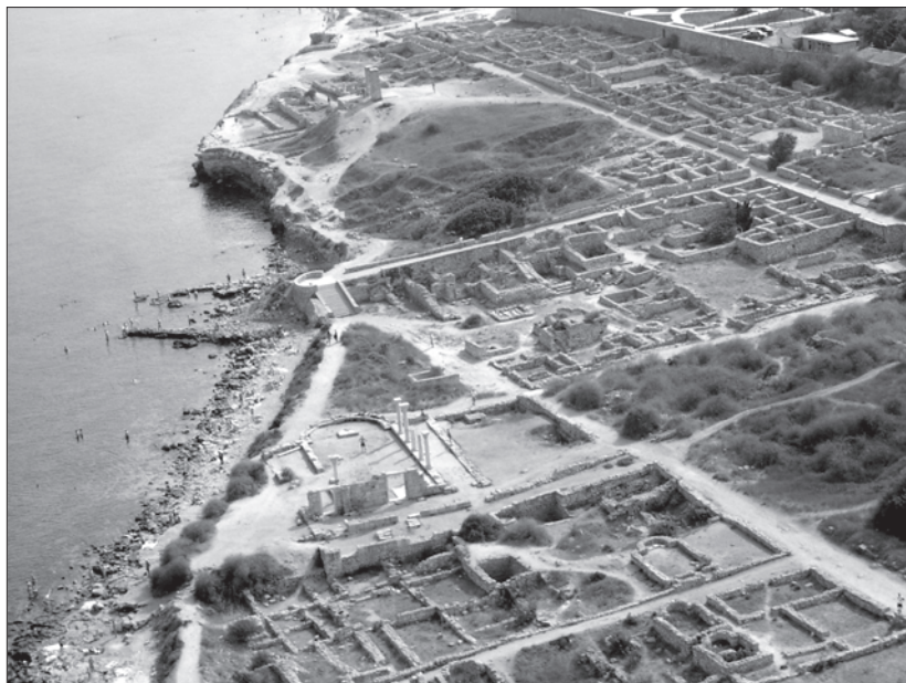
Рис. 1. Общий вид Северного района.