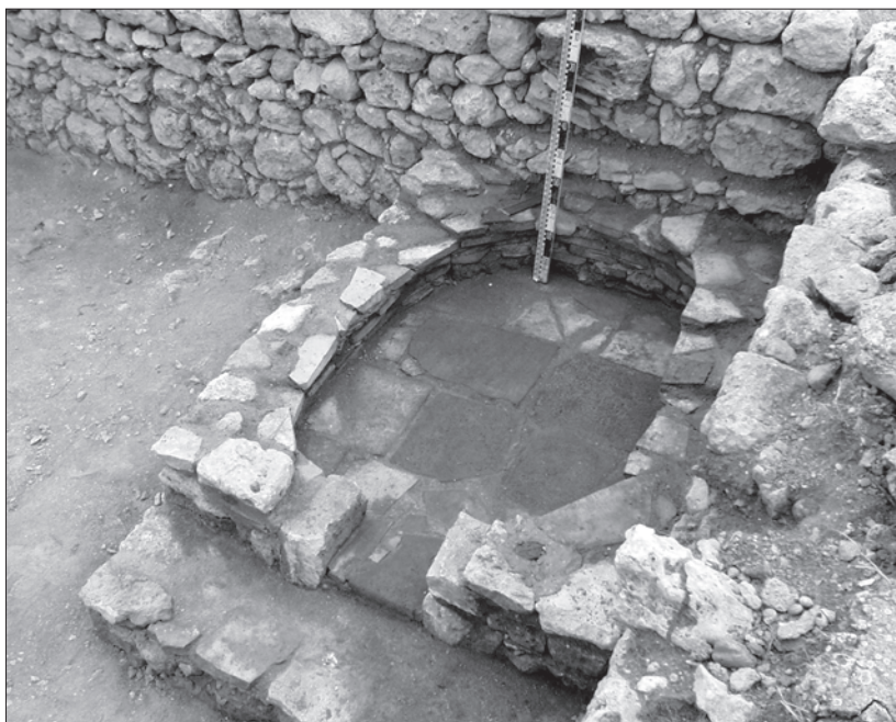
Рис. 6. Печь во дворе средневекового дома.