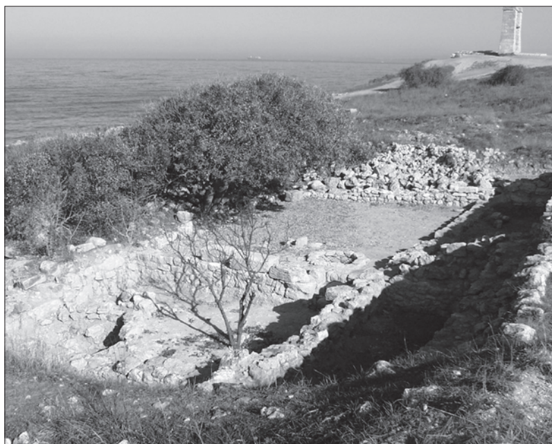
Рис. 4. Двор и полуподвальное помещение античного дома.