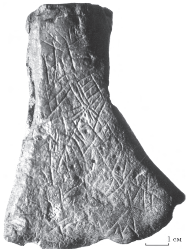
Рис. 4. Мале Городське городище, рогова сокирка з розкопок 1958 р. (за Р. І. Вьезжевим)

Рогова сокирка з графіті у вигляді безладної композиції (рис. 4), опублікована Р. І. Вьезжевим (Вьезжев 1960, рис. 2: 5). Аналогічну виявлено у Любечі на Чернігівщині у 1948 р. (Гончаров 1952, табл. I: 1). Завважимо, що такі сокирки не є прикметними для Середнього