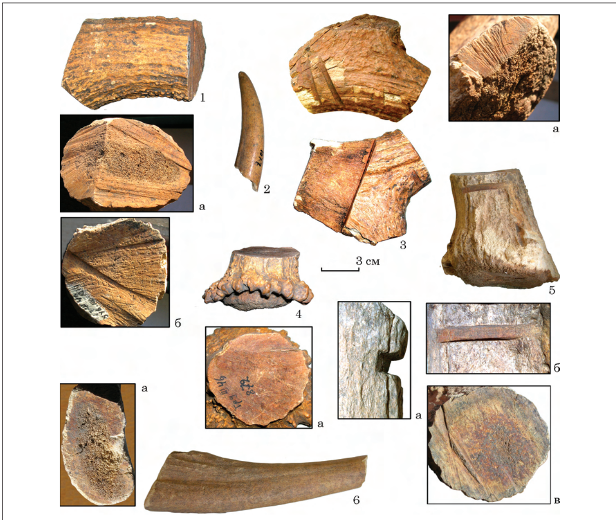
Рис. 6. Мале Городське городище, фрагменти рогів оленя зі слідами обробки

Крім виробів, у колекції є окремі кістки зі слідами обробки, зокрема ребро з слідами роз-