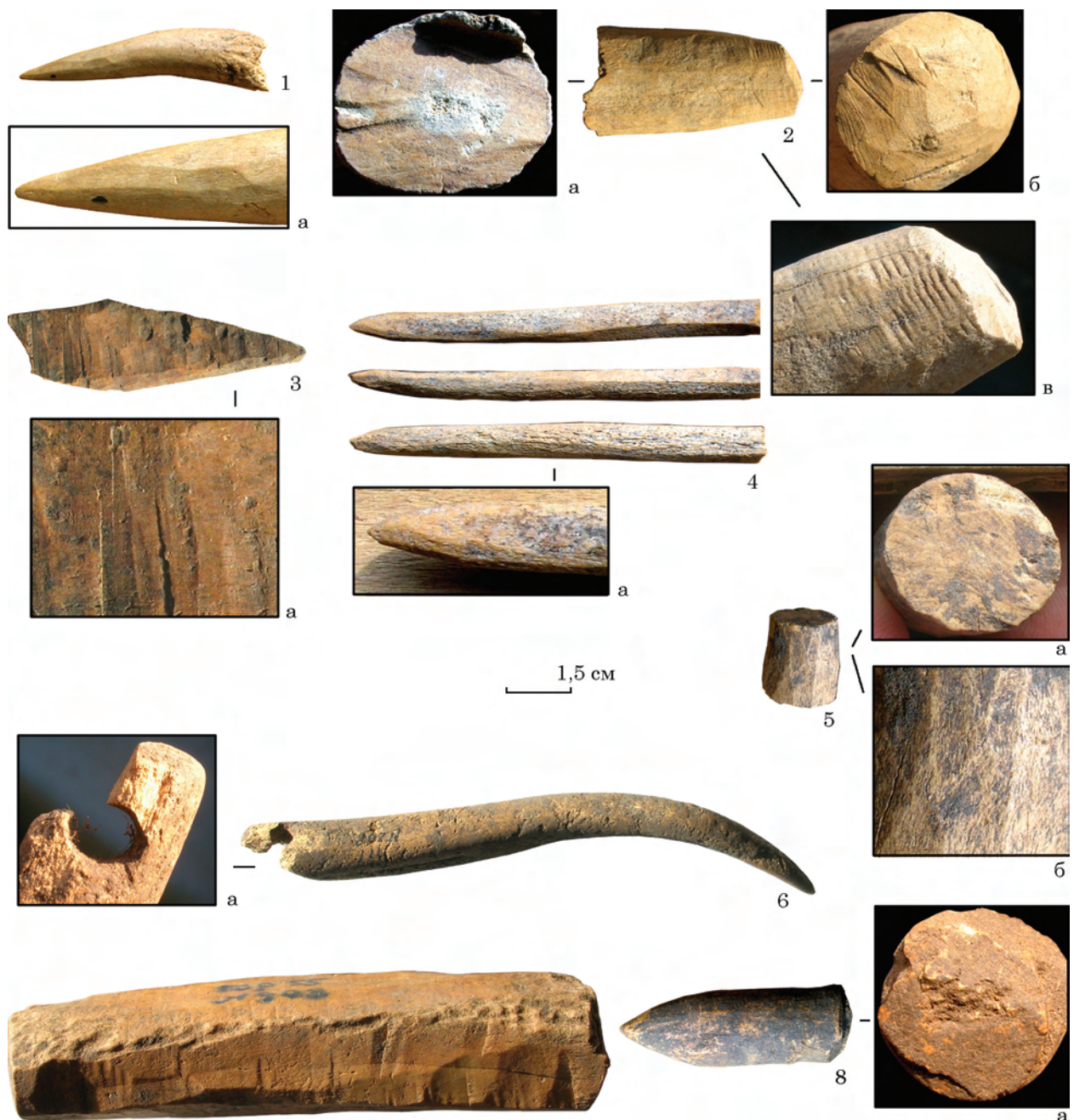
Рис. 5. Мале Городське городище: 4, 6 — знаряддя з рогу, решта — півфабрикати з рогу

Подібні завершення набірних руків'їв з рогу виявлено у Києві (Шовкопляс 1973, рис. 6: 6—8, 12; Івакін та ін. 1998, рис. 104: 7; Сергеева 2011, с. 85, табл. 26: 9), у Теофанії (не опубліковане), на Чорнобильському городищі (Сергеева 2016, с. 155—156, рис. 2: 3, 4) тощо, де вони датуються XII—XIII ст. На півночі Русі, вони з'являються близько середини XIII ст. (Колчин 1982, с. 166). На пам'ятках у Волзькій Булгарії вони побутували протягом булгарського і ординського часів (Руденко 2005, с. 73, табл. 13). Городські знахідки можуть свідчити, що такі завершення продовжували побутувати на Русі у післямонгольські часи, що не перечить загальним хронологічним межах їхнього побутування.