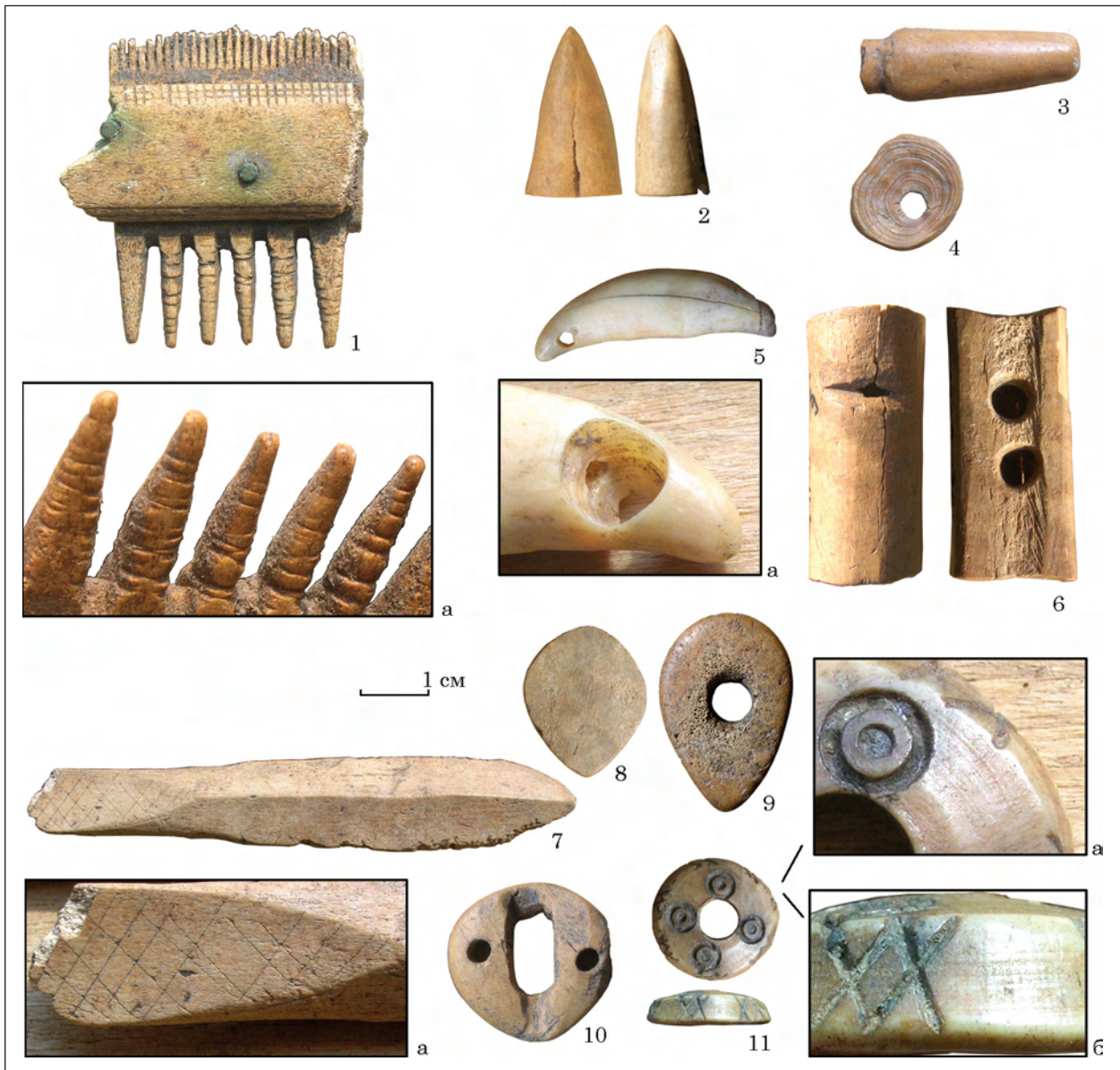
Рис. 1. Мале Городське городище, вироби з кістки й рогу: 1 — гребінь; 2, 7 — наконечники стріл; 3 — застібка (фрагмент); 4, 5 — амулети; 6 — свіщик; 8—10 — завершення набірних руків'їв ножів; 11 — гудзик

Загалом двобічні набірні гребені з кількох частин, скріплених накладками з обох боків, у XII—XIII ст. побутували у широкому ареалі, проте скрізь їх репрезентовано відносно незначним числом екземплярів.