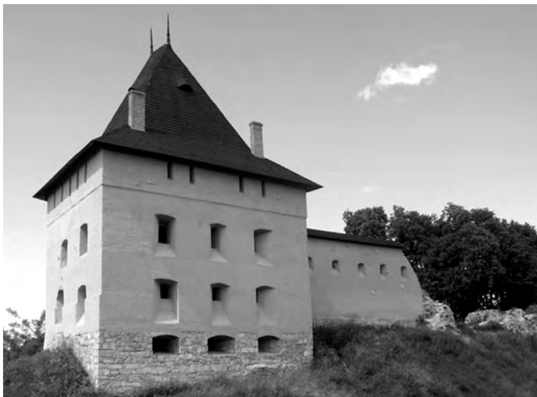
Рисунок 1. Збережена Шляхетська вежа Галицького замку в 2017 р.

Виклад основного матеріалу дослідження. Краєзнавчо-туристичний аналіз атрактивного потенціалу фрагментів Старостинського замку (рис. 1) пропонується проводити на основі