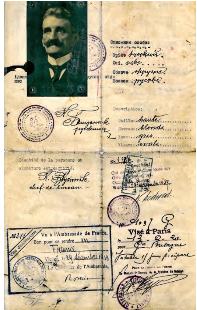
Сторінки дипломатичного паспорта Є. Петрушевича з візами у Францію, 1919-1920 рр. ЦДАГО України, ф. 269, оп. 1, спр. 57, арк. 2зв., 4.