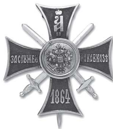
Хрест «За службу на Кавказе»