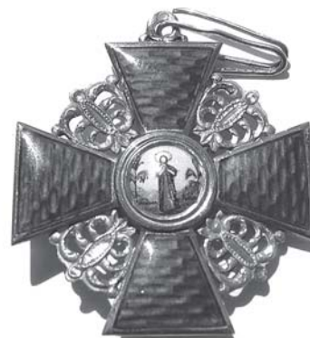
Орден Святой Анни 3-го ступеня