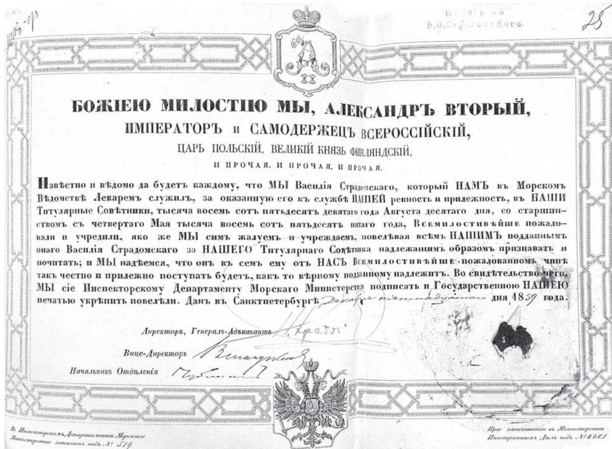
Наказ Олександра II про зарахування Страдомського в титулярні радники