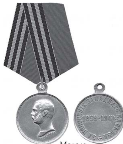
Медаль «За покорение Западного Кавказа 1859–1864»