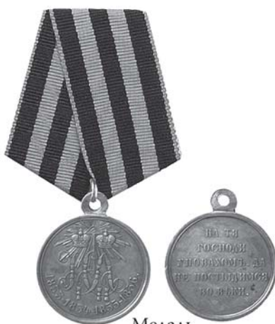
Медаль «В память Крымской войны»