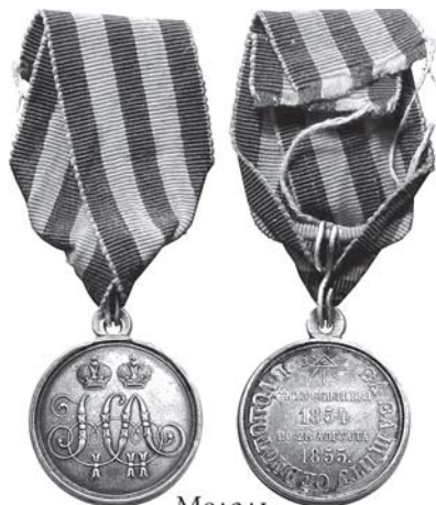
Медаль «За защиту Севастополя»