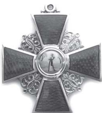
Орден Святой Анни 2-го ступеня