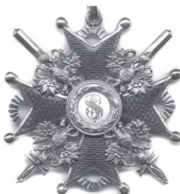
Орден Святого Станіслава 3-го ступеня