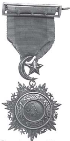
Турецкий орден Меджидіє