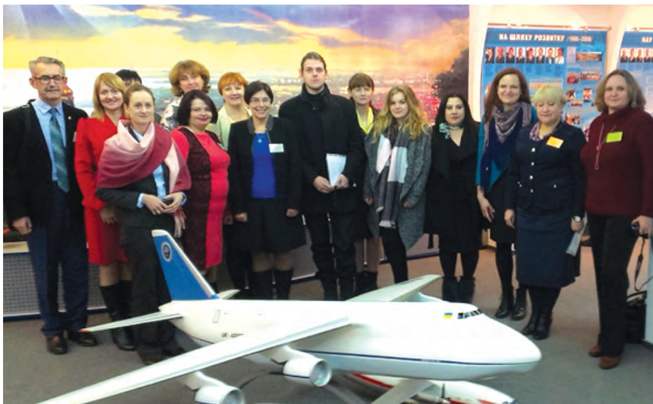
У музеї НАУ

Під час зустрічі учасники конференції подарували бібліотеці університету книжки, а також відвідали унікальний музей рідкісної книги та картинну галерею, які входять до структури університету.