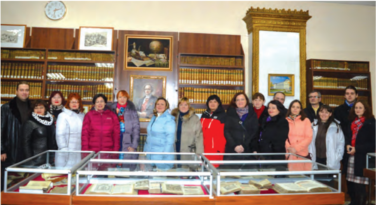
У бібліотеці рідкісної книги Ніжинського державного університету імені М. Гоголя