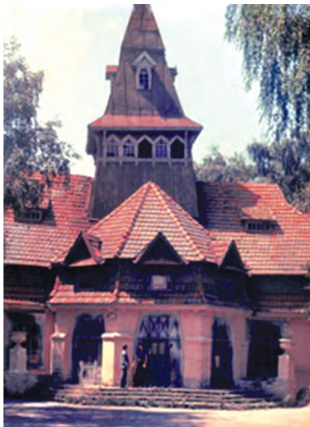
Фото 15. Водолікарня Миргородського курорту. 70-і рр. XX ст.