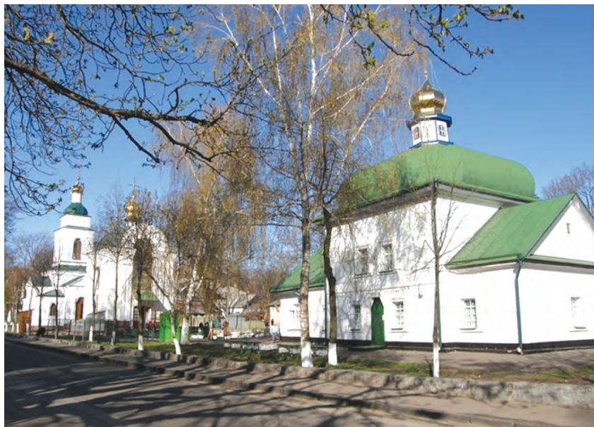
Фото 19. Спаська церква у Полтаві. 2015 р.

(вже другу) Спаської церкви у її первісному вигляді. Побудовану у 2004 р. дзвіницю теж залишили й використовують зараз як каплицю, таким чином історичний комплекс Спаської церкви невіправно спотворено, та й сама церква загубилася серед цих новобудов (фото 19).