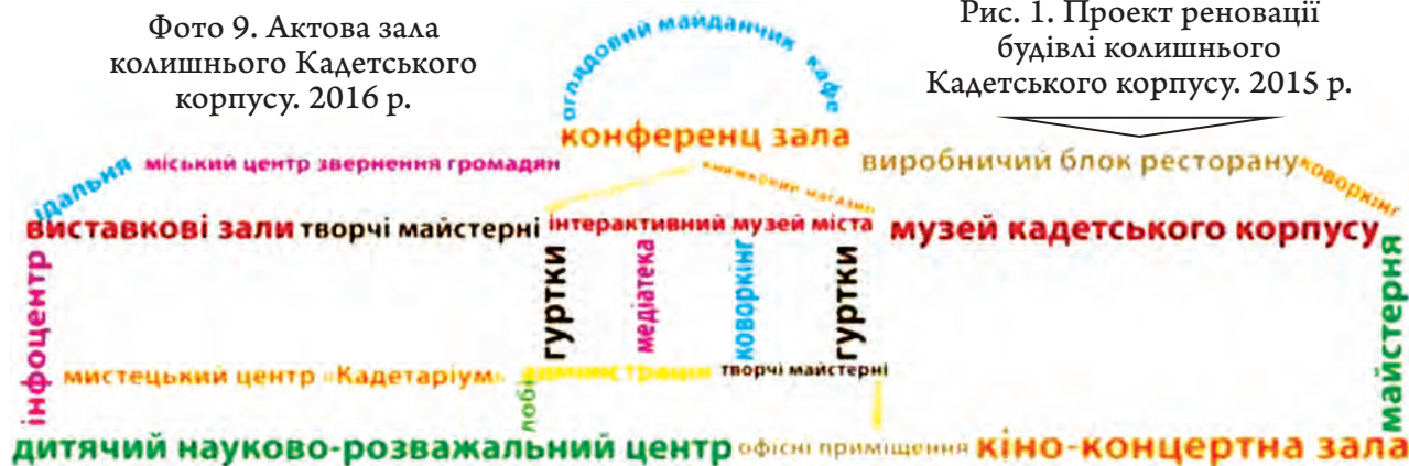
Рис. 1. Проект реновації будівлі колишнього Кадетського корпусу. 2015 р.