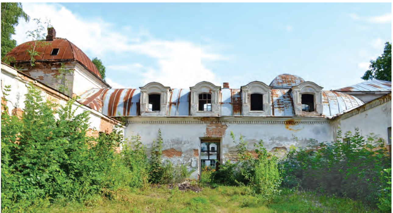
Фото 3. Палац Муравйових-Апостолів. 2011 р.

Палац братів Муравйових-Апостолів у с. Хомутець Миргородського району з 2009 р. є пам'яткою культурної спадщини національного значення Полтавської області, занесеною до Державного реєстру нерухомих пам'яток України. Але після переїзду до нового приміщення Хомутецького ветеринарно-зоотехнічного технікуму, у який 1933 р. трансформувалася сільськогосподарська школа, палац стоїть пустою й поступово руйнується (фото 3). Всі звернення до центральних і місцевих органів влади закінчуються традиційними ще з радянських часів відповідями про відсутність коштів, причому чиновники різного рівня намагаються перекласти відповідальність один на одного, не вирішуючи проблему по суті. Хоча «Планом заходів щодо збереження, реставрації та реабілітації пам'яток культурної спадщини на території області», затвердженим головою Полтавської облдержадміністрації у 2011 р., передбачалося здійснити протягом 2011–2014 рр. «виготовлення науково-проектної документації та виконання ремонтно-реставраційних робіт музею-садиби Муравйових-Апостолів у с. Хомутець» 9 .