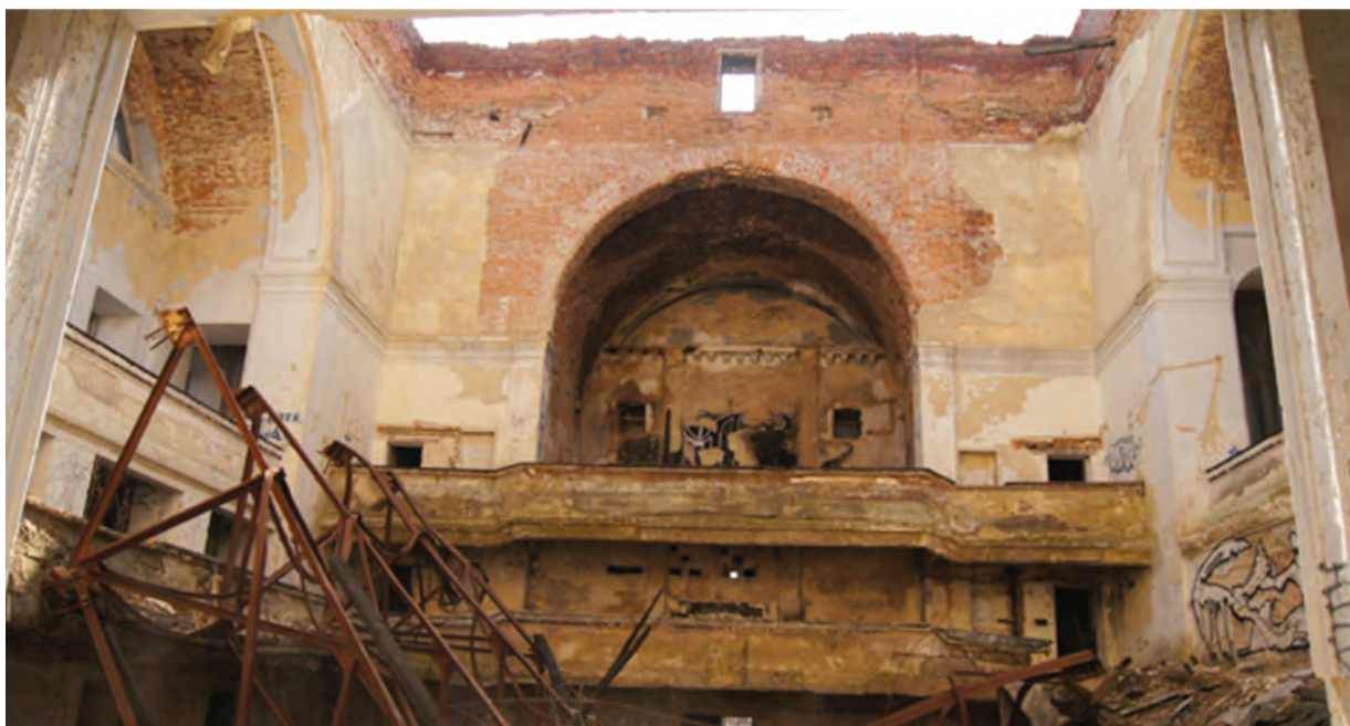
Фото 9. Актова зала колишнього Кадетського корпусу. 2016 р.

Сучасний стан Кадетського корпусу яскраво відображений у 30-хвилинному фільмі-відчутті «Крізь порожнечу», створеному молодими полтавськими документалістами, які ще пам'ятають величну будівлю неушкодженою 16 . Ініціативною групою розроблено проект його реновації у якості культурно-художнього центру для творчої молоді з виставковими, танцювальними та конференц-залами, офісними приміщеннями 17 (рис. 1). Для