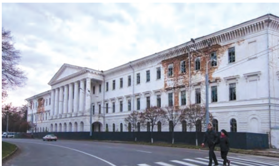
Фото 7. Полтавський Петровський кадетський корпус. 2013 р.

особі, незважаючи на те, що за законодавством пам'ятки культурної спадщини національного значення приватизації не підлягають. Протягом наступного десятиліття йшли судові процеси про повернення Кадетського корпусу у комунальну власність, причому за цей час його приміщення кілька разів горіло, адже ніким не охороняється (фото 7).