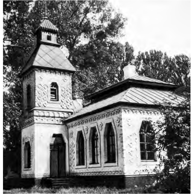
Фото 12. Школа у с. Западинці Лохвицького району, опубліковане В. Чепеликом у статті «Пионер сельской архитектуры»

Вцілілі будівлі потребують термінових ремонтних робіт – протікають дахи, руйнуються нижні яруси облицювання й каркасу. Переважна більшість їх не внесена до реєстру пам'яток культурної спадщини й не охороняються державою, тому з бюджету кошти на їхній ремонт не