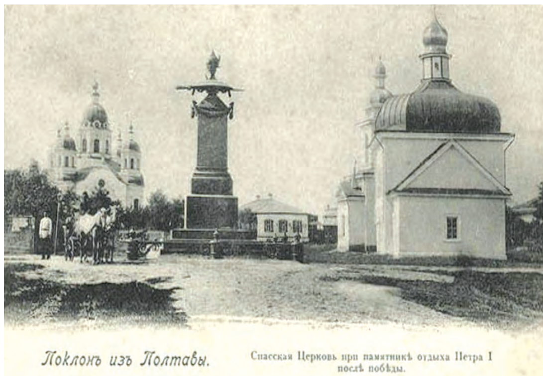
Фото 18. Спаська церква у Полтаві. Поч. XX ст.

Однак вже на початку XXI ст., а саме 2002 р. Полтавський міськвиконком прийняв рішення про відтворення комплексу Спаської церкви. Відповідно до цього рішення був розроблений проект спорудження історичної споруди дзвіниці у її первісних формах та розмірах. Але потім повторилася ситуація, подібна до Свято-Успенського собору: восени 2004 р. за рішенням міської влади на місці історичної дзвіниці поспіхом побудували за зовсім іншим проектом дзвіницю маленького об'єму, аргументуючи це відсутністю коштів 35 . Після чергових місцевих