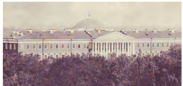
Фото 6. Полтавський Петровський кадетський корпус. Поч. ХХ ст.

До подібного стану доведена ще одна пам'ятка культурної спадщини національного значення Полтавської області, занесена до Державного реєстру нерухомих пам'яток України – Полтавський Петровський кадетський корпус, найбільша за розмірами споруда архітектурно-містобудівного ансамблю Круглої площі в Полтаві. Побудований у 1835–1840 рр. архітектором М. Бонч-Бруєвичем на кошти кількох губерній Кадетський корпус має товщину стін – півтора метра, що ніби то є гарантією довговічності (фото 6). У радянський час його будівля використовувалася за безпосереднім призначенням,