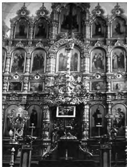
Лютецька. Успенська церква. Поч. 1900-х. 1950-і. 1970-і. Іконостас.

Фото 16. Успенська церква у с. Лютецька Гадяцького району, опубліковано у 12 томі Полтавської Енциклопедії «Полтавіка». Полтава, 2009. – С. 362.