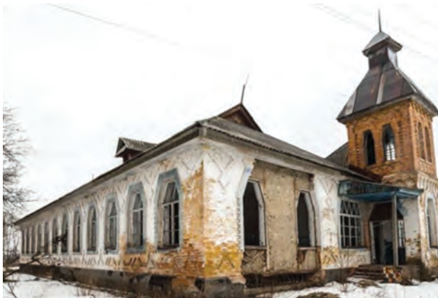
Фото 13. Школа в с. Харсіки Чорнухинського району. 2016 р.