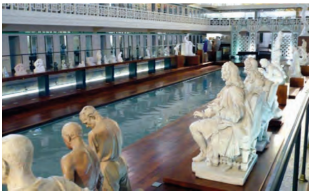
Фото 10. Басейн-музей м. Рубе. 2011 р.

У міжнародній практиці існує доволі багато випадків використання будівель, які втратили свою функціональну цінність, але зберегли яскраві ознаки певних архітектурних стилів, за іншим, іноді досить несподіваним призначенням. Серед найбільш відомих можна згадати басейн-музей у французькому м. Рубе. Побудований у 1927–1932 рр. у стилі ар-деко 40-метровий басейн активно експлуатувався протягом півстоліття, але через зношеність конструкцій у 1985 р. був закритий. Проте мерія Рубе не стала руйнувати цю цікаву пам'ятку, навпаки, комплекс реконструювали й 2001 р. відкрили в ньому музей мистецтва та промисловості. Простір колишнього басейна використаний як виставкова зала: обабіч водної поверхні завмерли статуї відпочивальників, у роздягальнях і душових облаштовані вітрини з зразками прикладного мистецтва, збережена яскрава архітектурна стилістика 30-х років минулого століття (фото 10). Цей музей суттєво додав туристичної привабливості такому невеличкому місту на півночі Франції, як Рубе, адже за рік його відвідує 200 тис. осіб. На жаль, українські можновладці звикли рахувати миттєвий прибуток, а не очікувати якихось дивідендів від вкладених у реставраційні роботи коштів, а позаяк вони у 5-10 разів дорожчі, ніж