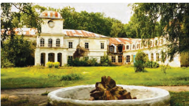
Фото 5. Центральний вхід палацу Муравйових-Апостолів. 2013 р.

цієї душі – осіб без певного місця проживання 10 . Не менш занедбаний і старовинний пейзажний парк навколо палацу площею 77 га. У 1960 р. йому надано статус пам'ятки садово-паркового мистецтва загальнодержавного значення, хоча ще у 1927 р. округовим центральним пролетарським музеєм Лубенщини пропонувалося взяти під охорону держави парк і взагалі весь маєток як мистецьку та історичну пам'ятку 11 . В парку ростуть липи, берези, граби, й хоч більшість з них уже самосів, проте ще залишились деякі дерева старіше 200 років. Його окрасою залишається потрійний дуб, посаджений І. Муравйовим-Апостолом на честь синів-декабристів, як нагадування про родинну та історичну драму. За палацом знаходиться ставок, на якому в часи розквіту маєтку був острівець з бесідкою, але зараз все захаращене і потребує прочистки 12 . Складається враження, що до 200-річчя повстання декабристів їхнє родинне гніздо просто не доживе.