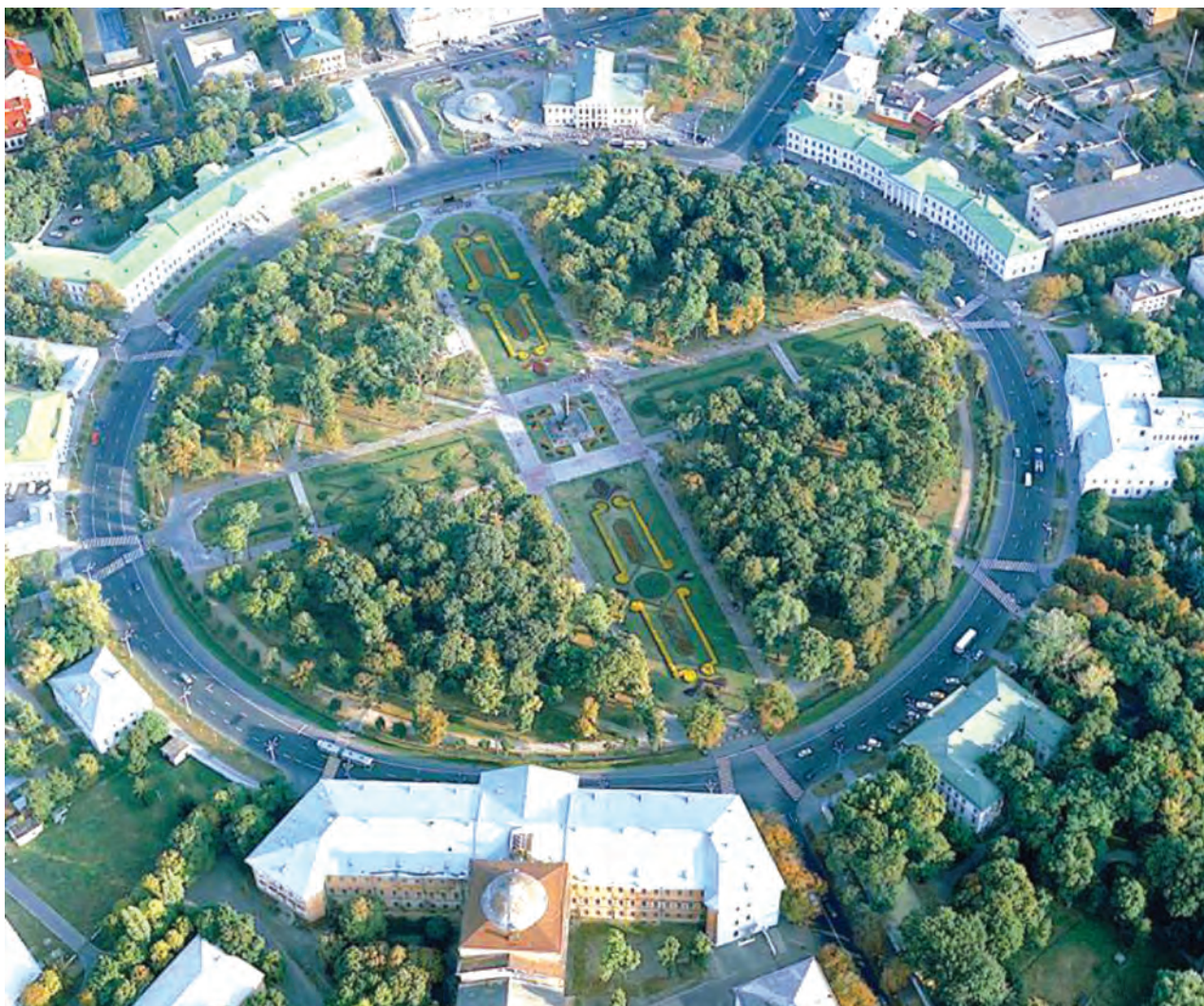
Фото 1. Кругла площа у Полтаві. 2000-і рр.