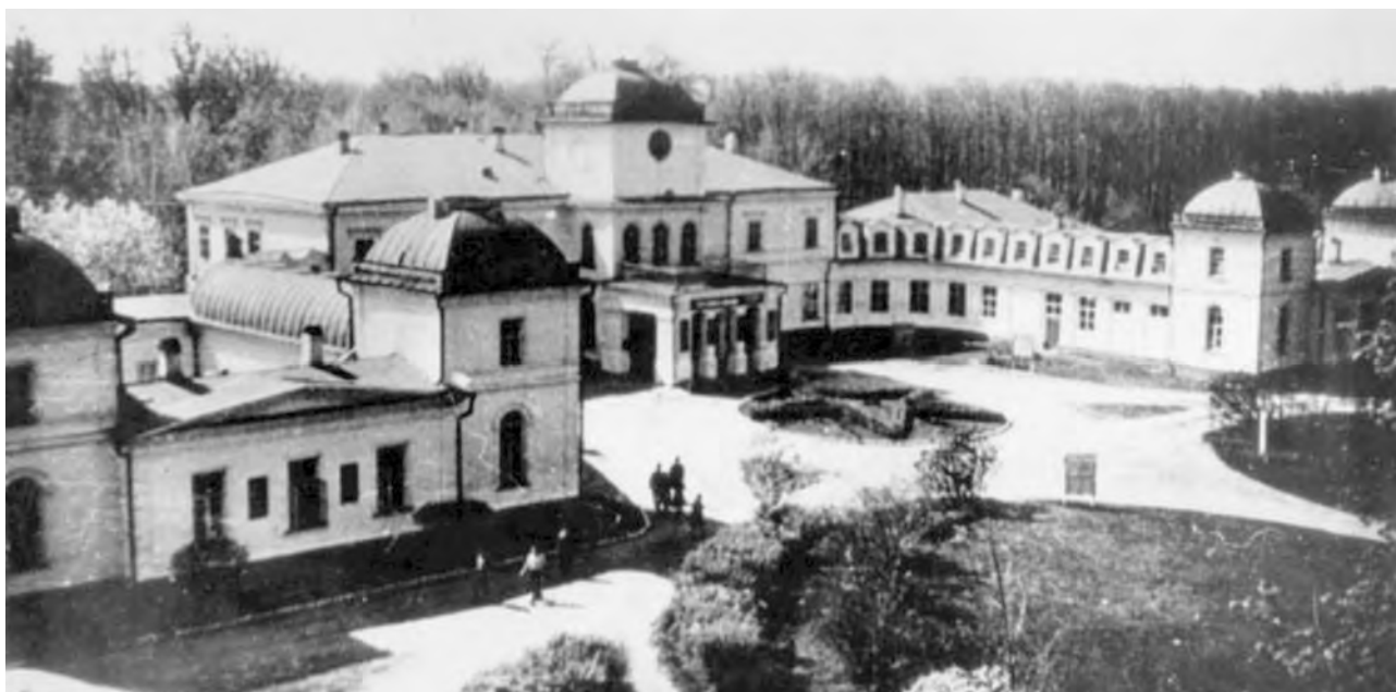
Фото 2. Палац Муравйових-Апостолів. 60-і рр. XX ст.