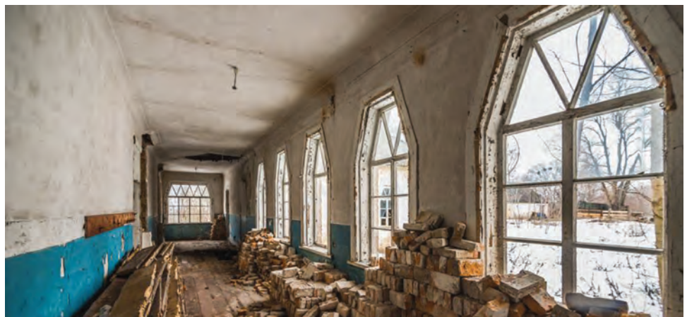
Фото 14. Інтер'єр Харсіцької школи Чорнухинського району. 2016 р..

виділяються. Для включення шкіл до вказаного реєстру, спочатку їх потрібно описати, але навіть на це не виділяються кошти. Більше п'яти років долею архітектурних пам'яток із віковою історією опікується відома журналістка й громадська діячка О. Герасим'юк, завдяки наполегливості якої перші шість шкіл (по три в Лохвицькому районі Полтавської та Роменському районі Сумської областей) у 2013 р. були внесені до переліку щойно виявлених об'єктів культурної спадщини. Навколо ідеї збереження унікальних зразків українського архітектурного модерну об'єдналися архітектори, журналісти,