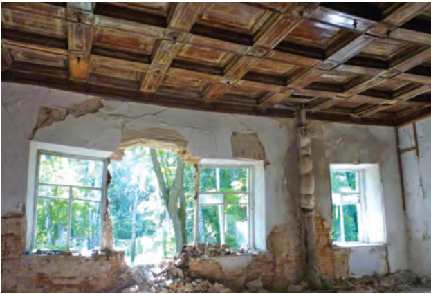
Фото 4. Дерев'яна стеля у залі, в якій був музей-кімната декабристів. 2013 р.