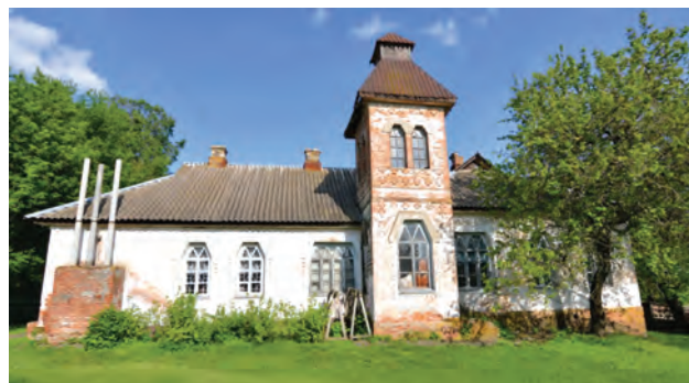
Фото 11. Школа у с. Чорнухи Чорнухинського району. 2016 р.