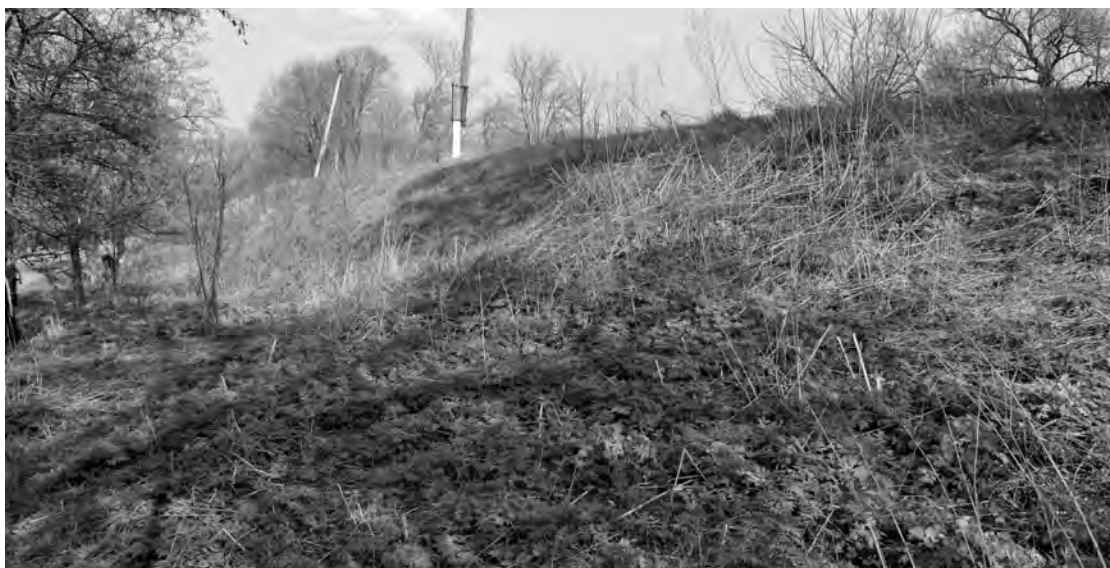
Рис. 5. Старосанжарська фортеця. Ділянка північного валу. Фото 2016 р.

В східному куті фортеці вал знівельований до рівня майданчику городища і далі простежити його насип практично неможливо. Вздовж краю балки, знищений ерозією її схилів, вал майже не фіксується. Його незначні відрізки приховані чагарником. Ця, південно-східна, лінія укріплень мала орієнтовну довжину близько 200 м. Так самопроблематично простежити вал південно-західної лінії укріплень фортеці – де на плані В.Г. Ляскоронського відмічена