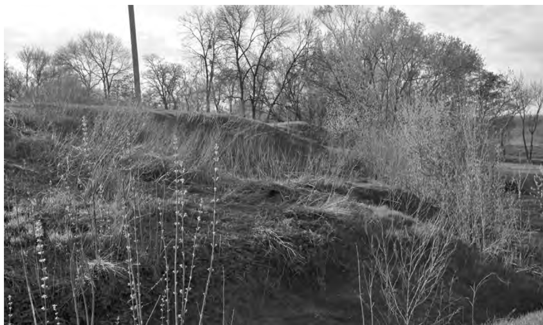
Рис. 6. Старосанжарська фортеця. Ділянка східного валу. Фото 2016 р.