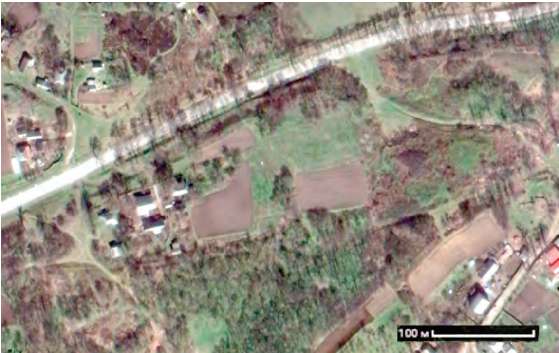
Рис. 3. Старосанжарська фортеця. Супутникове фото Google.

Укріплення представлені земляним валом, який найкраще зберігся з північно-західної та північно-східної сторін фортеці. Довжина валу північно-західної лінії укріплень (вздовж вул. Старосанжарської) складає приблизно 190 м, його висота коливається від 1,5 до 3 м (рис. 4), а наближаючись до північного кута фортеці сягає