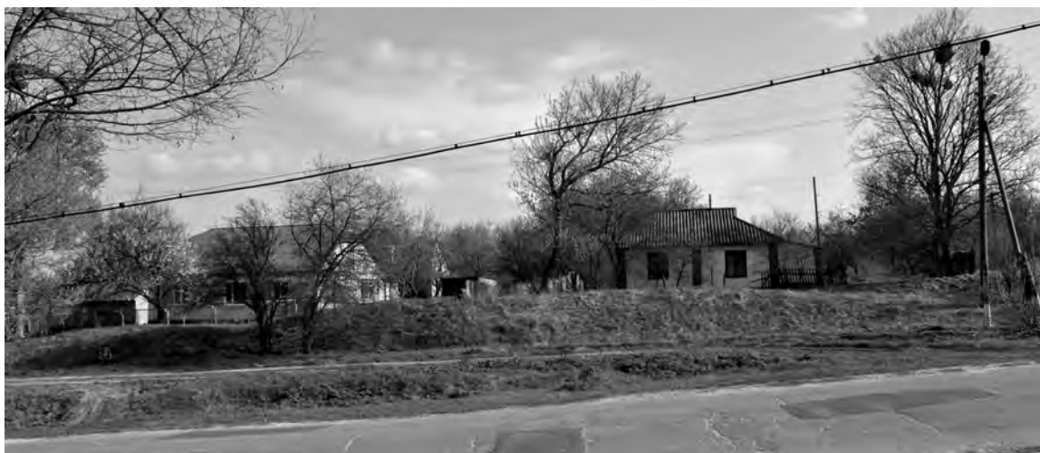
Рис. 4. Старосанжарська фортеця. Ділянка валу в північно-західному куті. Фото 2016 р.