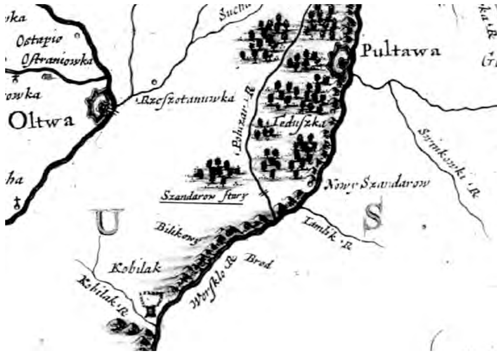
Рис. 1. Старі Санжари на «Карті Київського воєводства» Г.Л. де Боплана (1650 р.)

Санжарів приписується шляхтичу Казаковському або Казановському 20 . На карті Київського воєводства 1650 р. топонім «Szandarowstary» позначає переправу на р. Полузир'я (рис. 1).