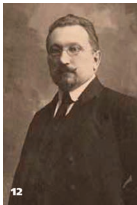
12 Андрій Ливицький – голова дипломатичної місії УНР у Польщі. 1920 р.