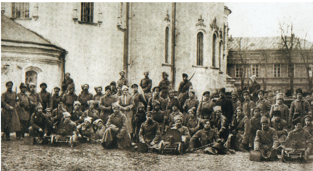
Гайдамацький кіш Словідської України (в центрі С.Петлюра). 1918 р.