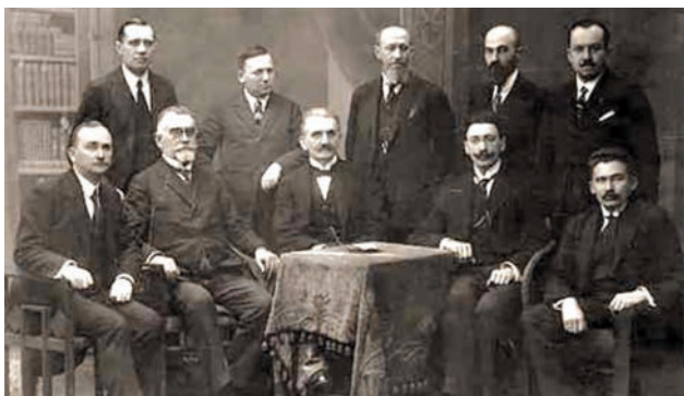
Представники влади Західно-Української Народної Республіки (сидять в центрі: К.Левицький, Є.Петрушевич, Л.Цегельський). 1920 р (?).