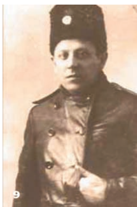
9 Симон Петлюра – делегат Всеукраїнських військових з'їздів у Києві. 1917 р.