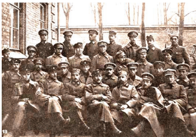
13 Київське формування січових стрільців (в центрі – Є.Коновалець).