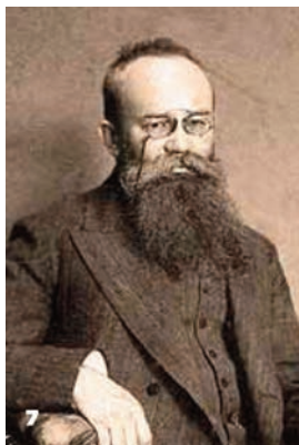
7 Михайло Грушевський – голова Української Центральної Ради. Львів, до 1917 р.