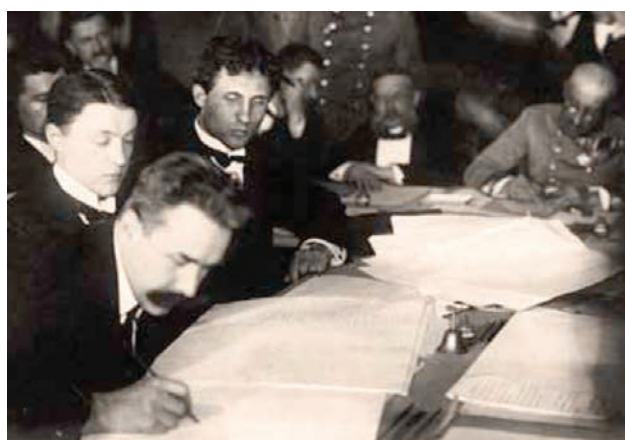
Микола Левитський підписує Берестейську угоду. 9 лютого 1918 р.