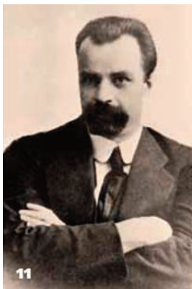
11 Володимир Винниченко – голова Генерального секретаріату УЦР. 1917 р.