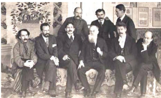
Фундатори Української академії мистецтв. Стоять: Георгій Нарбут, Василь Кричевський, Михайло Бойчук; сидять: Абрам Маневич, Олександр Мурашко, Федір Кричевський, Михайло Грушевський, Іван Стешенко, Микола Бурачек. Київ, 5 грудня 1917 р.