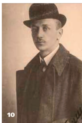
10 Петро Чикаленко – секретар українського посольства в Стамбулі. 1919 р.