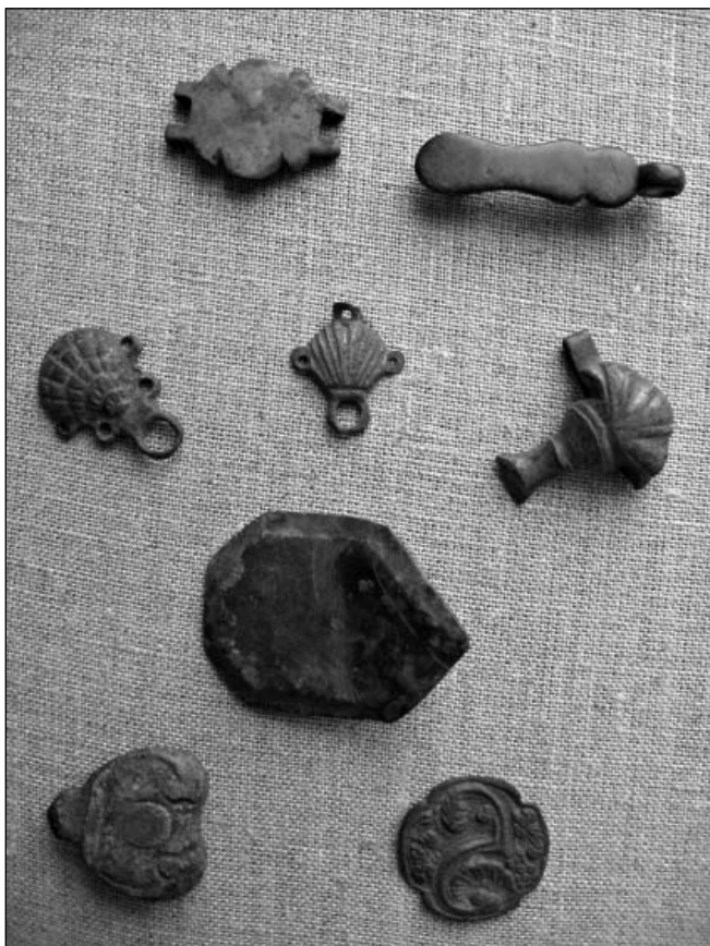
Платівки з фондів НЗ «Глухів»

особливості залишаються незмінними. Розгадати таємницю використання шкіряного ремня з кільцем та гудзиками допомогли провідні спеціалісти з кінного спорту. Їм виявився елемент кінської упряжі – мартингал. Це ремінь, що йде від вудил до нагрудника, щоб утримувати голову