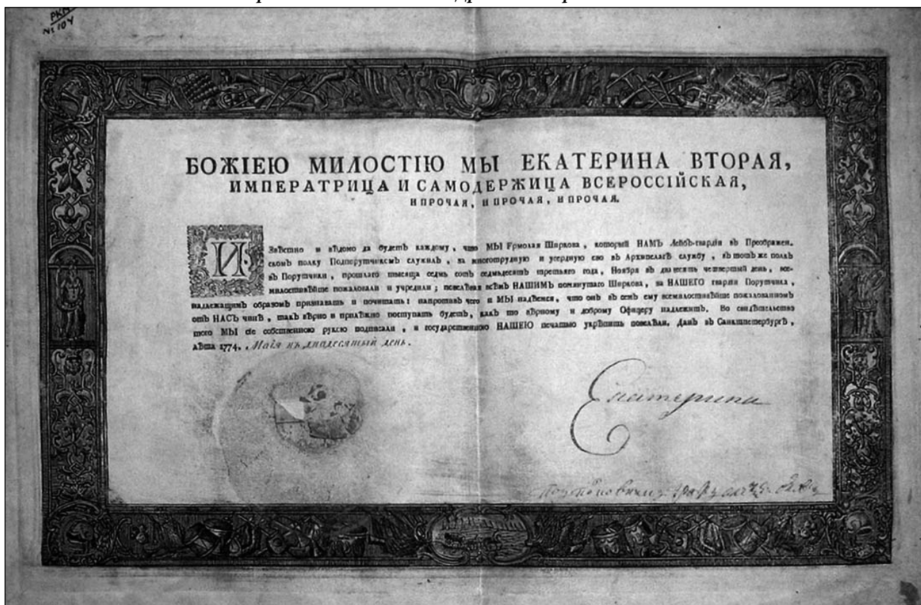
Патент на производство подпоручика лейб-гвардии Преображенского полка Ермолая Ширкова в чин поручика. 12 мая 1774 г. с автографом Екатерины II