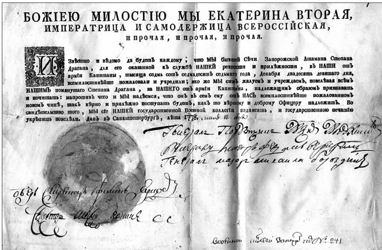
Патент атамана Запорозжской Сечи Степана Драгана на производство в чин капитана. 1778 г.