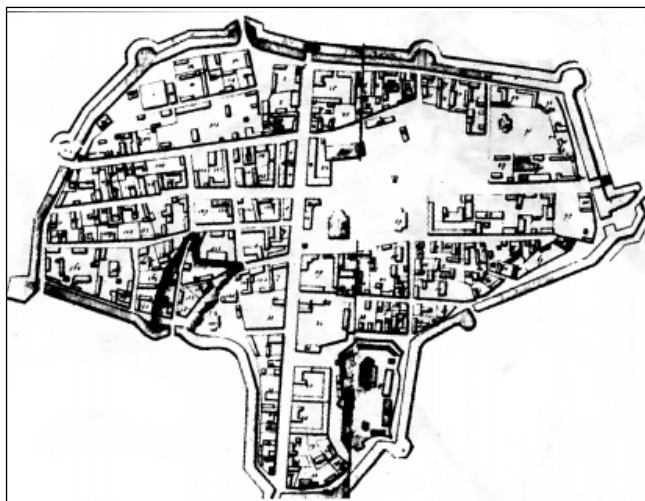
Рис. 1. План центральної частини Глухова обер-квартирмейстера Магнуса фон Ренне 1750 р.

У цей період удовою литовського дворянина Марка Кимбари Агафією засновано і Глухівський дівочий монастир [2, 26]. Спочатку він знаходився у селі Чернеччина (зараз район суконної фабрики) і носив назву Спасо-Преображенського. Пізніше, у