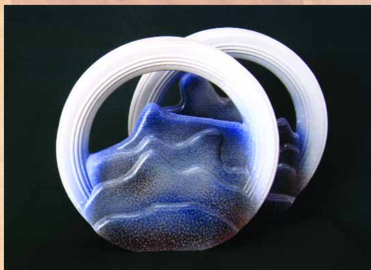
Декоративна композиція "За горами гори". Фаянс, емалі, д. 47 x 12, 2 частини, 2002 р.