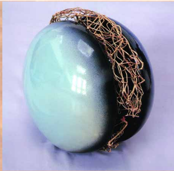
Декоративна пластика "Планетарний пояс". Кам'яна маса, емалі, метал, д. 45 x 33 см, 2005 р.