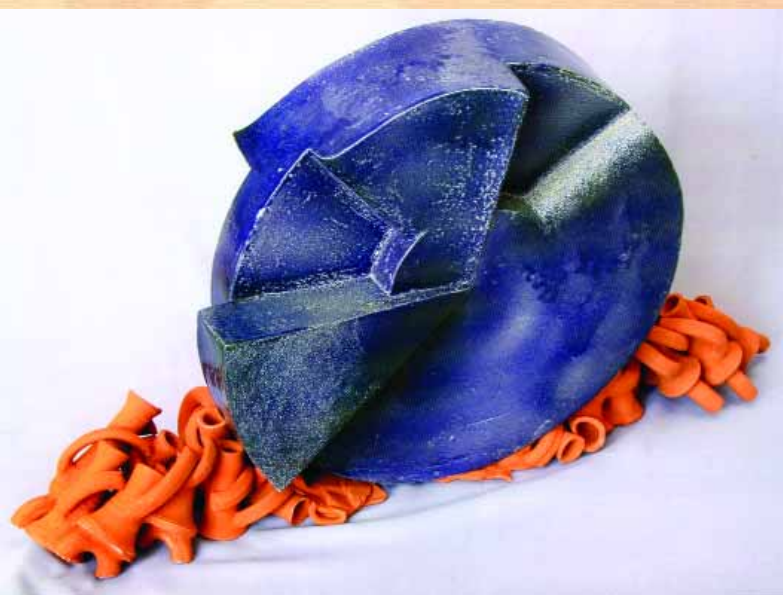
Декоративна композиція "Колесо історії". Шамотна маса, емалі, глина, гончарний круг, 3 частини, 2006 р.