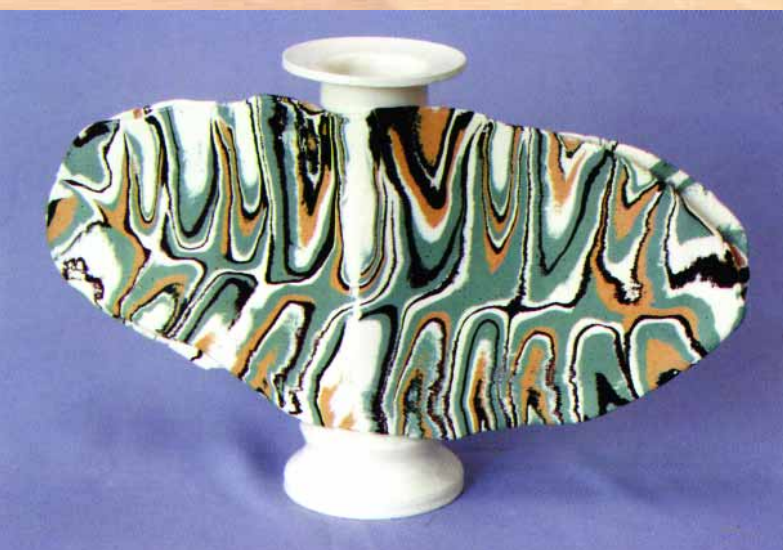
Декоративна пластика "Метелик". Фаянс, пігменти, гончарний круг, 33 x 53 x 14 см, 2004 р.