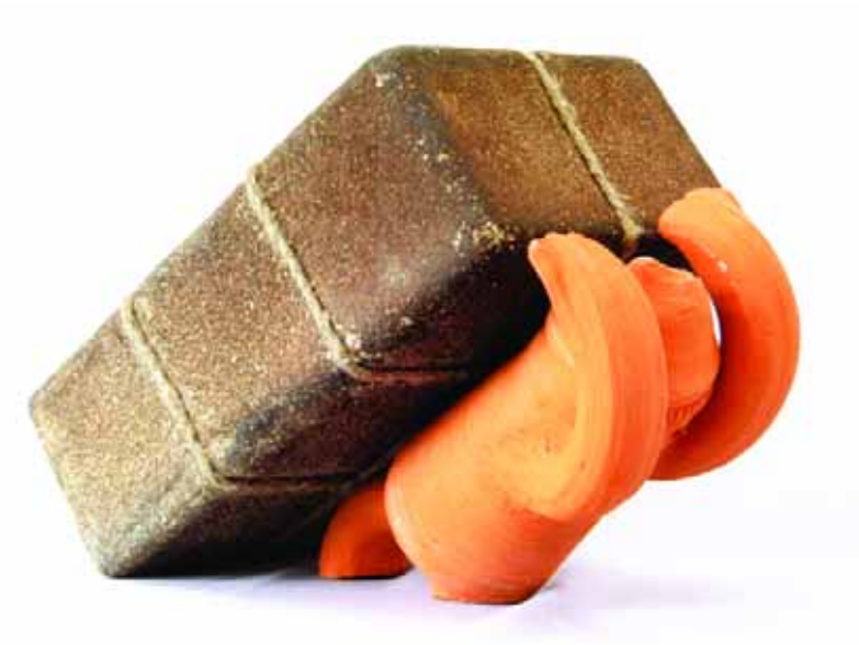
Декоративна композиція "Ноша". 2 частини, шамотна маса, глина, гончарний круг, 40 x 14 x 23; 37 x 18 x 13 см, 2005 р.