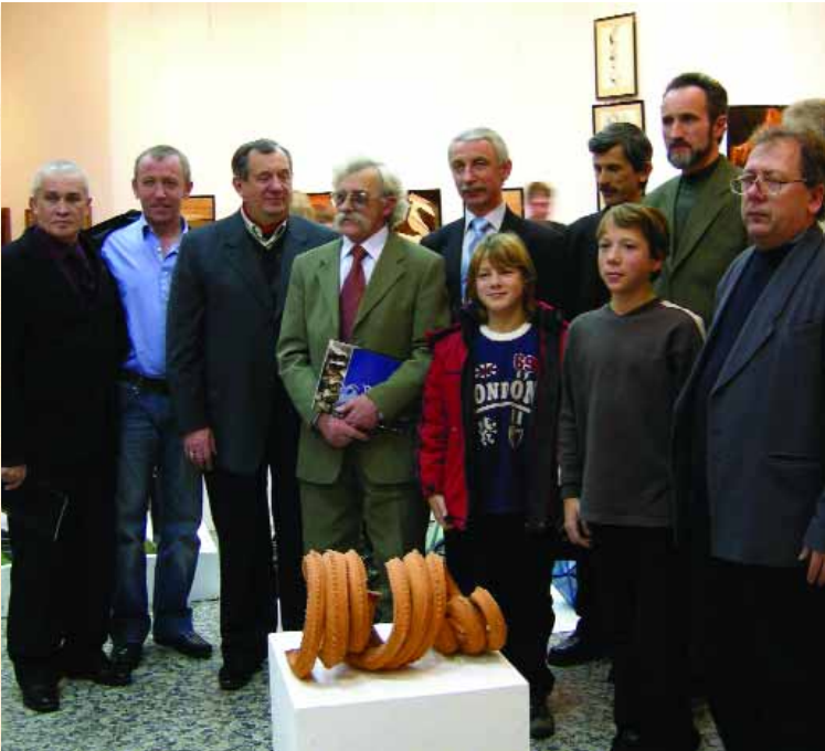
Члени Чернігівського земляцтва — шанувальники таланту свого знаменитого земляка