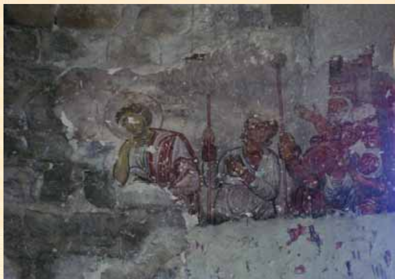
Фрагмент фрески XI ст.

Храм в Опізі (засновано у кінці V ст., відновлено у першій чверті IX ст.), як і Тбетський храм (поч. X ст.), має ошатне оформлення зовнішніх стін — три арки у вигляді напівкруглих валиків, середня з яких є вищою за бокові. Такий прийом оформлення стін перейшов згодом до всіх храмів Іспирської ущелини. Характерним є й архітектурне вирішення віконних отворів: заглиблення