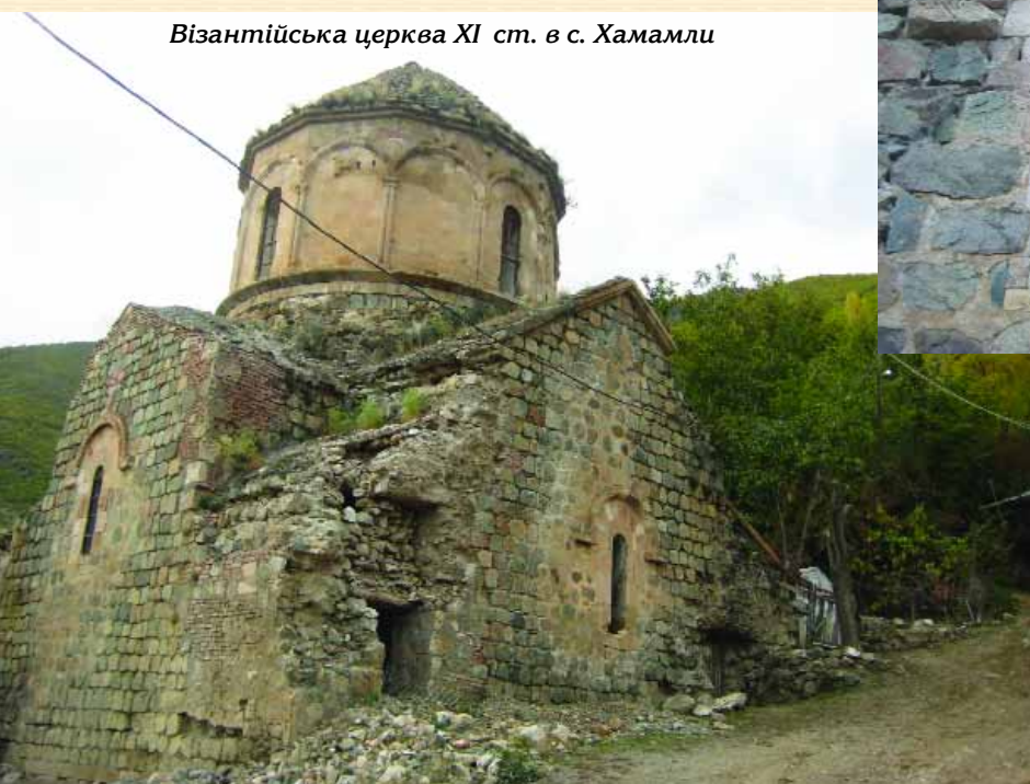
Візантійська церква XI ст. в с. Хамамлі

Після нападу арабських завойовників (у 30-х роках VIII ст.) деякі храми було зруйновано, і лише після приходу до влади грузинської династії Багратидів почалося відродження монастирського будівництва та відбудова понівечених храмів.