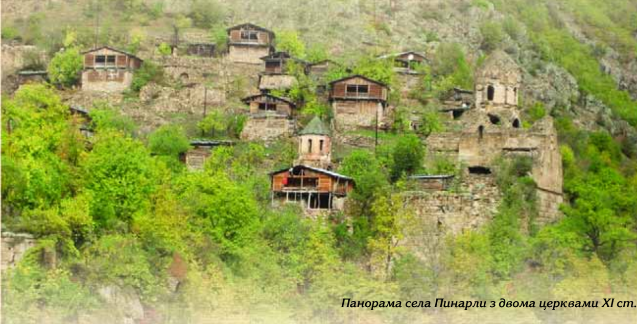
Панорама села Пинарлі з двома церквами XI ст.

Н а території сучасної Туреччини збереглося напрочуд багато православних храмів та монастирів IX–XI ст., які сьогодні охороняються турецьким законодавством. Мої подорожні нотатки стосуються лише тих пам'яток, що розташовані на північному сході країни. До першої світової війни це був Альтинський округ Карської області, тепер — провінція Артвін. Ця місцевість та її природа описані англійським мандрівником Вільямом Гамільтоном (1836) та німецьким ботаніком-дендрологом Карлом Генріхом Кохом (1846), які відвідали ці місця у першій половині XIX ст.